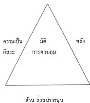
รูปที่ 1 แสดงมิติของการควบคุม

ความสามารถในการศึกษาทางไกลนั้นขึ้นอยู่กับความสามารถในการควบคุม ซึ่งมีองค์ประกอบ 3 ด้าน ด้านแรก คือ ด้านความเป็นอิสระ เป็นด้านที่ผู้เรียนมีความเป็นอิสระในการกำหนดหรือเลือกวัตถุประสงค์และเป้าหมายในการเรียนเอง มีความสามารถในการวินิจฉัยความต้องการของตนเอง และสามารถดำเนินการเรียนด้วยตนเองได้ หรือมีความสามารถในการนำตนเอง (self-directed) มีความเป็นตัวของตัวเอง ไม่จำเป็นต้องคอยพึ่งพาผู้อื่น ซึ่งลักษณะนี้เหมาะกับผู้เรียนที่เป็นผู้ใหญ่ ด้านที่สองคือด้านพลัง เป็นความสามารถหรือประสิทธิภาพของผู้เรียนที่จะรับผิดชอบในการเรียน สามารถควบคุมสถานการณ์ในการเรียนรู้ องค์ประกอบที่เกี่ยวข้องกับด้านนี้ ได้แก่ ทักษะคิดต่อการเรียน แบบการคิด อัตมโนทัศน์ ระดับแรงจูงใจของผู้เรียน ทักษะการเรียน และความสามารถในการเรียนในสิ่งที่ศึกษานั้น ด้านสุดท้ายคือด้านสิ่งสนับสนุน หมายถึง แหล่งความรู้ที่ผู้เรียนสามารถเข้าใช้หรือค้นคว้าได้ เพื่อสนับสนุนการเรียนการสอน ซึ่งเป็นได้ทั้งสื่อบุคคล วัสดุ อุปกรณ์ ตลอดจนการติดต่อสื่อสารกับทางสถาบันการศึกษา องค์ประกอบทั้ง 3 ด้านนี้ถ้าผู้เรียนสามารถจัดให้เกิดความสมดุลได้ ผู้เรียนนั้นก็สามารถควบคุมการเรียนในระบบการศึกษาทางไกลได้ อย่างไรก็ตาม มิติของการควบคุมนี้ยังอยู่ภายใต้องค์ประกอบที่สัมพันธ์กันระหว่างผู้เรียนกับผู้สอนที่มีการติดต่อสื่อสารเพื่อช่วยให้ระบบการศึกษาทางไกลบรรลุผลสำเร็จ ด้วยแนวความคิดดังกล่าวนี้ แกรรริสันและบายตันันได้เสนอความสัมพันธ์ระหว่างองค์ประกอบต่างๆ ดังปรากฏในรูปที่ 1 และ 2