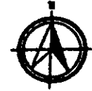
แผนที่จังหวัดขอนแก่น