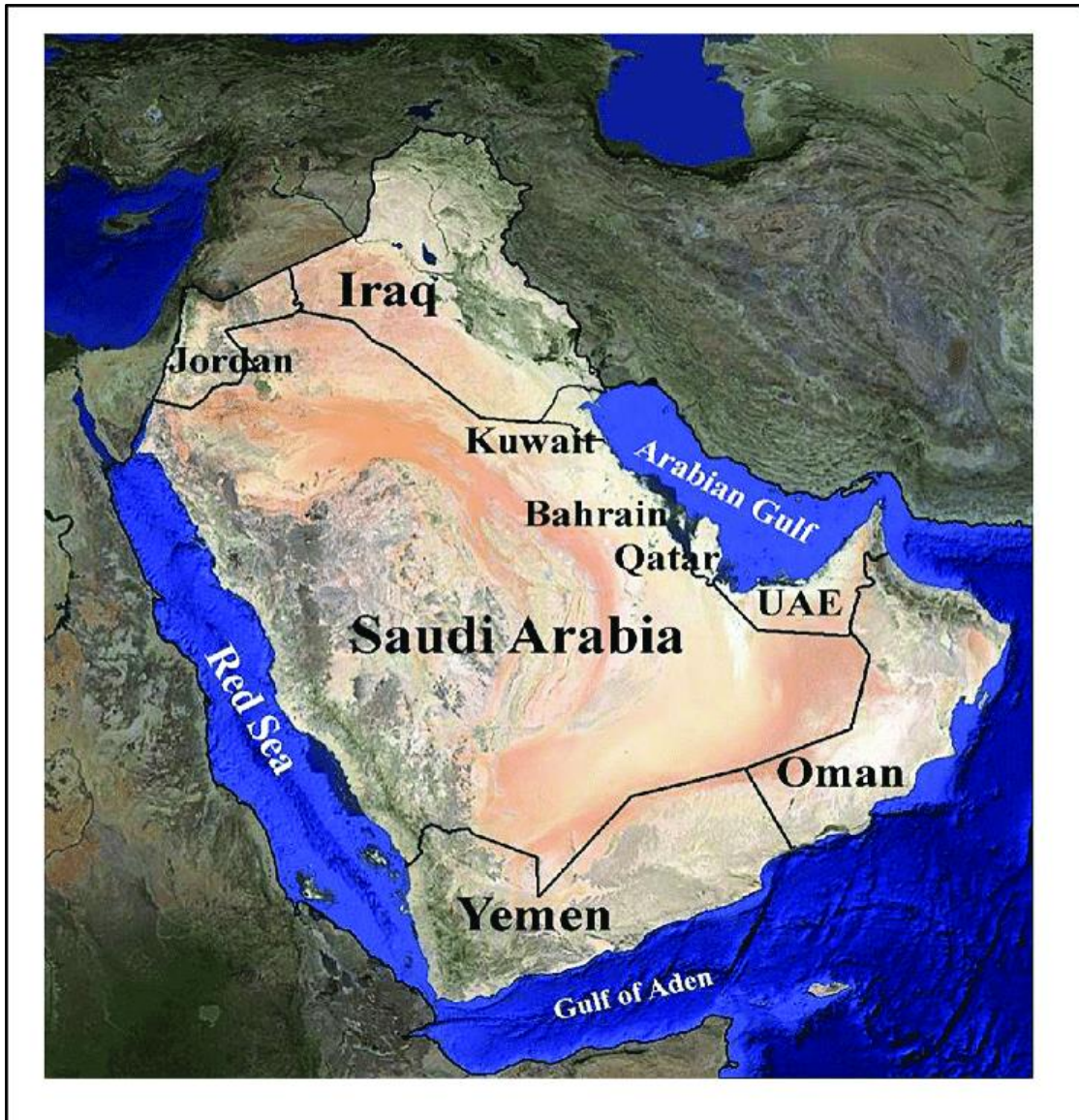
รูปภาพที่ 1 ประเทศในคาบสมุทรอาระเบีย ได้แก่ คูเวต บาห์เรน กาตาร์ สหรัฐอาหรับเอมิเรตส์ โอมาน เยเมน และซาอุดีอาระเบีย

ที่มา : Mosa, Kareem, Sanjay Gairola, Rahul Jamdade, Ali El-Keblawy, Khawla Shaer, Eman Harthi, Hatem Shabana, and Tamer Mahmoud. "The Promise of Molecular and Genomic Techniques for Biodiversity Research and DNA Barcoding of the Arabian Peninsula Flora." Frontiers in Plant Science 9 (01/21 2019). https://doi.org/10.3389/fpls.2018.01929 .