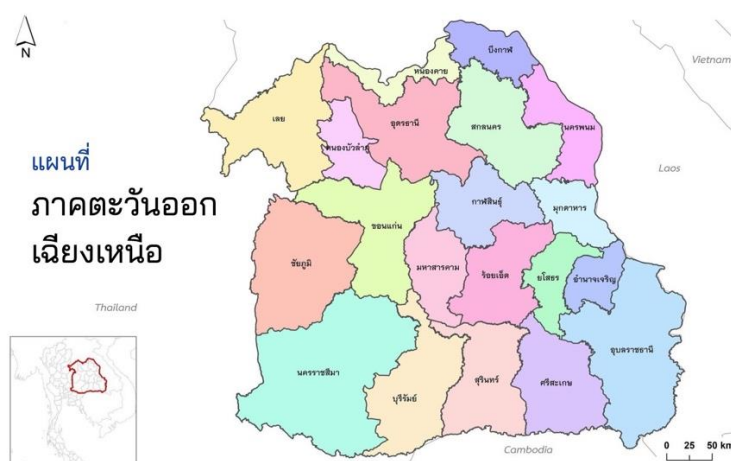
ภาพที่ 1 แผนที่ภาคตะวันออกเฉียงเหนือ

ศรีศักร วัลลิโภดม (2546) เรียกชุมชนชาวอีสานเหนือนี้ว่า “ชุมชนอีสานลุ่มน้ำโขง” หมายถึง ชุมชนอีสานที่อาศัยอยู่ในบริเวณที่ราบลุ่มริมฝั่งตะวันตกของแม่น้ำโขง เป็นบริเวณที่อยู่ถัดจากแนวเทือกเขาภูพานลาดเอียงไปทางเหนือ มีลักษณะเป็นแอ่งลุ่มต่ำ ซึ่งเรียกกันว่า แอ่งสกลนคร ได้แก่จังหวัดเลย หนองคาย อุตรธานี สกลนคร และนครพนม รวมถึงที่ราบลุ่มตามลำน้ำสายต่าง ๆ ที่ไหลลงสู่แม่น้ำโขงในบริเวณดังกล่าว