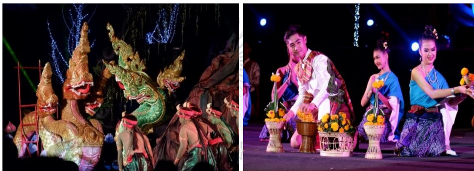
ภาพที่ 13 การแสดง แสง สี เสียง เปิดตำนานบั้งไฟพญานาค ในงานเทศกาลออกพรรษาและบั้งไฟพญานาคโลก อำเภอเมือง จังหวัดหนองคาย ปี 2562

เปิดตำนานบั้งไฟพญานาคแล้ว ยังมีนิทรรศการเรือยาวโบราณ โดยจัดเป็นขุมนิทรรศการอยู่บริเวณ ลานวัฒนธรรมริมโขง โดยมีการนำเรือยาวโบราณมาจัดแสดงให้ประชาชนและนักท่องเที่ยวได้ชม รวมทั้งการจัดแสดงประวัติของเรือแต่ละลำบนบอร์ดจัดนิทรรศการให้ความรู้ การแสดงนิทรรศการเรือยาวในงานออกพรรษานี้แสดงให้เห็นว่าชุมชนชาวจังหวัดหนองคายมีความผูกพันกับแม่น้ำโขง และมีประเพณีการแข่งขันเรือยาวมาตั้งแต่โบราณ เรือที่จัดแสดงเป็นเรือประจำชุมชนที่ใช้ในการแข่งขันในงานประเพณีออกพรรษาและงานอื่น ๆ เช่น เรือนางพญาคำปลิว เรือเจ้าแม่ปทุมรัตน์ เรือฉัตรชัยนาวา และเรือแก้วคุณเมือง เป็นต้น