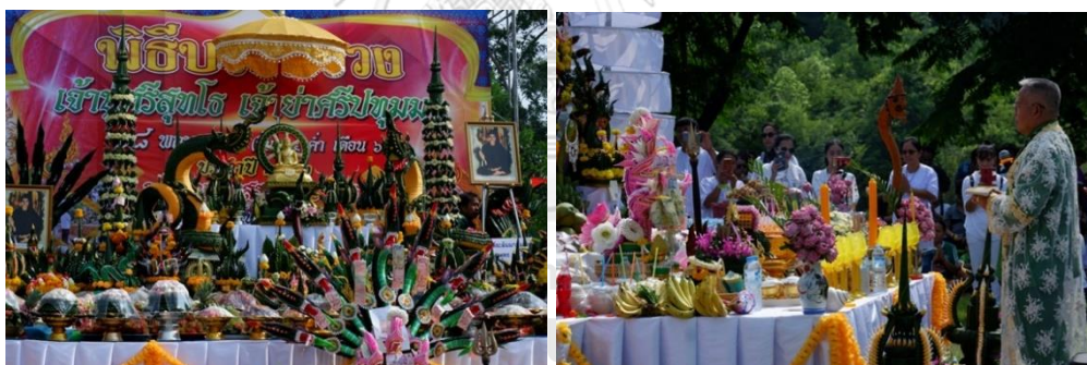
ภาพที่ 6 พิธีบวงสรวงใหญ่เจ้าปู่ศรีสุทโธเจ้าย่าศรีปทุมมา พ.ศ. 2562

ผู้วิจัยสังเกตว่าเครื่องบวงสรวงสักการะในงานวันนี้มีเป็นจำนวนมาก หากนับเฉพาะเครื่องบายศรีพญานาคขนาดใหญ่ที่มีลักษณะเป็นบัลลังก์ 9 เศียรขนาดใหญ่มีจำนวนนับสิบ เครื่องสักการะบวงสรวงหลักที่อยู่บนเวทีคือ พระพุทธรูปที่ตั้งอยู่กลาง และมีพญานาคสองตนขนบอยู่ซ้ายขวา โดยเป็นพญานาคเศียรเดียวองค์ใหญ่ที่ประดิษฐานมาจากใบตอง เป็นวัตถุสัญลักษณ์ที่หมายถึงเจ้าปู่ศรีสุทโธเจ้าย่าศรีปทุมมา ที่คอยปกป้องคุ้มครองศาสนา และมีป้ายที่ทางคณะกรรมการจัดงานจัดทำขึ้น มีข้อความว่า “องค์สมเด็จพระสัมมาสัมพุทธเจ้า ชาตินไทย ศาสนาพุทธ พระมหากษัตริย์ ถวายพระราชกุศลพระบาทสมเด็จพระเจ้าอยู่หัว” ส่วนเครื่องบวงสรวงอื่น ๆ จะเป็นของหวาน ธัญพืช ผลไม้ต่าง ๆ