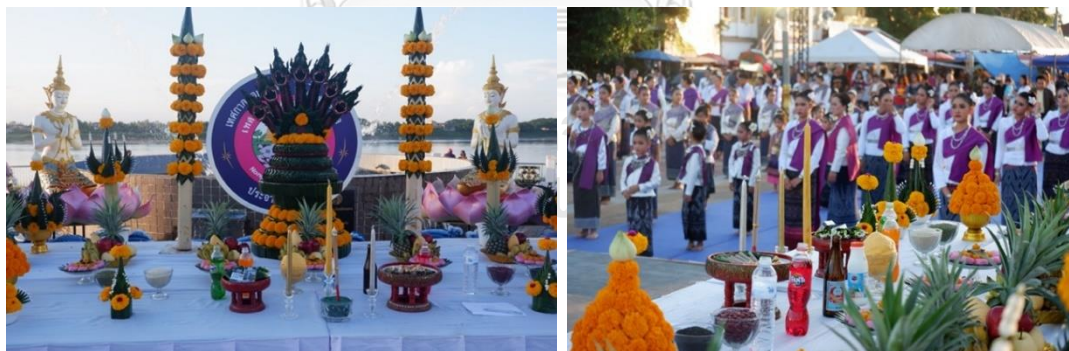
ภาพที่ 12 พิธีบวงสรวงพญานาคที่ลานวัฒนธรรม หน้าวัดลำดวน วันที่ 10 ตุลาคม 2562 งานเทศกาลออกพรรษาและบั้งไฟพญานาคโลก อำเภอเมือง จังหวัดหนองคาย

ส่วนวันที่ 13 ตุลาคม 2562 ซึ่งถือเป็นวันออกพรรษา จะมีพิธีสำคัญในตอนเช้า คือ พิธีบวงสรวงเจ้าแม่สองนาง ณ บริเวณทำน้าวัดหายโศก และพิธีบวงสรวงพระธาตุกลางน้ำ บริเวณทำน้าวัดสิริมหากัจฉายน์ และมีการเคลื่อนขบวนแห่ปราสาทผึ้งไปยังบริเวณหน้าพระธาตุหล้าหนอง นอกจากนี้ในช่วงเช้ายังมีการแข่งขันเรือยาวท้องถิ่นไม่เกิน 55 ฝีพาย การแห่ขบวนปราสาทผึ้งแบบดั้งเดิม ส่วนงานสำคัญในตอนเย็นซึ่งจัดบริเวณลานวัฒนธรรมริมโขงหน้าจากบริเวณใกล้ตลาดท่าเสาตั้งไปถึงหน้าวัดลำดวนและหน้าวัดศรีบุญเรือง วันนี้มีการแสดง แสง สี เสียง เปิดตำนานบั้งไฟพญานาค บริเวณหน้าวัดศรีบุญเรืองเป็นสุดท้าย โดยการแสดงแสง สี เสียง เปิดตำนาน บั้งไฟพญานาคในปีนี้จัดแสดง 4 วัน ระหว่างวันที่ 10-13 ตุลาคม