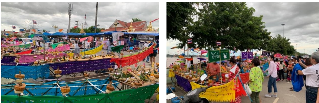
ภาพที่ 22 การจัดแสดงเรือไฟโบราณในเทศกาลออกพรรษาและ งานประเพณีไหลเรือไฟ นครพนม ปี 2563

จากการเก็บข้อมูลภาคสนามของผู้วิจัยในปี 2563 พบว่าลักษณะการจัดกิจกรรม คือ การนำเรือไฟโบราณมาจัดแสดงบริเวณริมน้ำโขงหน้าวัดโพธิ์ศรีใกล้ ๆ กับลานศรีสัตตนาคราช แตกต่างจากสมัยอดีตที่พื้นที่ในการจัดงานจะอยู่ในวัดและไม่ได้เน้นจัดวางเพื่อสนองนักท่องเที่ยว ลักษณะเรือไฟโบราณสร้างจากโครงไม้ไผ่ มีน้ำหนักเบา ความยาวประมาณ 3 เมตร ตกแต่งด้วยธงหลากสี และดอกไม้รูปเทียนต่าง ๆ ส่วนดวงไฟใช้ “ขี้ไต้” หรือภาษาถิ่นอีสานเรียก “ขี้กะบอง” วางไว้รอบเรือและจะจุดไฟก่อนนำไปลอย ความพิเศษของงานคือการจัดเรือ 12 ลำ ตาม “ปีนักษัตร” เรียกว่า “เรือไฟโบราณประจำปีเกิด” ประชาชนสามารถร่วมทำบุญบั้งสุกุลด้วยการถวายเครื่องบูชา ดอกไม้รูปเทียน พานขัน 5 ชั้นหมากเบ็ง รวมทั้งการตัดผม ตัดเล็บ ลงในกระทง เขียนชื่อ-สกุล และนำไปวางไว้ที่เรือไฟประจำปีเกิดของตนเอง เพื่อให้เจ้าหน้าที่นำไปลงไปลอยในวันออกพรรษาในช่วงค่ำของวันออกพรรษา (มักจะลอยก่อนการลอยเรือไฟประยุกต์)