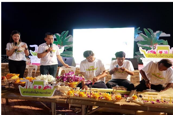
ภาพที่ 21 ประชาชนชาวบ้านกำลังสาธิตการประดิษฐ์กระทงกาบกล้วยในงานเทศกาลออกพรรษา บั้งไฟพญานาคโลก อ.เมือง จ.หนองคาย ปี 2561

(สฤกษ์ดีพงษ์ วิชิตวงษ์, สัมภาษณ์, 12 ตุลาคม 2562) เป็นการรื้อฟื้นการประดิษฐ์กระทงกาบกล้วย และพิธีลอยกระทงกาบกล้วยที่เคยมีในอดีต ตามความเชื่อเรื่องขึ้น 15 ค่ำ เดือน 11 ที่มีการจุดไฟ ถวายเป็นพุทธบูชาและเพื่อบูชาพญานาค