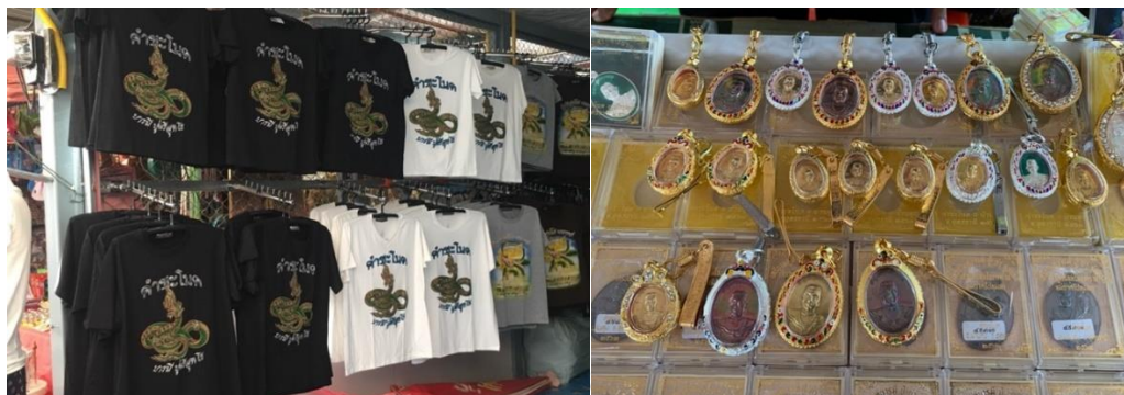
ภาพที่ 19 เสื้อยืดพิมพ์ลายพญานาคและวัดถุมงคลที่คำชะโนด

ศรีสุทโธ และพิมพ์ตัวอักษร คำชะโนด หากอยู่ที่นครพนม จะพิมพ์ลายเป็นรูปองค์พญาศรีสัตตนาคราช 7 เศียร เป็นต้น