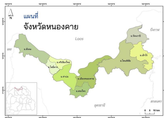
ภาพที่ 4 แผนที่จังหวัดหนองคาย

สภาพภูมิประเทศของจังหวัดหนองคายมีลักษณะทอดยาวตามลำน้ำโขง จังหวัดหนองคายเป็นจังหวัดชายแดนทางภาคตะวันออกเฉียงเหนือตอนบน อยู่ห่างจากกรุงเทพมหานคร โดยเส้นทางรถยนต์ 615 กิโลเมตร และมีอาณาเขตติดกับนครหลวงเวียงจันทน์ ซึ่งเป็นเมืองหลวงของสาธารณรัฐประชาธิปไตยประชาชนลาว โดยมีแม่น้ำโขงเป็นเส้นกั้นเขตแดน จังหวัดหนองคายเป็นจังหวัดชายแดนที่มีเอกลักษณ์พิเศษโดยมีพื้นที่ทอดขนานยาวไปตามลำน้ำโขงมีความยาวทั้งสิ้น 210.60 กิโลเมตร ความกว้างของพื้นที่ทอดขนานไปตามลำน้ำโขงโดยเฉลี่ยประมาณ 20- 25 กิโลเมตร ช่วงที่กว้างที่สุดอยู่ที่อำเภอเฝ้าไร่ และช่วงที่แคบที่สุดอยู่ที่อำเภอท่าบ่อ จังหวัดหนองคายมีอำเภอที่อยู่ติดกับลำน้ำโขง 6 อำเภอ คือ อำเภอสังคม อำเภอท่าบ่อ อำเภอศรีเชียงใหม่ อำเภอเมือง อำเภอโพนพิสัยและอำเภอรัตนาวาปี และมีอาณาเขตติดต่อกับสาธารณรัฐประชาธิปไตยประชาชนลาว (สปป.ลาว) คือ แขวงเวียงจันทน์ นครหลวงเวียงจันทน์ และแขวงบอลิคำไซ