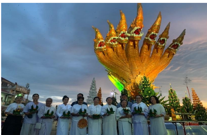
ภาพที่ 17 ตัวแทนชุมชนในเทศบาลตำบลโพธิ์พิสัยตั้งแถวก่อนทำพิธีไหลกองฮ่า หน้าบริเวณประติมากรรมพญาพิสัยสัตนาคราช

วันทามิ เทยยารามะติตเถ สุปะติภูฐิตัง อิมัง สัตตะนาคะราชัง ตัสสานุภาเวนะ สิทธิกิจจัง สิทธิกัมมัง สิทธิลาโภ ชะโยนิจจัง โสตถิ เม โทตุ สัพพะทา คำแปล ข้าพเจ้าขอกราบไหว้พญานาค 7 เศียรนี้ ที่ประดิษฐานไว้ดีแล้ว ณ ท่าน้ำวัดไทย ด้วยอานุภาพแห่งการกราบไหว้บูชาพญานาค 7 เศียรนั้น กิจที่มุ่งหวัง โชคลาภที่มุ่งหวัง ความชนะเป็นนิรันดร์ และความสุขสวัสดิ์ จงมีแก่ข้าพเจ้าตลอดกาล