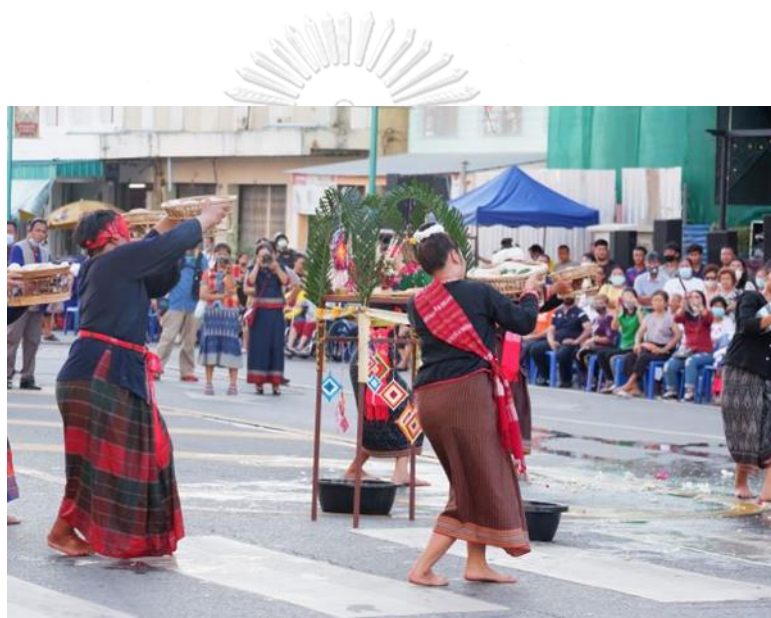
ภาพที่ 23 การแสดงศิลปวัฒนธรรม “พิธีเหยา” ของอำเภอนาแก ในงานบวงสรวงพญาศรีสัตตนาคราช ปี 2563 ที่จังหวัดนครพนม