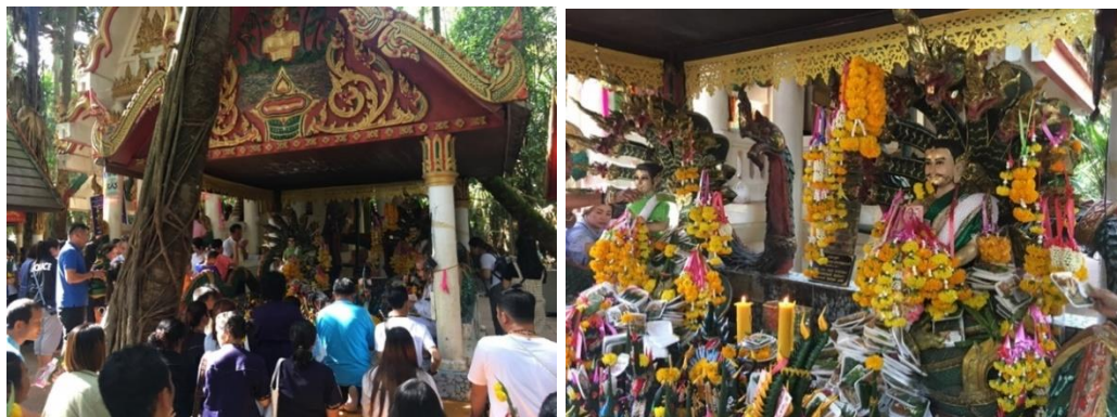
ภาพที่ 16 ศาลเจ้าปู่ศรีสุทโธและเจ้าย่าศรีปทุมมา ภายในป่าคำชะโนด

จุดแรก คือ ศาลเจ้าปู่ศรีสุทโธและเจ้าย่าศรีปทุมมา มีจำนวนสามศาลติดกันศาลศาลด้านซ้ายจะมีเจ้าปู่ศรีสุทโธประดิษฐานอยู่องค์เดียวและประติมากรรมพญานาค ศาลที่อยู่ตรงกลางเป็นศาลที่มีรูปเคารพร่างมนุษย์ของพ่อปู่ศรีสุทโธและแม่ย่าศรีปทุมมา ส่วนศาลทางด้านขวาเป็นรูปเคารพของปู่เจ้าศรีสุทโธและเจ้าย่าศรีปทุมมาครั้งนาคครั้งมนุษย์