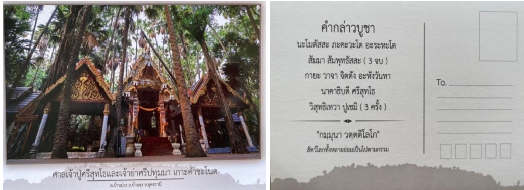
ภาพที่ 20 โปสการ์ดที่ระลึกคำชะโนด

ส่วนที่คำชะโนดนั้นมีศูนย์อำนวยการคำชะโนดซึ่งเป็นหน่วยงานที่เกิดขึ้นใหม่เพื่อรองรับการเติบโตและการพัฒนาพื้นที่คำชะโนดในช่วยปี 2558 นอกจากนี้จะมีหน้าที่บริหารจัดการดูแลเกาะคำชะโนดแล้ว การสร้างผลิตภัณฑ์ต่าง ๆ ที่เกี่ยวกับพ่อบุแม่ย่าก็อยู่ในความดูแลของศูนย์นี้ เช่น การจัดสร้างวัดถมุงคลเหริยบพ่อบุแม่ย่า รุ่นแรก เป็นต้น นอกจากสร้างวัดถมุงคลแล้ว จากข้อมูลภาคสนามในปี 2562- 2563 ยังพบว่ามี การสร้างโปสการ์ดจำหน่าย ราคาใบละ 10 บาท โดยภาพในโปสการ์ดนั้นจะเป็นรูปภาพที่แสดงความเป็นเกาะคำชะโนด เช่น ภาพศาลเจ้าปู่ศรีสุทโธและแม่ย่าศรีปทุมมา ภาพบ่อน้ำศักดิ์สิทธิ์ ภาพต้นชะโนด ภาพสะพานพญานาค เป็นต้น ข้างหลังภาพจะมีการพิมพ์คำกล่าวบูชาพญาศรีสุทโธไว้ด้วย ส่วนที่จังหวัดหนองคายนั้น ในพื้นที่เขตอำเภอเมืองพบการขายสินค้าและผลิตภัณฑ์เกี่ยวกับพญานาคในบริเวณตลาดท่าสเด็จ ซึ่งตั้งอยู่ริมฝั่งโขงมีการจำหน่ายสินค้าพื้นเมือง เช่น ผ้าทอลายพญานาค กระเป๋า ลายพญานาค หรือเสื้อยืดพิมพ์ลายพญานาค เป็นต้น และกลุ่มผู้จัดแสดงแสง สี เสียง เปิดตำนานบั้งไฟพญานาค ได้จัดทำเสื้อยืดพิมพ์พญานาคพร้อมทั้งซื้อการแสดงมวาทจำหน่ายบริเวณหน้าอ้อมจันทร์สำหรับผู้ชม