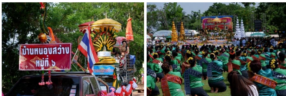
ภาพที่ 7 ขบวนแห่และการรำวงสรวงเจ้าปู่ศรีสุทโธ เจ้าย่าศรีปทุมมา พ.ศ. 2562

จากการสังเกตของผู้วิจัยพบว่าระหว่างการประชุมปรึกษาหารือกับชาวบ้าน นักท่องเที่ยว และสื่อมวลชนเป็นจำนวนมาก บรรยากาศของการบวงสรวงนั้นเป็นไปด้วยความสำรวม ประชาชนที่เข้าร่วมมีทั้งนั่งและยืน เมื่อเสร็จสิ้นพิธีการบวงสรวงแล้ว ก่อนจะเริ่มการรำบวงสรวง ประชาชนบางส่วนรวมทั้งสื่อมวลชนได้ลุกมาที่บริเวณหน้าปะรำพิธีซึ่งมีชั้นน้ำมนต์ตั้งอยู่ต่างพากันรุมเพ่งมองและยื้อแย่งกันถ่ายรูปรูปหยดเทียนที่ลอยอยู่เหนือ ฝิวน้ำมนต์เพื่อนำไปตีความเป็นเลขมงคลและนำไปซื้อหอยและสลากกินแบ่งรัฐบาลเพื่อลุ้นโชคต่อไป บรรยากาศรอบบริเวณลานบวงสรวงในช่วงนี้จึงเต็มไปด้วยเสียงพูดคุยเฝ้าถามว่าเลขมงคลที่อยู่ในชั้นน้ำมนต์คืออะไร หลังจากนั้นพิธีกรได้กล่าวให้ทุกคนอยู่ในความสงบเพราะจะเป็นการรำบวงสรวงถวายเจ้าปู่ศรีสุทโธจากนางรำ 999 คน แบ่งเป็นตัวแทนจาก 14 หมู่บ้าน 560 คน และผู้มีจิตศรัทธาอื่น ๆ อีก 439 คน การรำนี้ใช้เวลาประมาณ 20 นาที โดยใช้ลายเพลงบูชาปู่ศรีสุทโธ ในช่วงท้ายที่เป็นจังหวะซึ่งสนุกสนานนั้นประชาชนรอบ ๆ บริเวณพิธีสามารถเข้ามาร่วมรำกับคณะนางรำได้ โดยระหว่างนี้มีการจุดธูปไฟถวายปู่ศรีสุทโธและย่าศรีปทุมมาไปด้วย