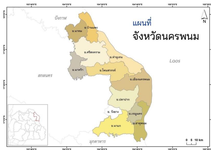
ภาพที่ 5 แผนที่จังหวัดนครพนม