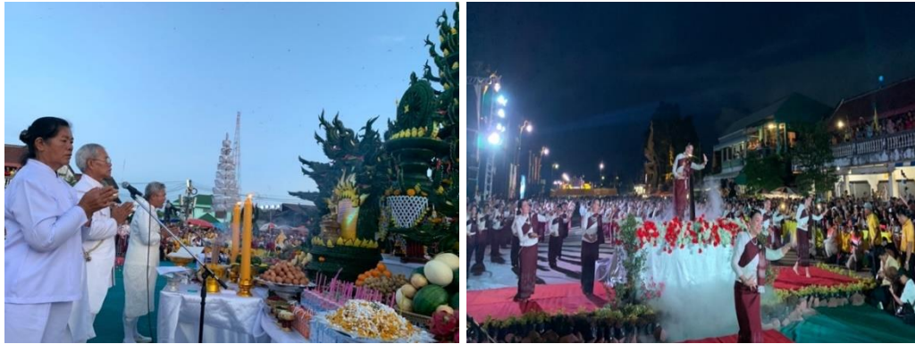
ภาพที่ 15 งานเทศกาลออกพรรษาบั้งไฟพญานาคโลก ปี 2562 อำเภอโพธิ์ชัย

ช่าย: พิธีบวงสรวงพญานาคและพญาพิสัยสัตนาคราช