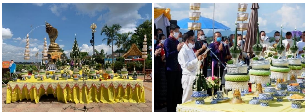
ภาพที่ 9 พิธีบวงสรวงพญาศรีสัตตนาคราช พ.ศ. 2563

กิจกรรมในภาคเช้าที่เคยมีมาตั้งแต่ปี พ.ศ. 2560-2562 คือ กิจกรรมไว้พระธาตุประจำวันเกิด ได้ถูกตัดออกไป เหลือเพียงกิจกรรมในช่วงเย็นพิธีบวงสรวงพญาศรีสัตตนาคราชและการรำบูชาที่ลด นางรำลง โดยในปีนี้งานเริ่มในวันที่ 7 ตามเดิม มีนางรำ 500 คน บริเวณถนนนิตโย ส่วนวันที่เหลือลดนางรำเหลือวันละ 100 คน รำบวงสรวงที่ลานสามมิติข้างองค์พญาศรีสัตตนาคราช และนอกจากกิจกรรมภาคเช้าจะงดแล้ว กิจกรรมในช่วงเย็นยังคงเหลือแค่พิธีสงฆ์และพิธีบวงสรวงทางพราหมณ์ การแสดงมหรสพ โรงทาน หรืองานรื่นเริงต่าง ๆ งดการจัดกิจกรรม และการเข้าร่วมงานของประชาชนหรือนักท่องเที่ยวที่วนั้นจะต้องปฏิบัติตามมาตรการควบคุมป้องกันการแพร่ระบาดของโรคโควิด-19 เช่น การวัดอุณหภูมิก่อนเข้างาน การสวมหน้ากากอนามัย เป็นต้น และเมื่อเข้าร่วมพิธีจะต้องมีการเว้นระยะห่างกัน โดยทางเทศบาลเมืองนครพนมได้จัดหน่วยบริการไว้โดยเฉพาะ