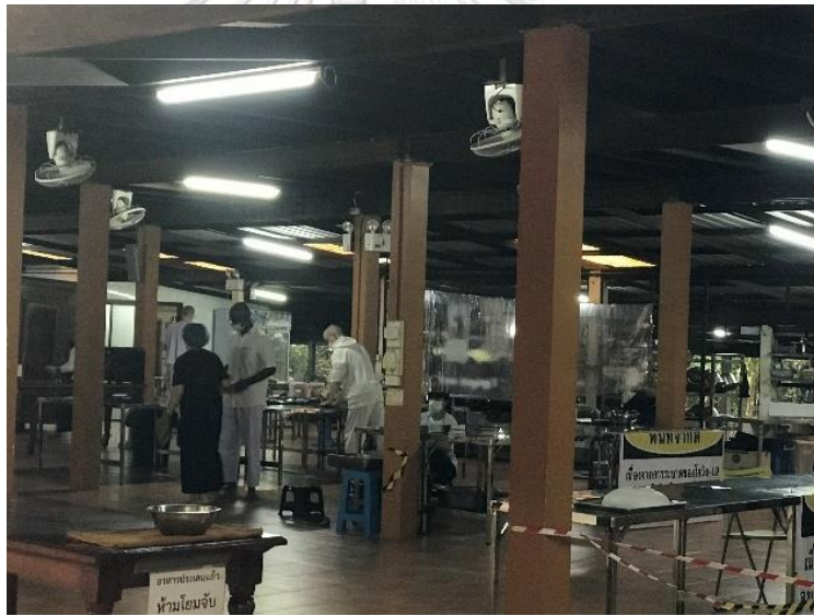
ภาพที่ 4 อุบาสกบางส่วนช่วยแม่ออกจัดเตรียมภายในครัว