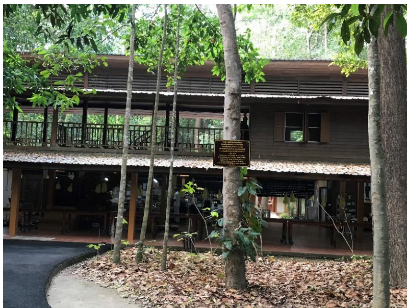
ภาพที่ 1 ด้านข้างเรือนพักรวมของอุบาสกในวัดป่านานาชาติ