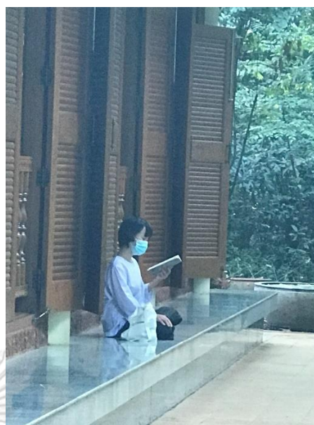
ภาพที่ 12 อุบาสิกาชาวไทยในวัดป่านานาชาติ