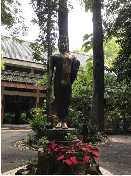
ภาพที่ 8 พระพุทธรูปหน้าศาลาฐิตธมโม