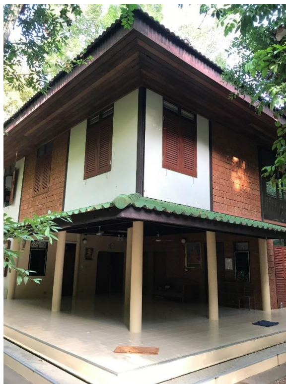
ภาพที่ 23 อาคารห้องสมุดและที่ประชุม