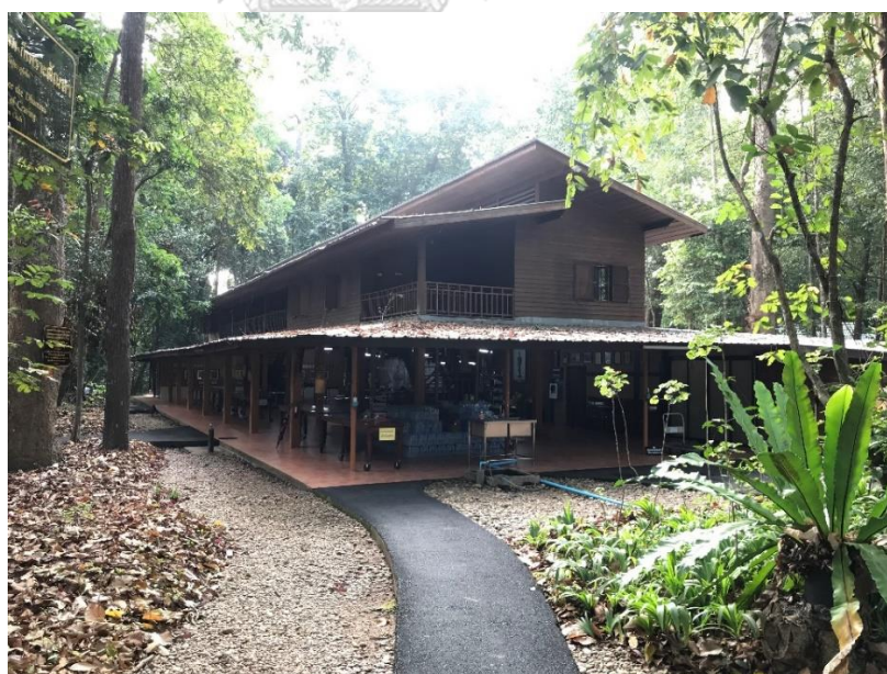
ภาพที่ 2 เรือนพักรวมของอุบาสกในวัดป่านานาชาติ

เรือนพักรวมของอุบาสกมี 2 ชั้น ชั้นแรกมีโรงครัว และที่พักอุบาสิกา ส่วนชั้นที่ 2 มีห้องพักร่วมของอุบาสก และลานนอกห้อง