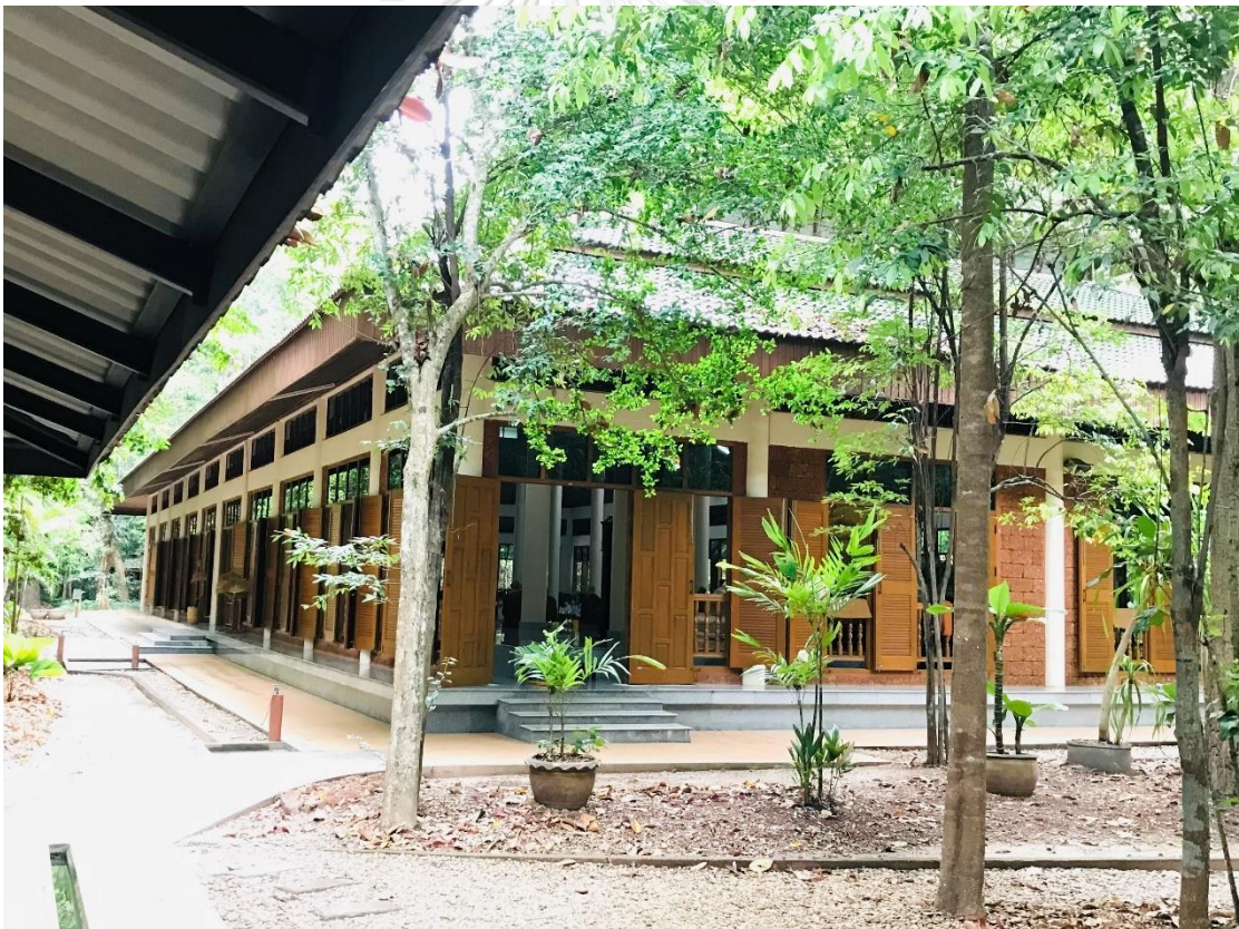
ภาพที่ 10 ด้านหลัง และด้านข้างศาลาฐิตธมโม ที่ติดกับศาลาประชุม ศาลาฉันทน์น้ำปานะ และกุฏิของพระภิกษุ