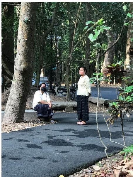
ภาพที่ 11 แม่ออกในหมู่บ้านมาเตรียมถวายของ