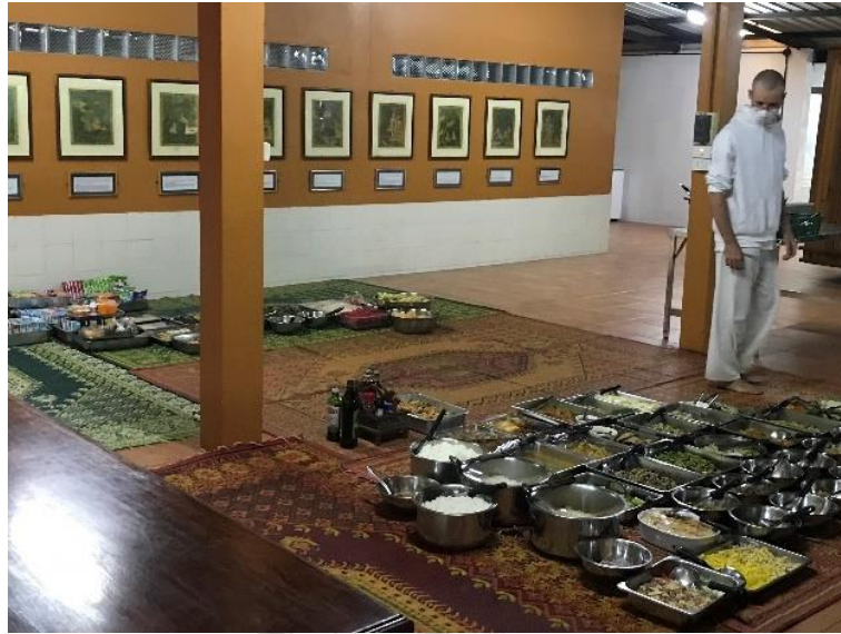
ภาพที่ 3 อุบาสกชาวต่างชาติกำลังช่วยจัดสถานที่เตรียมพระเคน