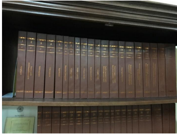
ภาพที่ 25 พระไตรปิฎกฉบับภาษาอังกฤษในห้องสมุด