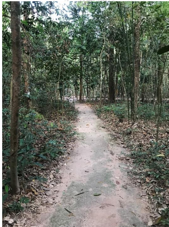
ภาพที่ 28 ทางเดินไปกุฏิในวัดป่านานาชาติ