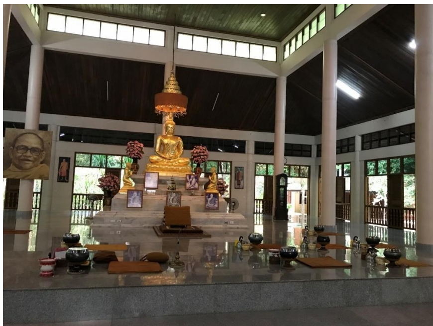
ภาพที่ 15 พระประธานในศาลาจิตตมโม และอาสนะสงฆ์ที่มีการจัดเรียงบริวารเตรียมฉัน

บางวัดอาจเรียงด้านซ้ายของผู้นั่ง การวางด้านซ้ายหรือด้านขวา เป็นสิ่งที่พระภิกษุ สามเณรในวัดป่า ต้องสังเกต จึงวางได้ถูกต้องตามธรรมเนียมแต่ละวัด สามารถใช้อุปกรณ์ของตนเองได้ถูกต้อง