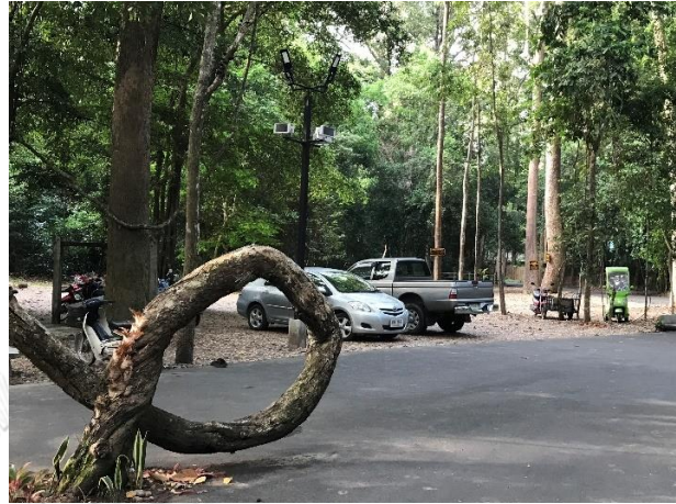
ภาพที่ 9 ลานจอดรถหน้าศาลาฐิตธมโม