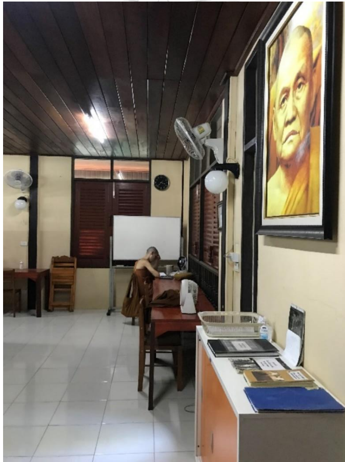
ภาพที่ 26 สามเณรชาวต่างชาติกำลังศึกษาริณัย