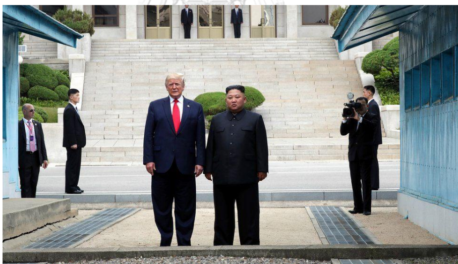
ภาพที่ 3 ประธานาธิบดีโดนัลด์ ทรัมป์ ผู้นำสหรัฐฯ คนแรกที่ข้ามไปยังฝั่งเกาหลีเหนือ

วันที่ 30 มิถุนายน 2019 ผู้นำสหรัฐฯ และผู้นำเกาหลีเหนือก็ได้พบกันเป็นครั้งที่ 3 ที่เขตปลอดทหารซึ่งเป็นเขตกันชนระหว่างเกาหลีเหนือและเกาหลีใต้ การพบกันครั้งนี้ถือเป็นภาพประวัติศาสตร์และเป็นเหตุการณ์สำคัญในเชิงสัญลักษณ์ เนื่องจากทรัมป์เป็นผู้นำสหรัฐฯ คนแรกที่ก้าวข้ามเส้นเขตแดนจากเกาหลีใต้ไปยังฝั่งเกาหลีเหนือ (ภาพที่ 3) ทั้งสองฝ่ายจับมือและกล่าวทักทายกันด้วยท่าทีที่ผ่อนคลาย “ดีใจที่ได้พบกันอีกครั้ง ผมไม่คิดว่าจะเจอคุณที่นี่” ผู้นำคิม จอห์นกล่าว “เป็นช่วงเวลาที่สำคัญมาก” ทรัมป์กล่าว หลังจากนั้นผู้นำเกาหลีเหนือก็ข้ามมายังฝั่งเกาหลีใต้และกล่าวว่า “นี่คือการแสดงความตั้งใจของผู้นำสหรัฐฯ ในการทำลายอดีตที่เลวร้ายเพื่อไปสู่อนาคตใหม่” จากนั้นทั้งสองฝ่ายได้หารือกันที่บ้านแห่งเสรีภาพ โดยมีผู้นำเกาหลีใต้เข้าร่วมด้วย ซึ่งเป็นครั้งแรกในประวัติศาสตร์ที่ผู้นำทั้ง 3 ประเทศพูดคุยร่วมกัน ผลการหารือ สหรัฐฯ และเกาหลีเหนือตกลงที่จะเจรจาเรื่องโครงการนิวเคลียร์เกาหลีเหนือที่หยุดชะงักไปหลังจากการประชุมครั้งที่ 2 45