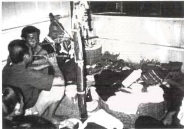
รูปที่ 24, 25 พิธีเสนตั้งบั้ง