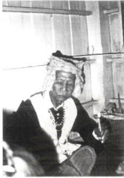
รูปที่ 23 หมอธรรม (ชั้นผู้น้อย) ประจำบ้านแม่ประจันต์ ขณะประกอบพิธีเสนตั้งบั้ง