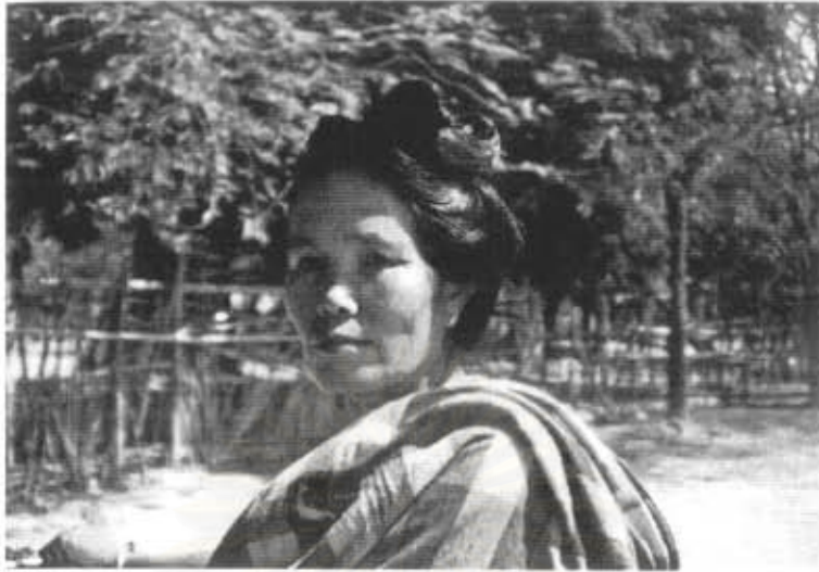
รูปที่ 20, 21, 22 แบบทรงผมและเครื่องแต่งกายของหญิงไทดำ บ้านแม่ประจันต์