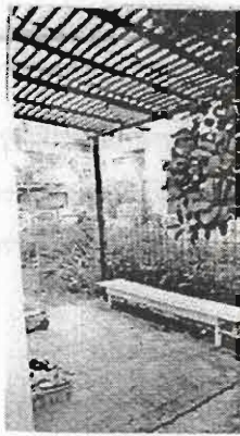
ภาพที่ 3 บริเวณเฉลียงที่เชื่อมต่อการปรับเปลี่ยนเป็นห้องนอนพ่อแม่ ในอนาคต

มิตีที่ซ่อนอยู่เพื่อรองรับการปรับเปลี่ยนและต่อเติม เป็นมิตีที่เกิดขึ้นเพื่อรองรับความซับซ้อนของชีวิตสมาชิกภายในบ้านที่เปลี่ยนแปลงไปตามกาลเวลา อาทิ ความต้องการ จำนวน วย เป็นต้น ซึ่งเป็นผลให้ในพื้นที่หนึ่งทีรองรับกิจกรรมหนึ่งในช่วงเวลาหนึ่ง แต่เมื่อ วัน เดือน ปี ผ่านไป สเปซและองค์ประกอบทางสถาปัตยกรรมในบริเวณนั้นก็ยังสามารถปรับเปลี่ยน และต่อเติมเพื่อสนองต่อกิจกรรมที่เกิดขึ้นใหม่ หรือสนองกิจกรรมเดิมแต่ต้องการพื้นที่มากขึ้น หรือต้องการให้มีบรรยากาศที่แตกต่างไปจากเดิมโดยไม่จำเป็นต้องทุบหรือรื้อถอนให้สิ้นเปลืองทั้งเวลาและค่าใช้จ่ายมากมาย แต่มันกลับมี 'ลม' หรือ 'ร่องรอย' ที่รองรับการเปลี่ยนแปลงต่างๆ ที่จะมีขึ้นในอนาคตซ่อนอยู่ ตัวอย่างเช่น บริเวณเฉลียงข้างบ้านชั้นล่างซึ่งต่อไปในอนาคตจะเปลี่ยนเป็นห้องนอนสำหรับพ่อแม่ยามแก่เฒ่า (เดินขึ้นไปชั้น 2 ไม่นาน) ดังนั้นลักษณะเฉลียงที่ถูกต้องเติมขึ้นมาก่อนหน้านี้จึงมีรูปแบบสถาปัตยกรรมที่ง่าย ๆ ราคาไม่แพง สะดวกต่อการรื้อถอน หรืออีกตัวอย่างหนึ่งเช่น การต่อเติมลานนั่งเล่นไม้บริเวณหลังบ้านที่ลงบนลานชักร้างที่มีอยู่เดิมทั้งหมด แต่เมื่อถึงเวลาที่จะชักร้าง บนพื้นชานไม้นั้นก็มียะรอยของพื้นไม้ที่สามารถยกเปิดได้บางส่วนเพื่อสามารถไ้พื้นที่ชักร้างบางส่วนที่อยู่ข้างใต้ได้ เป็นต้น