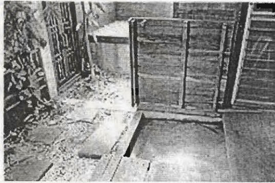
ภาพที่ 4 ช่องพื้นชานไม้ที่สามารถเปิดลงไปใช้ลานชักร้างข้างใต้

การศึกษามิตีที่ซ่อนอยู่ทั้งในรูปมิตีซ้อนทับของประโยชน์ใช้สอย มิตีที่ซ่อนอยู่เพื่อรองรับโลกของบุคคลรวมทั้งมิตีที่ซ่อนอยู่เพื่อรองรับการปรับเปลี่ยนและต่อเติม ที่ได้กล่าวมาแล้วข้างต้น จะเป็นอุทาหรณ์ให้กับสถาปนิก นักศึกษสถาปัตยกรรม และผู้ที่เกี่ยวข้อง ได้หันมาถามตัวเองว่าเราได้ลิ้มหรือมองข้ามมิตีเหล่านี้ไปหรือไม่ เราจะสามารถสร้างสถาปัตยกรรม โดยเฉพาะบ้านพักอาศัยที่มีพื้นที่และงบประมาณที่จำกัดให้รองรับกับความซับซ้อนในการอาศัยอยู่ของมนุษย์ได้อย่างไร สเปซบริเวณใดลักษณะของสเปซและองค์ประกอบของสถาปัตยกรรมของทิวทัศน์หรือสิ่งใดที่มีศักยภาพพอที่จะรองรับความซับซ้อนเหล่านี้ได้ ซึ่งต่อไปทิวทัศน์หรือสิ่งใดจะถูกออกแบบเพื่อเอื้อให้เกิดโลกส่วนตัวของสมาชิกแต่ละคนแทรก ซ่อนอยู่ในส่วนต่างๆ ของสถาปัตยกรรม หรืออาจถูกออกแบบให้ทั้งร่องรอยบางอย่าง เช่น เคา์ผ้าเพดานได้หลังคามบางส่วนอาจมีขนาดหรือลักษณะที่สามารถรองรับ 'ชั้นลอย' ที่จะมีขึ้นในอนาคตได้ หรือนั่งบางส่วนอาจไม่ได้หนาเพียง 10 ซม.แต่มีความหนาเพื่อเอาไว้ทำประโยชน์อย่างอื่น เป็นต้น จนบ้านสำเร็จรูปที่มีพื้นที่จำกัดอย่าง "ทิวทัศน์" กลายเป็นสถาปัตยกรรมที่มีคุณภาพของสเปซที่ยิ่งใหญ่ที่เอื้อและรองรับความซับซ้อนของชีวิตจนเป็นที่อาศัยอยู่ หรือถิ่น (Place) ของผู้เป็นเจ้าของอย่างแท้จริง