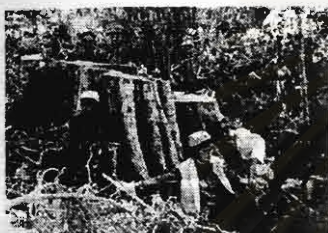
กลุ่มผู้คัดค้านเข้าสำรวจป่า