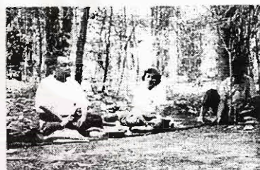
ส.ศิริวัชรเข้าร่วมปิดป่า

การทำงานของกลุ่มอนุรักษ์กาญจน์ทุกครั้งหวังพึ่งพาสื่อมวลชนมาก เพราะเห็นว่างานเคลื่อนไหวต่างๆ จะสำเร็จหรือไม่ขึ้นอยู่กับสื่อมวลชน