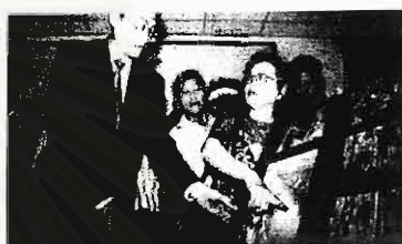
เข้ายื่นหนังสือให้บุคคลสำคัญ