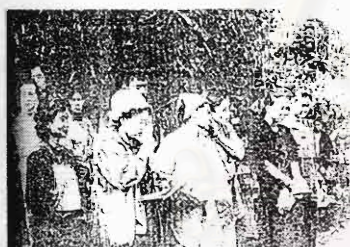
ชวงปิดป่า