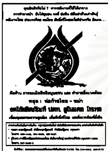
รูปภาพที่ 7.2 แผ่นพับ แผ่นปลิวของกลุ่มผู้คัดค้าน

แผ่นปลิว/แผ่นพับของกลุ่มผู้คัดค้านที่ออกมานั้นส่วนใหญ่จะมีการออกแบบในลักษณะง่าย ๆ ไม่คำนึงความสวยงามมากนัก แต่เน้นการสื่อสารอย่างตรงไปตรงมา เช่น แผ่นปลิวรณรงค์ใช้ผลิตภัณฑ์ ปตท. ยูโนแคล โทเทิล แผ่นปลิวแถลงการณ์ต่อต้านการกระทำของ ปตท. เป็นต้น ซึ่งส่วนใหญ่จะเป็นลักษณะการเรียงความและใช้การเน้นข้อความมากกว่าสื่อด้วยภาพ