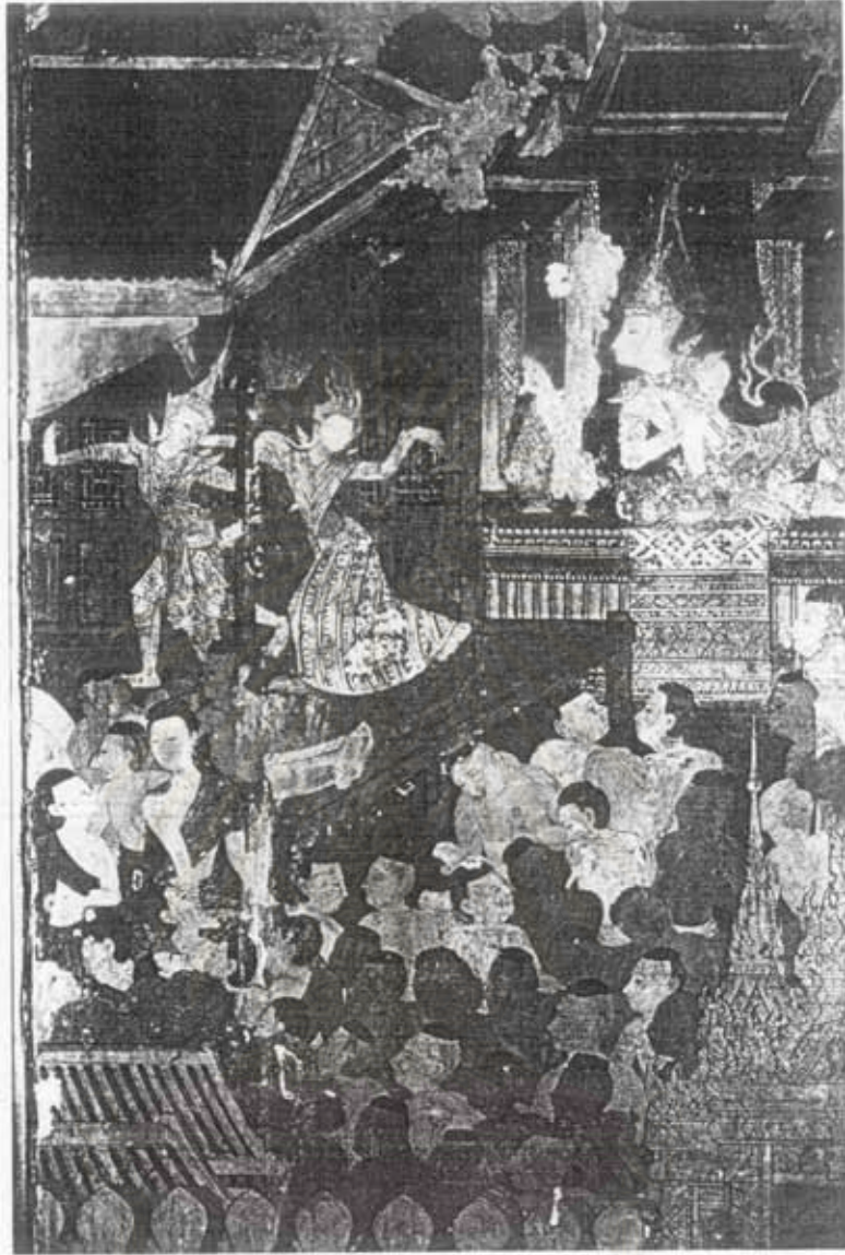
ภาพที่ 49 นางอุทิศปีโนภาพประวัติพระปิตุเจกพุทธเจ้า

จิตรกรรมฝาผนังภายในพระอุโบสถวัดสุทัศนเทพวรารามราชวรมหาวิหาร เขตพระนคร กรุงเทพมหานคร