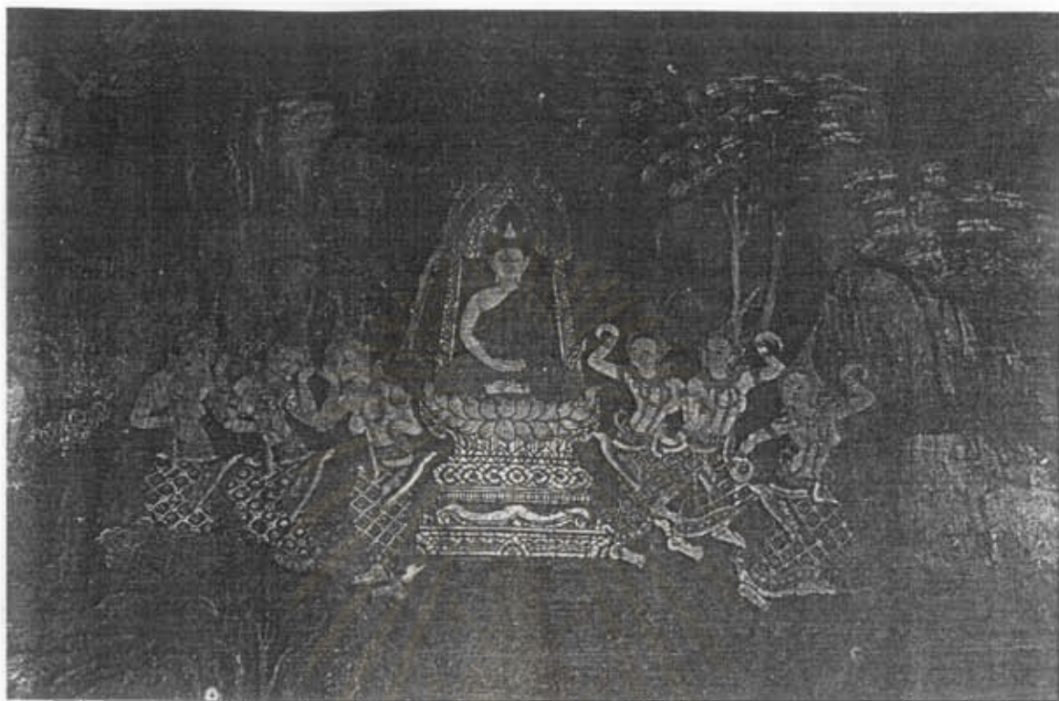
ภาพที่ 57 ลีลาพระยามารสร้างรำอ้าววนพระพุทธองค์ จิตรกรรมฝาผนังภายในพระอุโบสถวัดบางขุนเทียนใน เขตบางขุนเทียน กรุงเทพมหานคร