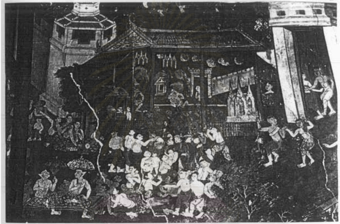
สถาบันวิทยบริการ จุฬาลงกรณ์มหาวิทยาลัย ภาพที่ 48 โขนมั่งราว ในอนุพุทธประวัติ (ชีวประวัติพระสาวกพระพุทธเจ้าสมัยพุทธกาล) จิตรกรรมฝาผนังภายในพระอุโบสถวัดพระเชตุพนวิมลมังคลาราม เขตพระนคร กรุงเทพมหานคร