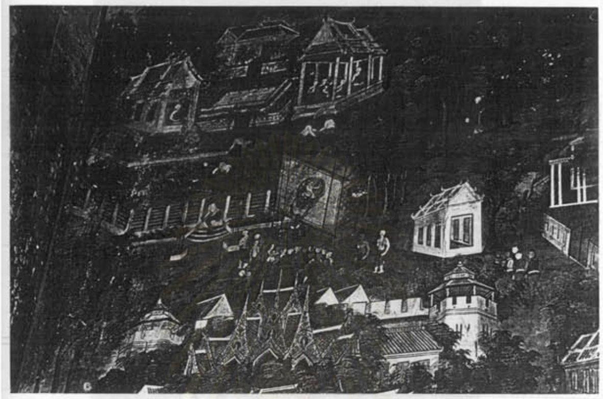
ภาพที่ 52 การแสดงหนังใหญ่ ในประวัติพระอัครสาวก 11 องค์ ภาพจิตรกรรมฝาผนังภายในพระอุโบสถวัดมกุฏกษัตริยารามราชวรวิหาร เขตพระนคร กรุงเทพมหานคร