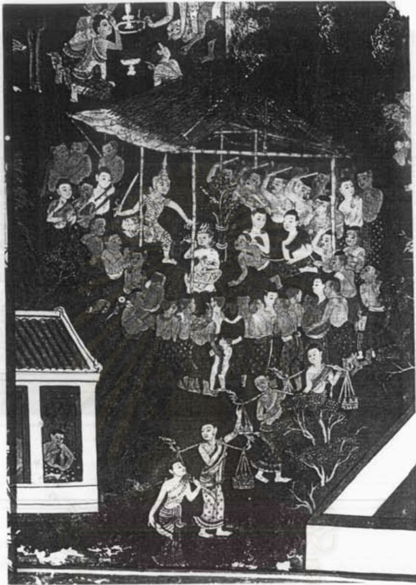
ภาพที่ 50 ละครชากรี หรือละครนอก

จิตรกรรมฝาผนังภายในหอพระไตรปิฎก วัดบวรนิเวศวิหารราชวรวิหาร เขตพระนคร กรุงเทพมหานคร