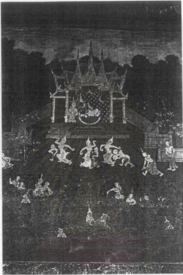
ภาพที่ 56 บรรดาชาวสวรรค์กำลังเริงระบำ ในเวสสันดรชาดก กำแพงเทพพร

จิตรกรรมฝาผนังภายในวัดทองนพคุณ เขตคลองสาน กรุงเทพมหานคร