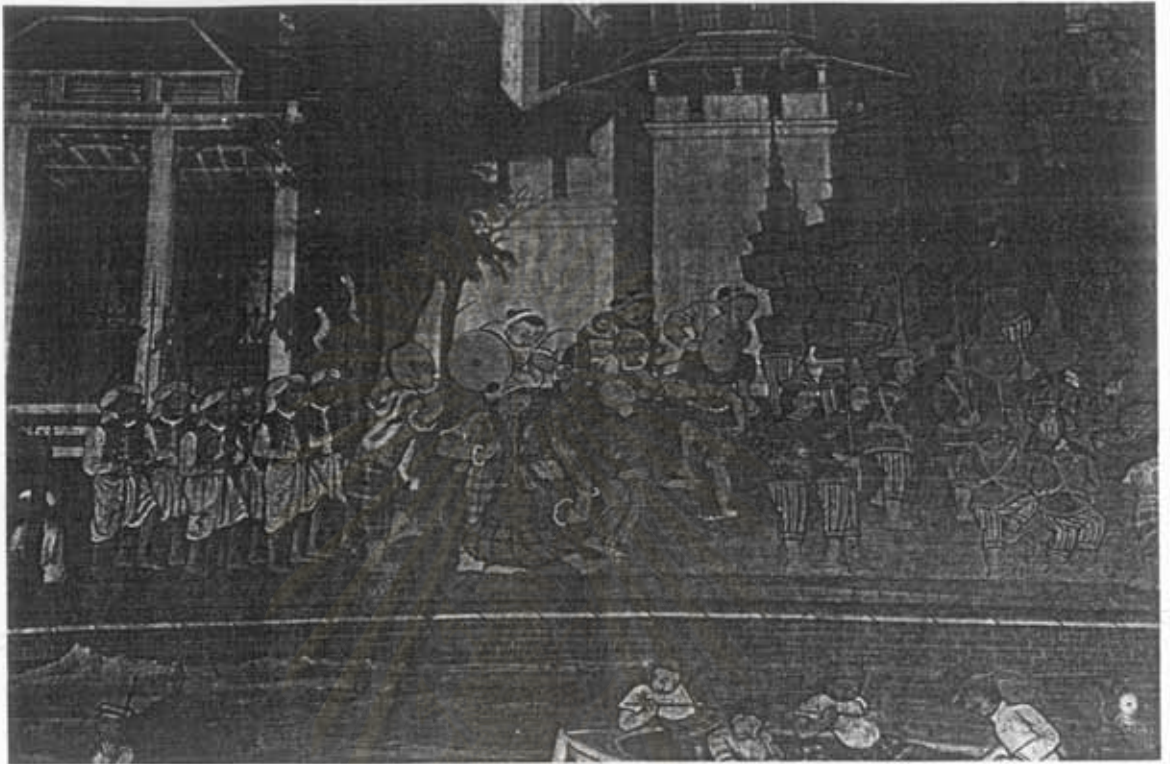
ภาพที่ 55 ขบวนนาฏยศิลป์และดุริยางคศิลป์ ตอน พระเจ้าอโศกมหาราชทรงคอนกั๋งพระศรีมหาโพธิ์พระราชทานแก่พระเจ้ากรุง อนุราชปุระ จิตรกรรมฝาผนังภายในพระอุโบสถ วัดโพธิ์นิมิตร เขตธนบุรี กรุงเทพมหานคร