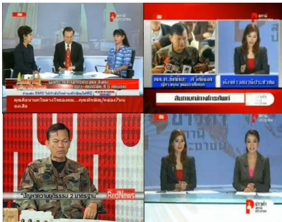
ภาพการนำเสนอรายการปกติของทางสถานีประชาชน ( http://newedition.org/video,2553 : ออนไลน์)