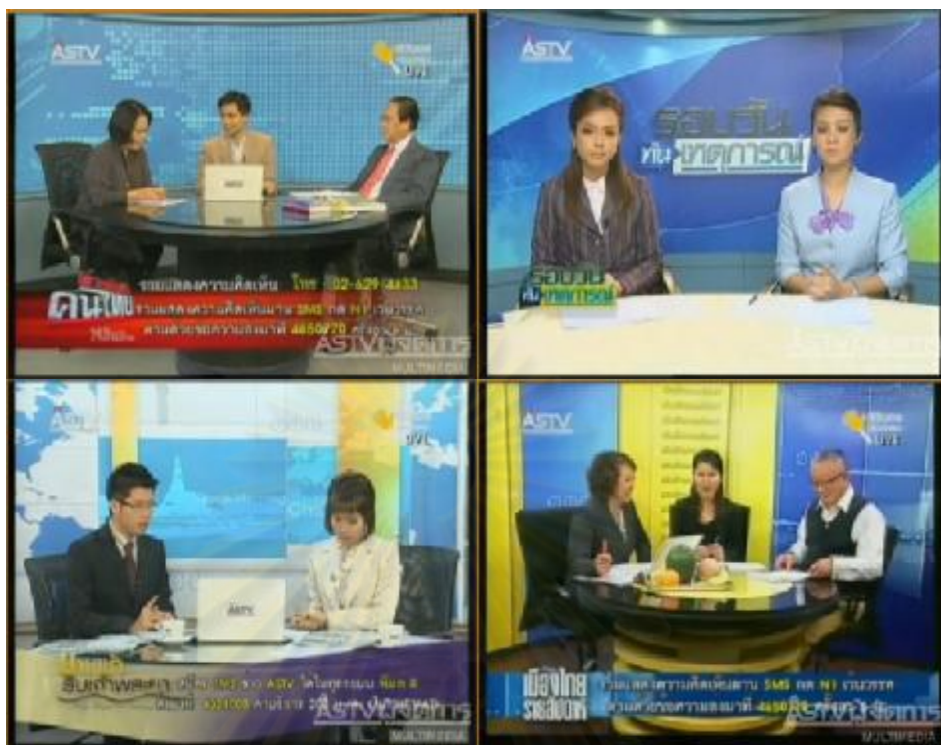
ภาพการนำเสนอรายการปกติของทางสถานีโทรทัศน์เอเอสทีวี ( http://www.manager.co.th/vdo/multi.swf , 2553 : ออนไลน์)