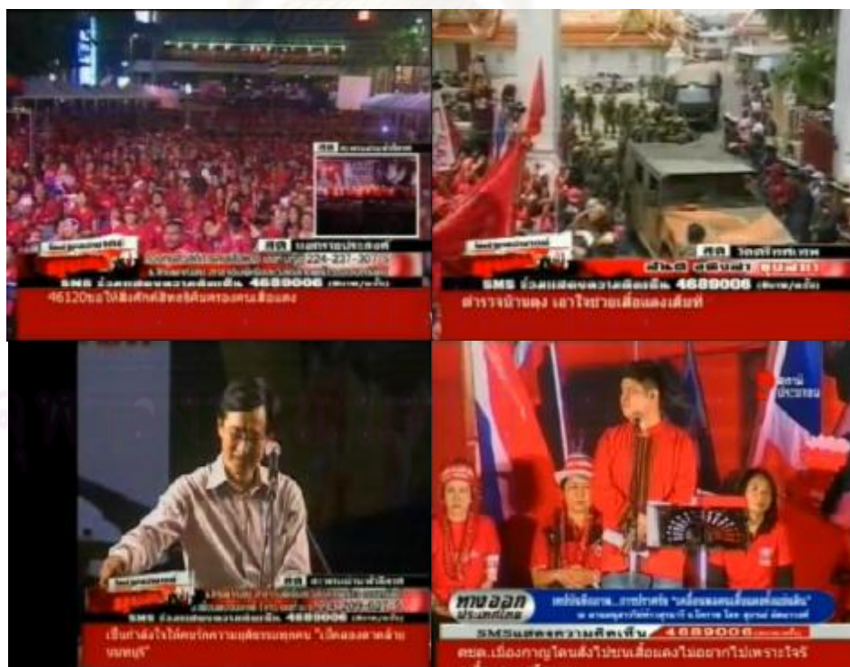
ภาพการถ่ายทอดสดขณะมีการชุมนุมทางการเมือง ( http://newedition.org/video,2553 : ออนไลน์)