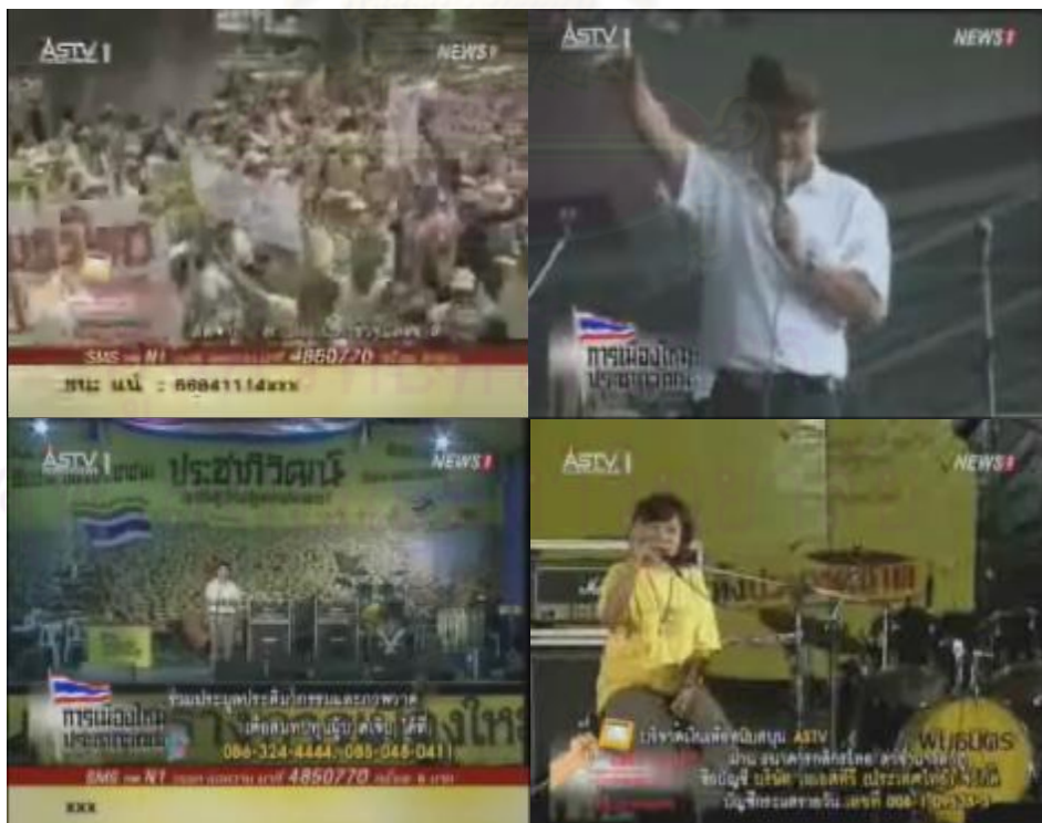
ภาพการถ่ายทอดสดขณะมีการชุมนุมทางการเมืองของสถานีโทรทัศน์เอเอสทีวี ( http://www.uthaisak.net , 2553 : ออนไลน์)