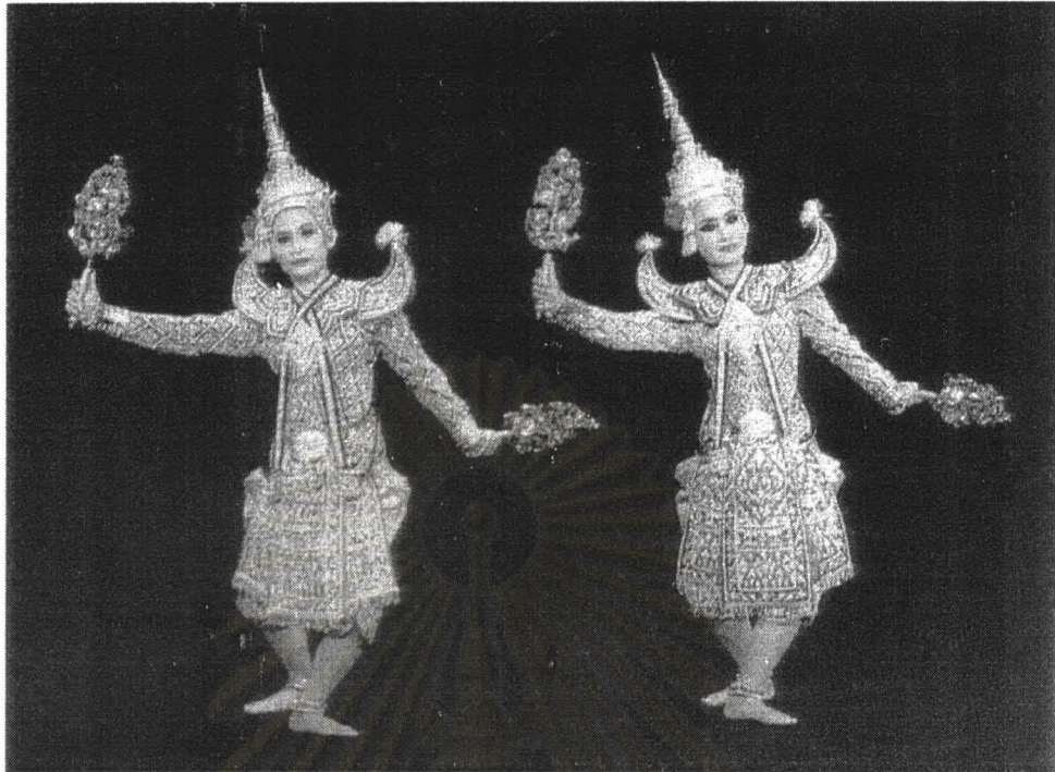
ภาพที่ 2 รำดอกไม้เงินทอง