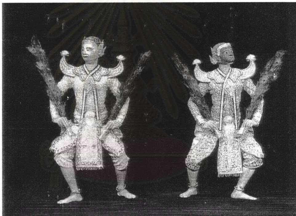
ภาพที่ 1 รำประเลง

1) รำประเลง การแสดงชุดนี้ถือว่าเป็นการแสดงเบิกโรงที่เก่าแก่ชุดหนึ่ง ซึ่งมีมาตั้งแต่สมัยโบราณ อารดา สุมิตร กล่าวถึงการรำประเลงว่า รำเบิกโรงชุดนี้คงจะใช้มาตั้งแต่สมัยอยุธยา จนกระทั่งถึงสมัยพระบาทสมเด็จพระจอมเกล้าเจ้าอยู่หัว จึงได้ทรงดัดแปลงเสียใหม่เป็นรำดอกไม้เงินทอง 32