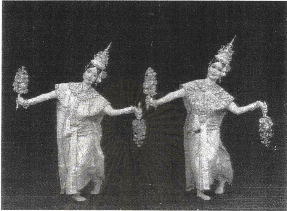
ภาพที่ 3 รำชุยฉายกิ่งไม้เงินทอง