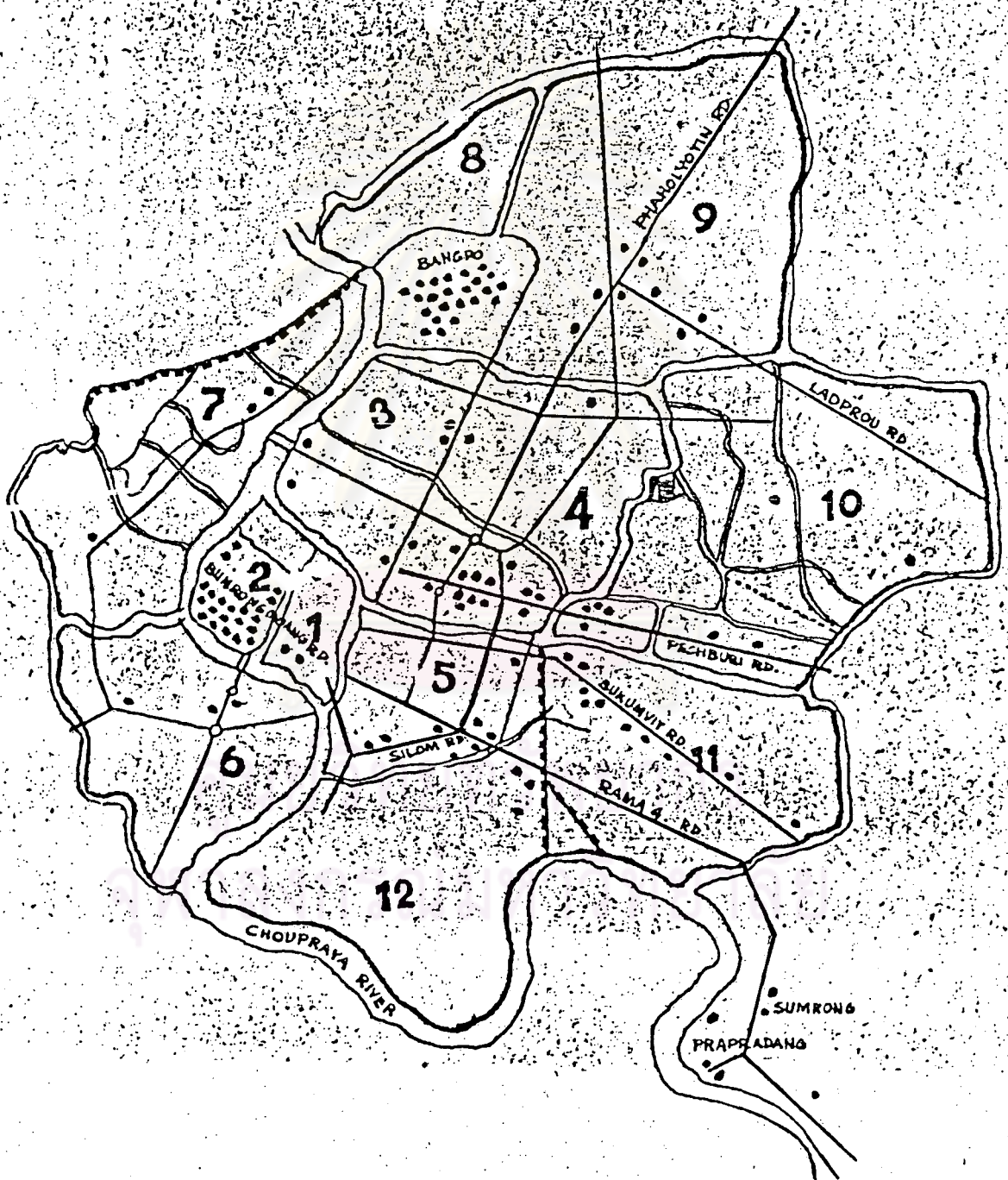
แผนผัง 2.1 แสดงการรวมกลุ่มของกิจการเครื่องเรือนไม้ในบริเวณต่าง ๆ ในเขตกรุงเทพมหานคร