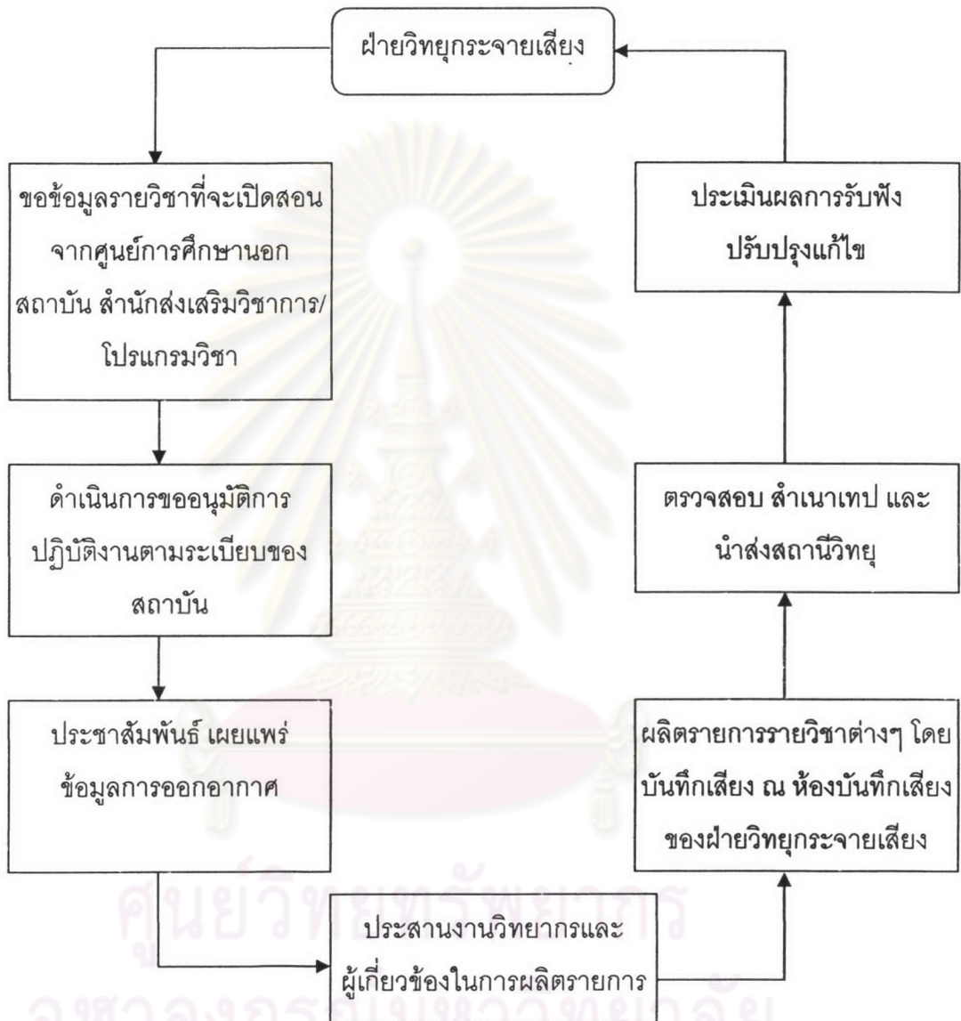
แผนภูมิที่ 4.3 แสดงขั้นตอนการดำเนินงานด้านการผลิตรายการก้าวไกลไปกับราชภัฏ ของ ฝ่ายวิทยุกระจายเสียง สถาบันราชภัฏสวนดุสิต

ฝ่ายวิทยุกระจายเสียง สถาบันราชภัฏสวนดุสิตดำเนินการผลิตรายการภายใต้ชื่อรายการก้าวไกลไปกับราชภัฏ ซึ่งนำรายวิชาต่างๆ ที่สถาบันเปิดสอนในระดับการศึกษาทางไกลมาผลิตเป็นรายการวิทยุโดยมีขั้นตอนการดำเนินการผลิตรายการเขียนเป็นแผนภูมิได้ดังต่อไปนี้