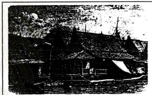
ภาพที่ 2.4 เรือนแพริมแม่น้ำเจ้าพระยา(จากหนังสือ เซอร์จอห์น เบาว์ริง)