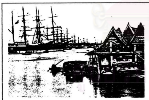
ภาพที่ 2.5 เรือนแพริมแม่น้ำเจ้าพระยา ในสมัยรัชกาลที่ 5 จะเห็นไม้ไผ่ที่มัดเป็น แพเพื่อใช้ทำเป็นทุ่นลอย