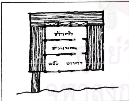
ภาพที่ 2.1 รูปแบบการวางผังเรือนแพตามแบบดั้งเดิม

ก.รูปแบบ เรือนแพแต่เดิมนั้น คือเรือนร้านค้าที่ลอยน้ำเคลื่อนไป - มาได้ รวมทั้งเป็นที่อยู่อาศัยบนอน มีลักษณะเหมือนเรือนไทยแฝด หลังในเป็นที่พักผ่อน - นอน หลังนอกเป็นร้านค้ามีฝา ถังเปิด - ปิด ด้านหน้าเป็นระเบียง ซึ่งติดกับน้ำ บางหลังมีระเบียงรอบ ช่วงยาวมี 3 ห้อง