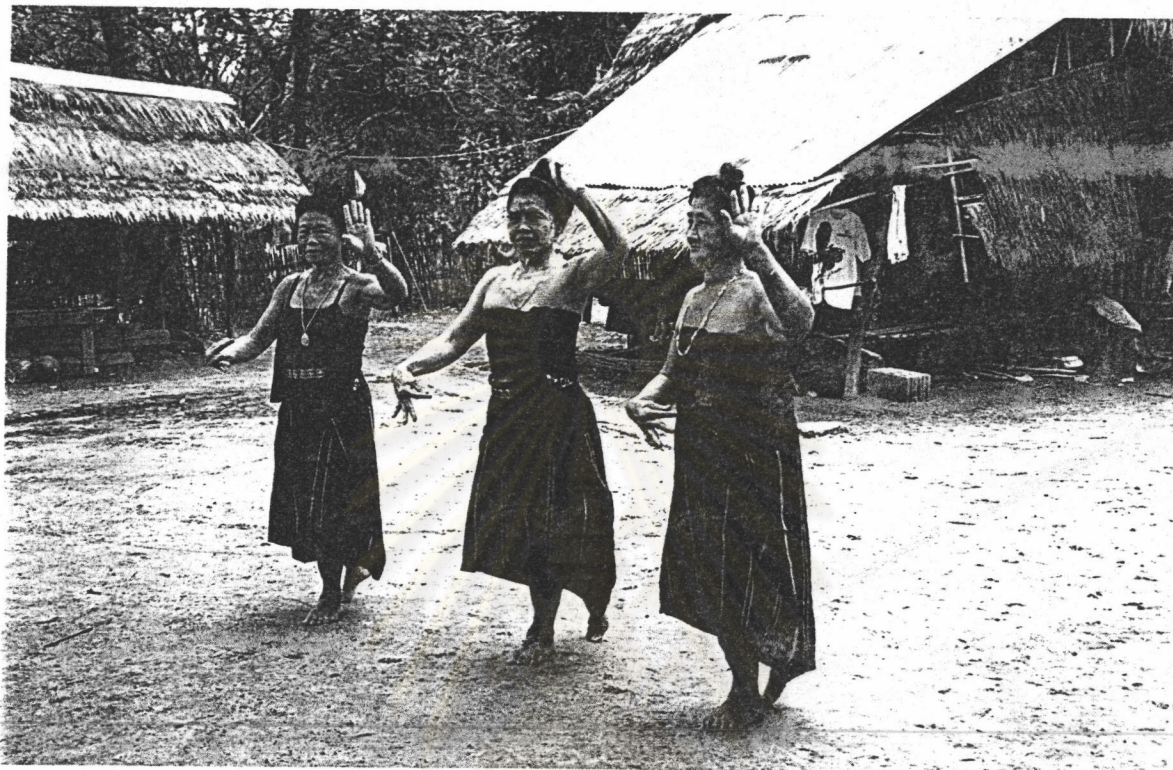
ภาพที่ 6 ก้าวย่าง

ผู้พ้องแสดงท่าก้าวย่าง ไปข้างหน้า โดยวางฝ่าเท้าราบกับพื้นเต็มเท้า ย่อเข่าเล็กน้อย เปิดส้นเท้าหลัง โดยการใช้นิ้วปลายนิ้วเท้าแตะพื้นอยู่ในแนวเดียวกับเท้าหน้า