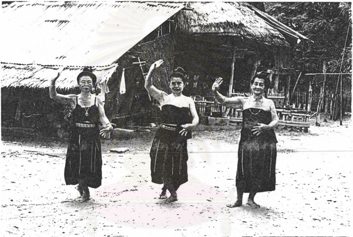
ภาพที่ 15 ม้วนมือลักษณะที่เรียกว่า ฟ้อนควงมือ

4.1.1 จับมือแล้วม้วนมือ คือ หักข้อมือลงมากำมุกกับลำแขน ประมาณ 90 องศา โดยให้นิ้วชี้หักลงมาโดยทำมุมกับนิ้วกลาง ประมาณ 45 องศา และขนานกับ นิ้วหัวแม่มือ นิ้วที่เหลือปล่อยตามธรรมชาติ แล้วหมุนข้อมือไปทางนิ้วก้อย หักข้อมือตั้งขึ้นให้ฝ่ามือหัน ออกนอกลำตัว ลักษณะการม้วนมือเช่นนี้แม่ครูไทยทรงดำเรียกว่า "ฟ้อนควงมือ" 3