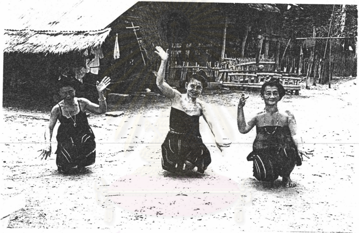
ศูนย์วิทยทรัพยากร จุฬาลงกรณ์มหาวิทยาลัย

2.2 การนั่งยอง ๆ คือ การพ้อนด้วยวิธีการนั่งย่อเข้า โดยให้ขาข้างหนึ่งงอลงประมาณ 90 องศา ส่วนขาอีกข้างหนึ่งงอขนานกับพื้นเปิดส้นเท้า เพื่อรับน้ำหนักในการทรงตัว โดยให้ส่วนก้นวางบนส้นเท้า