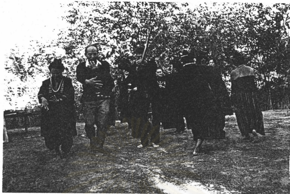
ภาพที่ 3 ท่วงท่าการพ้อนเกี้ยว

ผู้พ้อนฝ่ายหญิงและฝ่ายชายจะเดินพ้อนเคียงคู่กันไปตามวง ซึ่งเป็นท่าในลำดับสุดท้ายของท่าพ้อนเกี้ยว