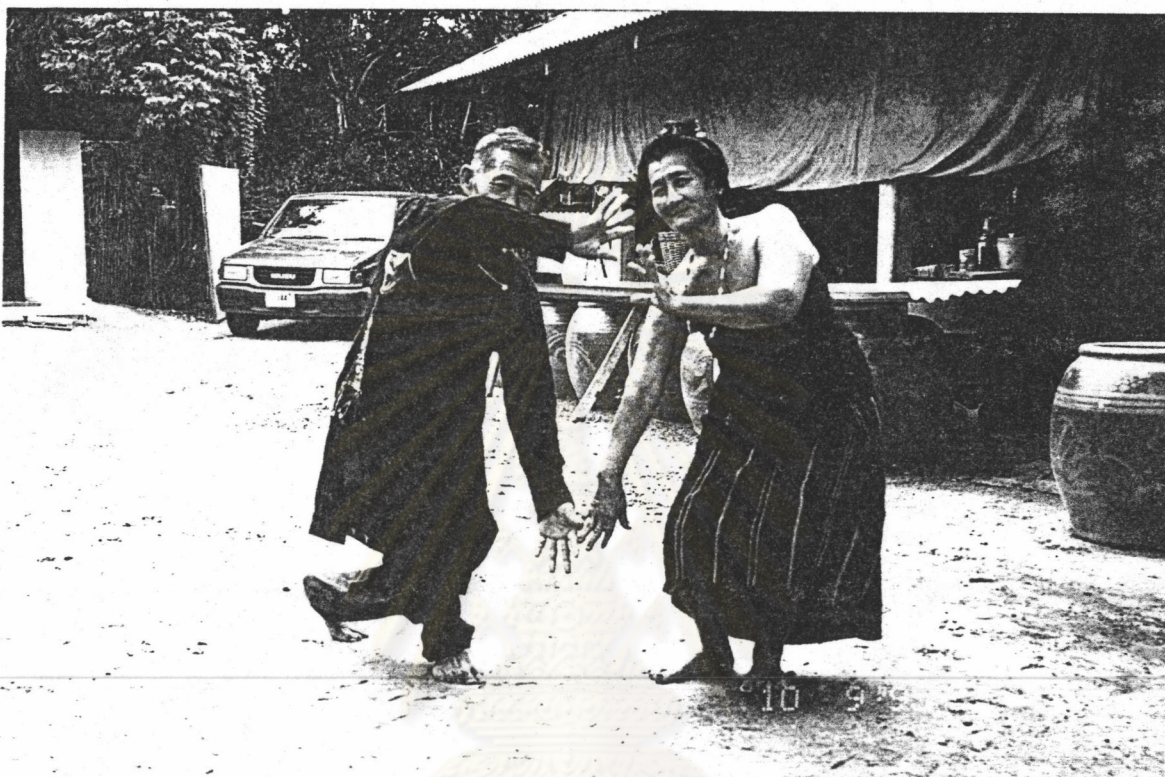
ภาพที่ 18 ตักมือ

4.3 ตักมือ คือการใช้มือข้างใดข้างหนึ่ง หรือทั้งสองข้างของผู้พ้อนฝ่ายชาย โดยหงายมือและซ้อนมือขึ้นเพื่อเปิดผ้าขึ้นหรือทำท่าจับอวัยวะที่สงวนของฝ่ายหญิง