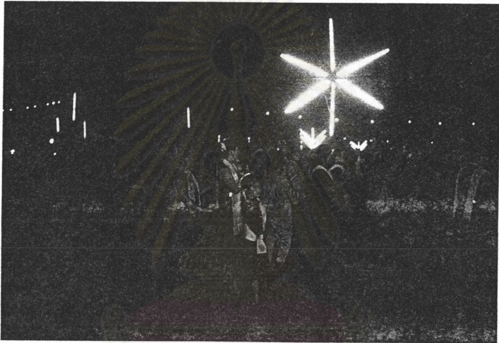
ภาพที่ 1 บรรยากาศของการพ้องในบริเวณลานพ้องใหญ่ในงานประเพณีไทยทรงดำ บ้านห้วยท่าช้าง อำเภอเขาย้อย จังหวัดเพชรบุรี 23 เมษายน พ.ศ. 2537 มีชาวไทยทรงดำในท้องถิ่นต่าง ๆ ทุกเพศ ทุกวัยมาร่วมพ้องกันตามประเพณี

เวลาที่เริ่มงานจะมีโฆษกผู้ชายทำหน้าที่ประกาศแจ้งเรื่องราวต่าง ๆ ผ่านเครื่องขยายเสียงโดยใช้ภาษาพื้นบ้านไทยทรงดำ และเมื่อได้เวลาในการพ้อง ประมาณ 19.00 น. โฆษกจะประกาศเชิญชวนผู้คนที่มาในงาน ให้เข้าร่วมพ้องที่ลานพ้องใหญ่ ซึ่งเป็นจุดศูนย์รวมของผู้พ้องจากทุกท้องถิ่นในบริเวณงาน มีการใช้แสงสว่างจากหลอดไฟนีออนสีต่าง ๆ ซึ่งติดประดับประดาไว้โดยรอบ