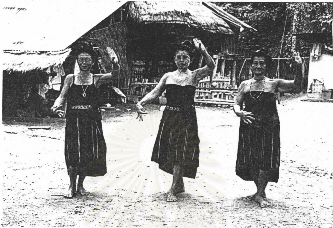
ภาพที่ 5 การขำเท้า

ผู้สาธิตคนที่ 1 แสดงการวางฝ่าเท้าทั้งสองข้างลงบนพื้น ย่อเข้าเล็กน้อย โดยที่ปล่อยให้ปลายเท้าแตะพื้นเล็กน้อย น้ำหนักตัวอยู่ที่เท้าหลัง