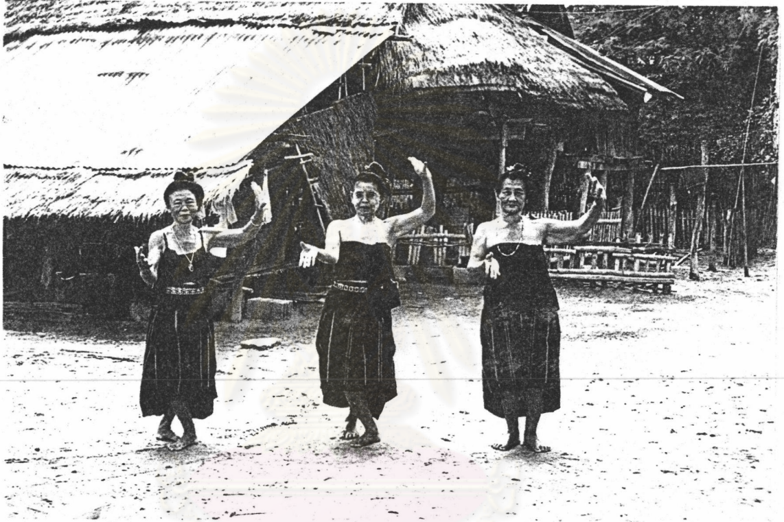
ภาพที่ 16 ม้วนมื่อลักษณะที่เรียกว่ำ พ้อนตักมื่อ

4.1.2 แบริ่มอแล่วม้วนมื่อ คื่อ การยกแขนเบ็นวงสูง หรือต่ำ ให้ ฝ่ามือหันเข้าหาลำตัว แล่วหักข้อมื่อลงหมุนข้อมื่อเข้าหาลำตัว ไปทางนิ้วก้อย แล่วจึงพลิกข้อมื่อให้ ฝ่ามือหันออกนอกลำตัว ลักษณะการม้วนมื่อเช่นนี้ แม่ครูชาวไทยทรงดำเรียกว่ำ "พ้อนตัก" 4