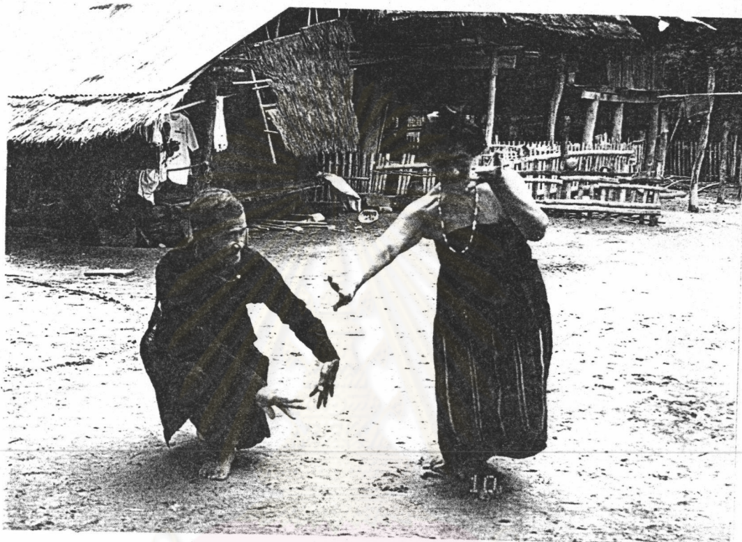
ภาพที่ 4 ท่วงท่าการพ้อนเกี้ยว

ฝ่ายชายนั่งยอง ๆ หันหน้าเข้าหาฝ่ายหญิง มือทั้งสองอยู่ในระดับต่ำ ทำท่าพ้อนในลักษณะ จะเปิดชายผ้าขึ้นของฝ่ายหญิง ฝ่ายหญิง หันด้านข้างให้ผู้ชาย ยื่นย่อเข้าเท่าเหลื่อมกัน โดยน้ำหนักตัว อยู่ที่เท้าหลัง มือทำท่าพ้อนปิดป้อง