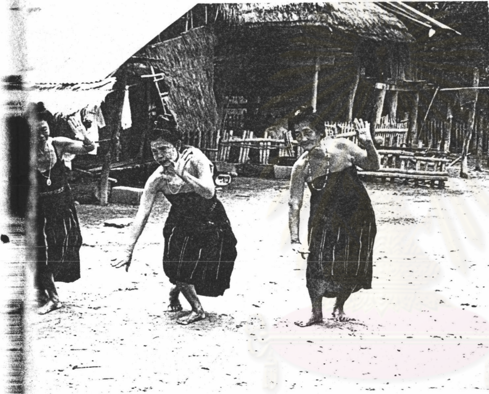
ภาพที่ 21 โนมมือ

4.6 โนมมือ คือ การใช้มือข้างหนึ่งตั้งวงระดับประมาณครึ่งน่อง อีกมือ ทำไขว้สวนทางกับคู่พ้อง โดยให้มือในโนมใกล้กัน ย่อเข้าก้มตัวเล็กน้อย อีกข้างหนึ่ง โนมสวนกลับมาในทิศทางเดิม