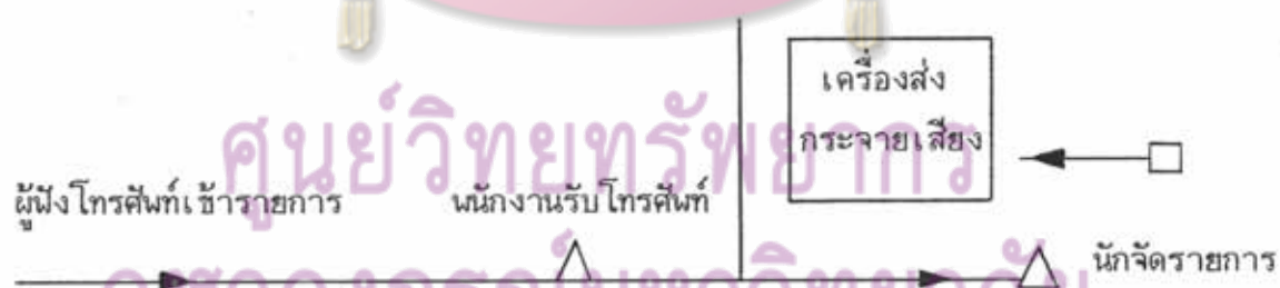
แผนภาพที่ 2.3 : การรับโทรศัพท์โดยพนักงานรับโทรศัพท์