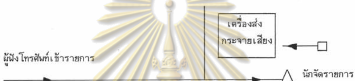
แผนภาพที่ 2.2 : การรับโทรศัพท์โดยผู้ดำเนินรายการ

การให้ผู้ฟังโทรศัพท์เข้ามาในรายการ (phone in) และออกอากาศสด เป็นเทคนิค การดำเนินรายการที่ผู้ผลิตรายการไม่ต้องลงทุนสูง โดยมีวัตถุประสงค์เพื่อเปิดโอกาสให้ผู้ฟังได้ พูดคุย/แสดงความคิดเห็นในเรื่องที่สนใจ รวมทั้งสร้างการมีส่วนร่วมในรายการ ซึ่งเป็นลักษณะ เดียวกันกับการที่ผู้อ่านเขียนจดหมายถึงบรรณาธิการสื่อสิ่งพิมพ์ ในการรับสายผู้ฟังที่โทรศัพท์ เข้า มาในรายการนั้น อาจแสดงให้เห็นเข้าใจตามแผนภาพต่อไปนี้ (ที่มา : Robert McLeish, Technique of Radio Production , 1988 : 116