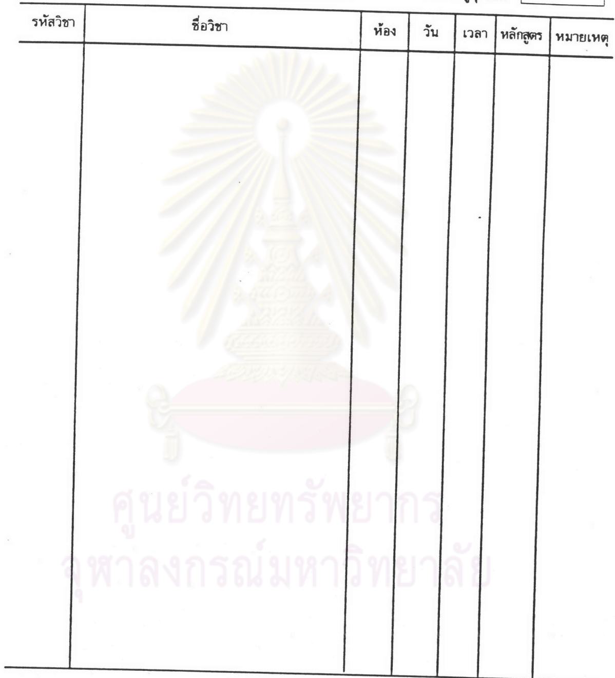
รูป ค.6 ใบแจ้งคุณสมบัติสำหรับอาจารย์