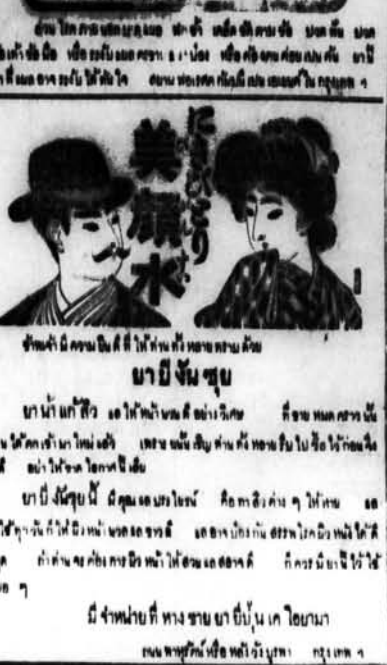
ภาพประกอบที่ ๓ แผนแรกของหนังสือพิมพ์ไทย ของพระคลังข้างที่

ประกาศ บริษัท... (Text regarding company matters and legal notices)