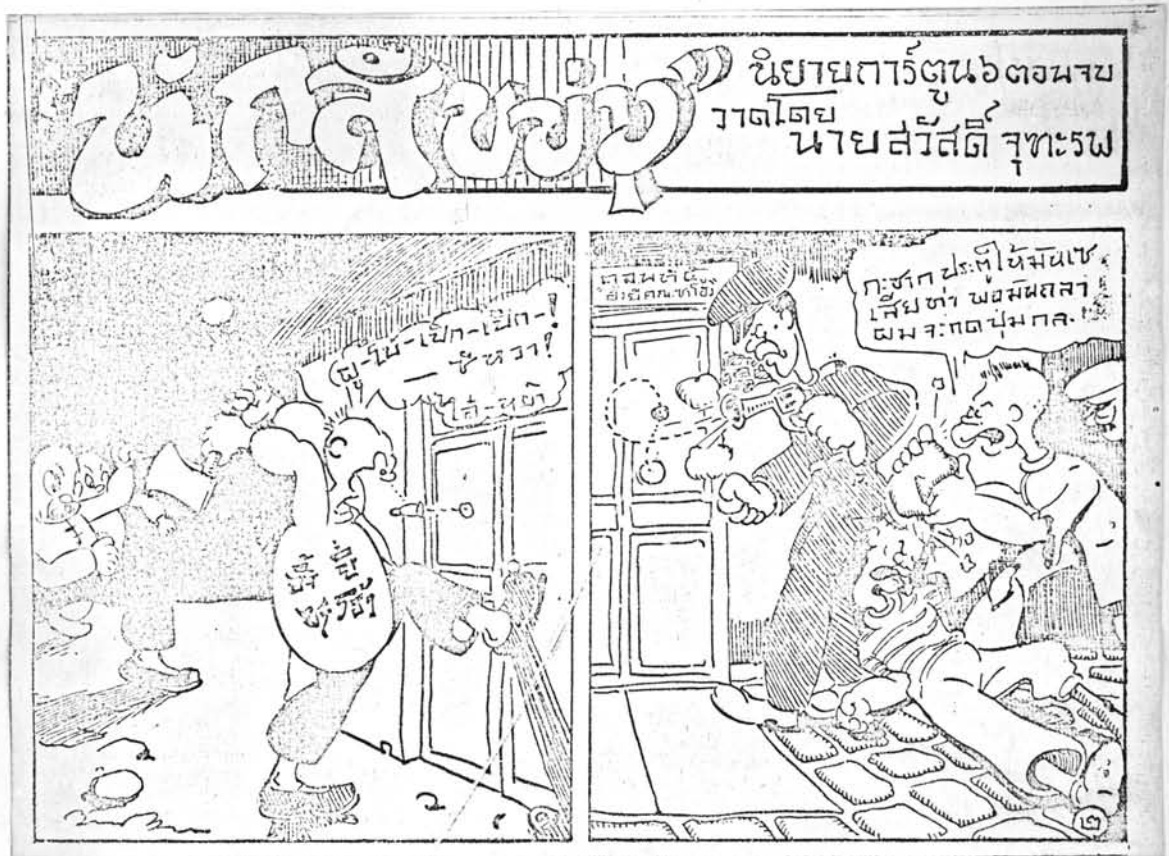
ภาพประกอบที่ ๗ นิยายการ์ตูน จาก หนังสือพิมพ์สยามหนุ่ม