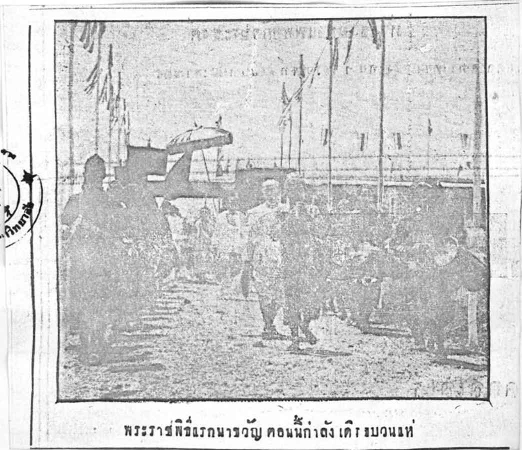
พระราชพิธีแรกนาขวัญ คอนนี้กำลัง เเคิร มวนเฑ