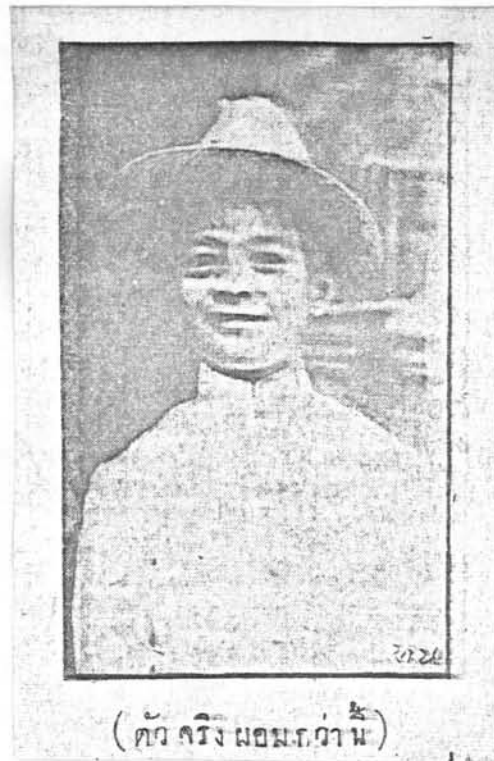
ภาพประกอบที่ ๕ ประกาศเด็กหาย จาก หนังสือพิมพ์ ไทยหนุ่ม

ในด้านการให้บริการ มีการลงรูปประกาศเด็กหายพร้อมทั้งรายละเอียดที่แจ ัดกษณะและที่อยู่ ดังตัวอย่างหนังสือพิมพ์ ไทยหนุ่ม ฉบับวันที่ ๑๒ กรกฎาคม ๒๕๓๒ ลงประ ภาศ เด็กหาย