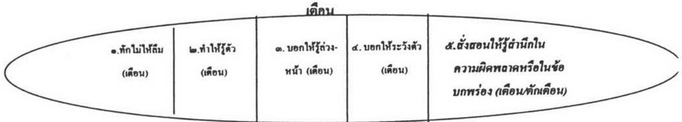
แผนภูมิที่ ๑ แสดงความสัมพันธ์ระหว่างการ “ตักเตือน” และ “เตือน” ตามความเข้าใจของผู้ใช้ภาษาไทย

หมายกว้างกว่า หมายถึง “ทักไม่ให้ลืม” “ทำให้รู้ตัว” “บอกให้รู้ล่วงหน้า” “บอกให้ระวังตัว” และ “สั่งสอนให้รู้หรือสำนึกในความผิดพลาดหรือในข้อบกพร่อง” ส่วน “ตักเตือน” มีความหมายเฉพาะว่า “สั่งสอนให้รู้หรือสำนึกในความผิดพลาดหรือในข้อบกพร่อง”