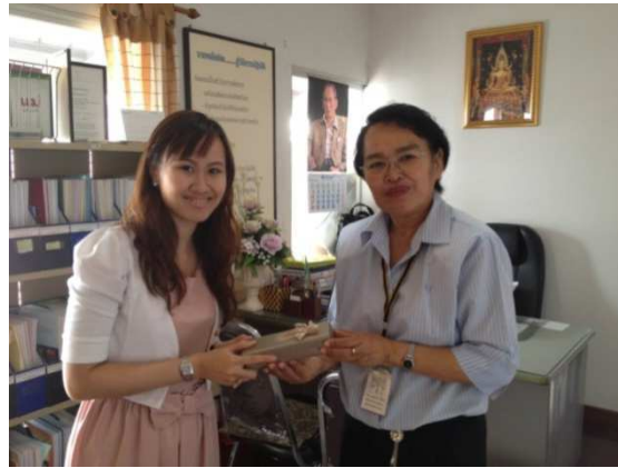
สัมภาษณ์ผู้อำนวยการ กศน. เขตพระโขนง