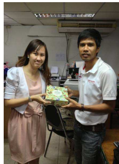
สัมภาษณ์ผู้อำนวยการและครู กศน. เขตสัมพันธวงศ์