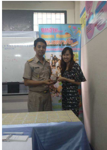
สัมภาษณ์ครู กศน.เขตบางรัก