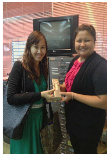
สัมภาษณ์ ครู กศน. เขตคลองเตย