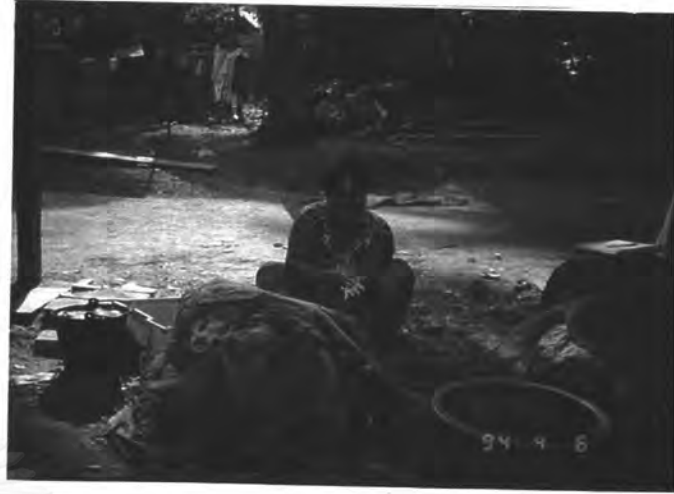
การทำไซปลา