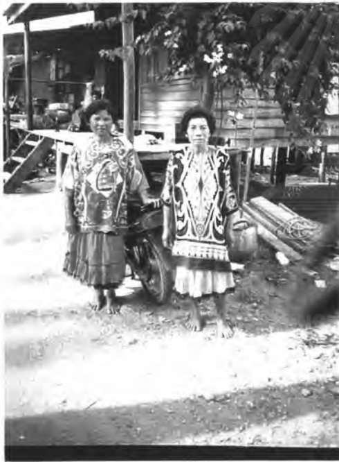
ชาวเลจะแต่งกายสวยงามในงานประเพณีสำคัญ