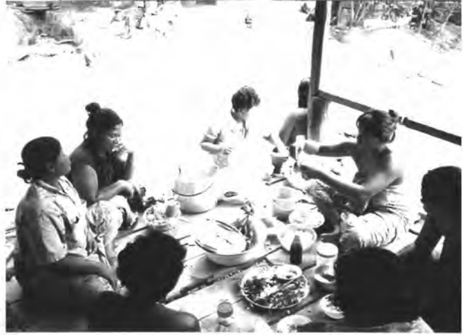
แม่ค้ำนำขนมจีนมาขายที่หมู่บ้าน