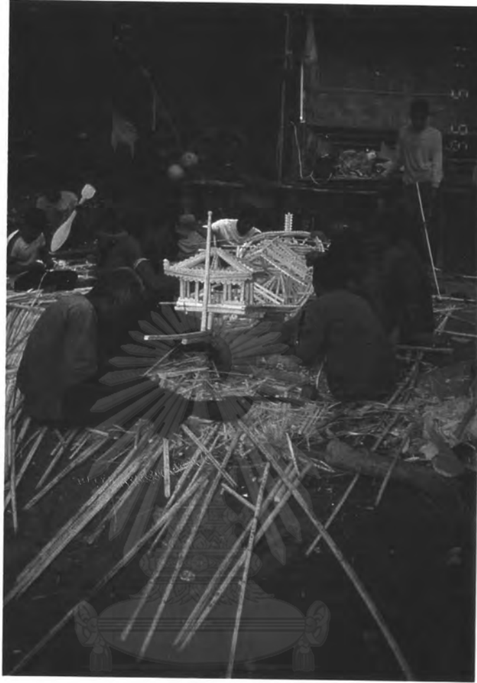
จุฬาลงกรณ์มหาวิทยาลัย Chulalongkorn University

ชาวเลร่วมมือร่วมใจกันต่อเรือปาจึกเพื่อใช้ในพิธีลอยเรือ