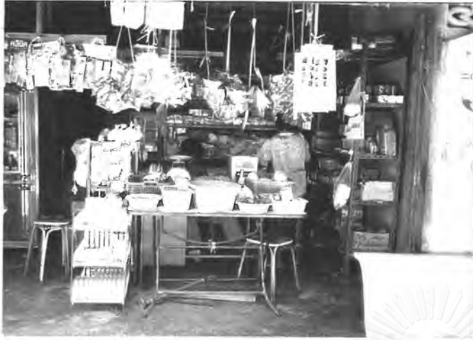
ร้านขายของในหมู่บ้าน