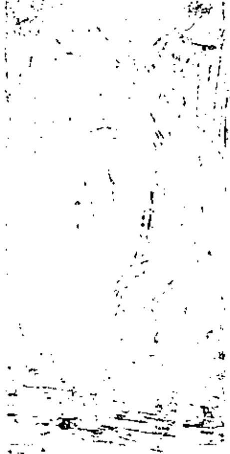
เครื่องถ่ายภาพ Double Super-8