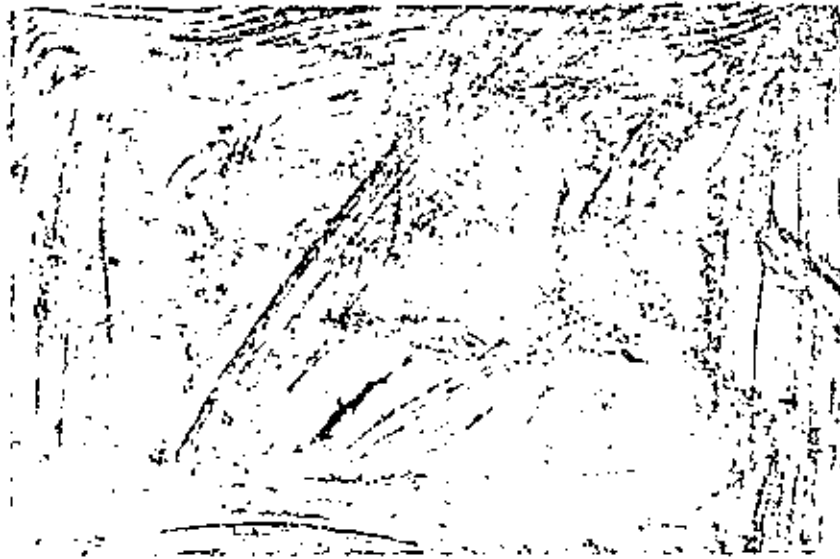
เครื่องฉายอากาศยนตร์ ๕ มม. ทั้งแบบธรรมดาและแบบสุฟไฟ สะดวก ใจร ๆ ก็สามารถฉาย ได้