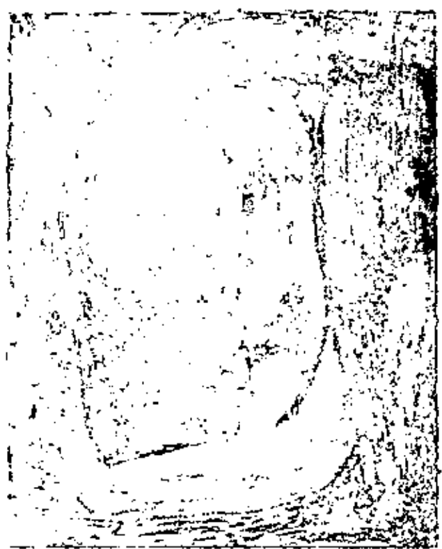
เครื่องถ่ายภาพ Super-8 แบบอาชีพ (Professional)