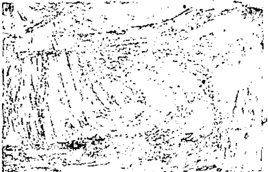
ในถาวร เรลด่านรับศึกษาเป็น รายบุคคลจะโม เครื่องฉายอากาศ- ยนตร์ ๕ มม. และสุฟไฟเสียง จากอากาศยนตร์