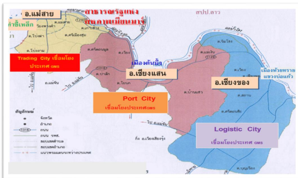
รูปที่ 7 แผนที่แสดงพื้นที่เขตพัฒนาเศรษฐกิจพิเศษเชียงราย