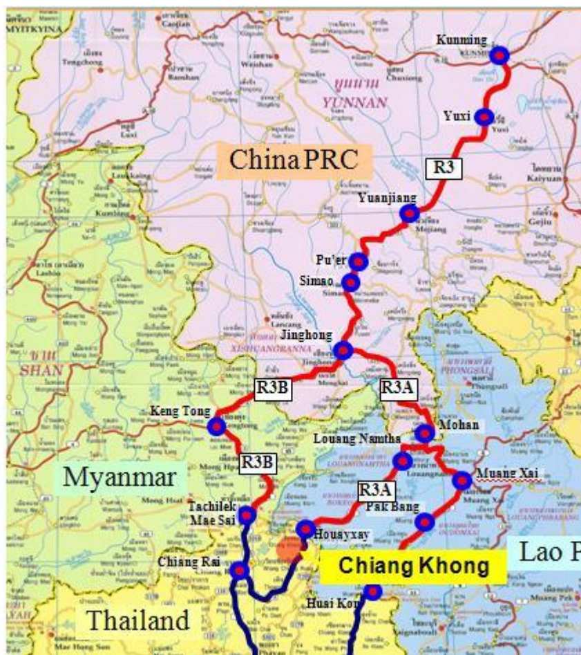
รูปที่ 3 แผนที่แสดงเส้นทางการค้าระหว่างจีนและพื้นที่ชายแดนไทยในจังหวัดเชียงราย

ประเด็นด้านการค้าชายแดนและผ่านแดนระหว่างไทยกับจีนตอนใต้เป็นอีกส่วนหนึ่งที่มีความสำคัญต่อการพึ่งพาซึ่งกันและกันระหว่างไทย-จีน ซึ่งสัมพันธ์ต่อการเคลื่อนย้ายของชาวจีนอพยพระลอกใหม่ด้วย แม้ว่าสถิติของทางการจะไม่สามารถรวมการสวมสิทธิ์ผ่านลาว เวียดนาม และ เวียดนาม เพื่อส่งเข้าไปจีนด้วยก็ตาม ซึ่งหากทำได้คงสามารถสะท้อนสถิติที่บ่งบอกถึงการพึ่งพาซึ่งกันและกันระหว่างไทยกับจีนได้มากกว่าที่ปรากฏเป็นทางการ สำหรับการค้าผ่านแดนของไทยนั้นมียุคค้าอยู่ 3 ประเทศ ได้แก่ สิงคโปร์ เวียดนาม และตอนใต้ของจีน