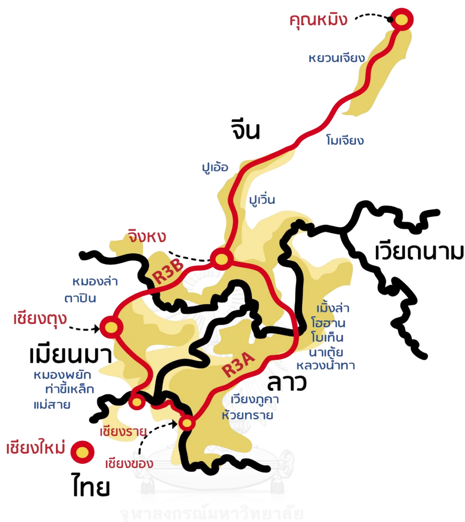
รูปที่ 1 แผนที่แสดงเส้นทางการอพยพของชาวจีนอพยพพระลอกใหม่จากจีนมาสู่ไทยตามเส้นทางสาย R3