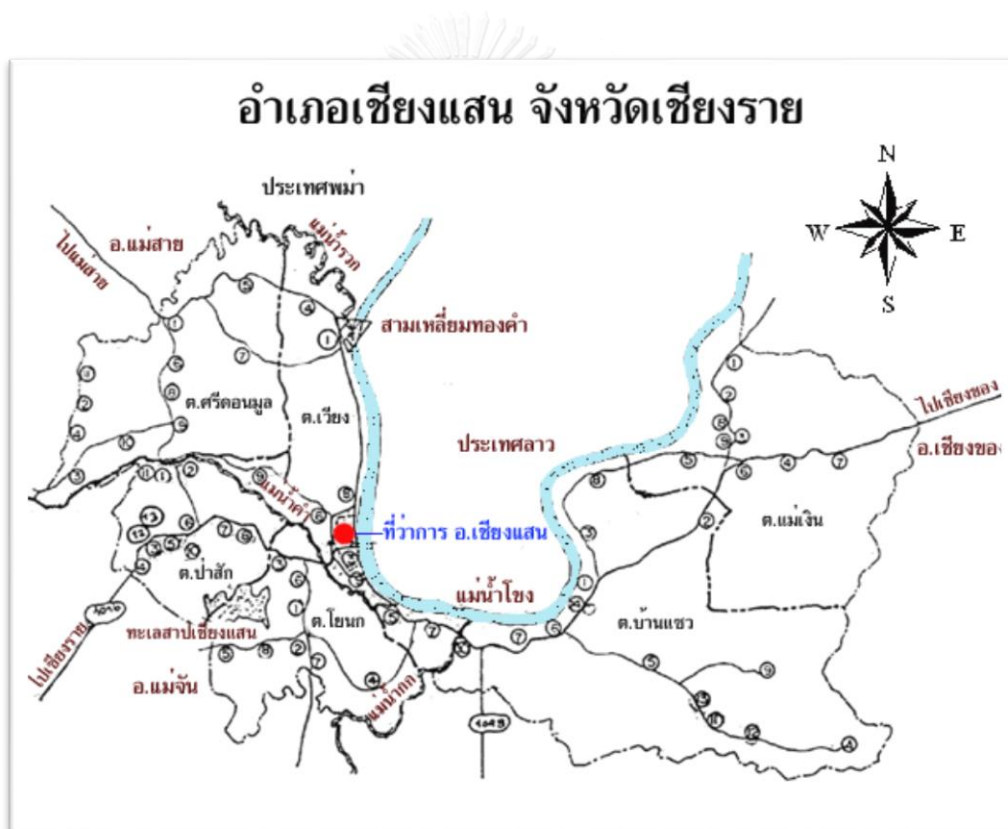
รูปที่ 5 แผนที่แสดงสภาพที่ตั้งของอำเภอเชียงแสน

ส่วนในอำเภอเชียงแสนที่เป็นหนึ่งในประตูชายแดนและเป็นเมืองท่าเรือรับส่งสินค้าตามแนวแม่น้ำโขงที่สำคัญของไทย มีการเดินเรือสินค้าตามลำน้ำโขงเชื่อมต่อไปยังลาว เมียนมาร์ และจีนตอนใต้ แนวชายแดนเชียงแสนนั้นอยู่ตรงข้ามเมืองต้นฝั้ง แขวงบ่อแก้วประเทศลาว และมีสามเหลี่ยมทองคำที่เชื่อมต่อทั้งเมียนมาร์และลาวด้วย โดยเมืองเชียงแสนนั้นถือเป็นเมืองแรกๆ ที่มีการเคลื่อนย้ายเข้ามาของชาวจีนอพยพระลอกใหม่ในประเทศไทย เมื่อประมาณ 10 กว่าปีที่แล้ว ชาวจีนเหล่านี้เข้ามาค้าขายในประเทศไทยโดยอาศัยช่องทางการค้าทางเรือผ่านแม่น้ำโขงที่เชื่อมไทยกับจีนตอนใต้ โดยทำอาชีพค้าขาย มีทั้งนำสินค้าจากจีนลงมาขายในไทย