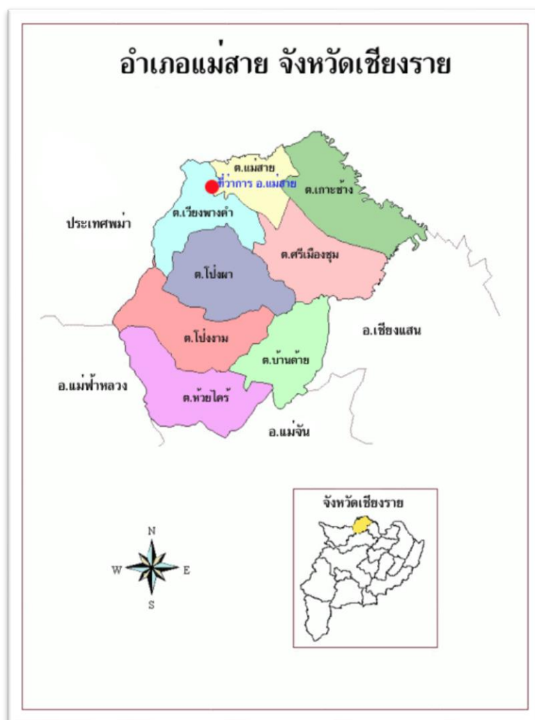
รูปที่ 4 แผนที่แสดงสภาพที่ตั้งของอำเภอแม่สาย

โครงการพัฒนา “สี่เหลี่ยมเศรษฐกิจ” ระหว่างไทย จีน ลาว เวียดนามในปี 1992 และเป็นที่มาของการจัดตั้งเขตเศรษฐกิจพิเศษชายแดนของไทย ที่มีอำเภอแม่สายเป็นหนึ่งในเมืองนำร่องร่วมกับอำเภอเชียงแสน และอำเภอสะเดา 227 เพื่อเชื่อมต่อและสนับสนุนด้านการค้า การลงทุนด้านอุตสาหกรรม และการท่องเที่ยวตามแนวเศรษฐกิจเหนือใต้ระหว่างไทย จีน เวียดนาม และลาวในขณะนั้น