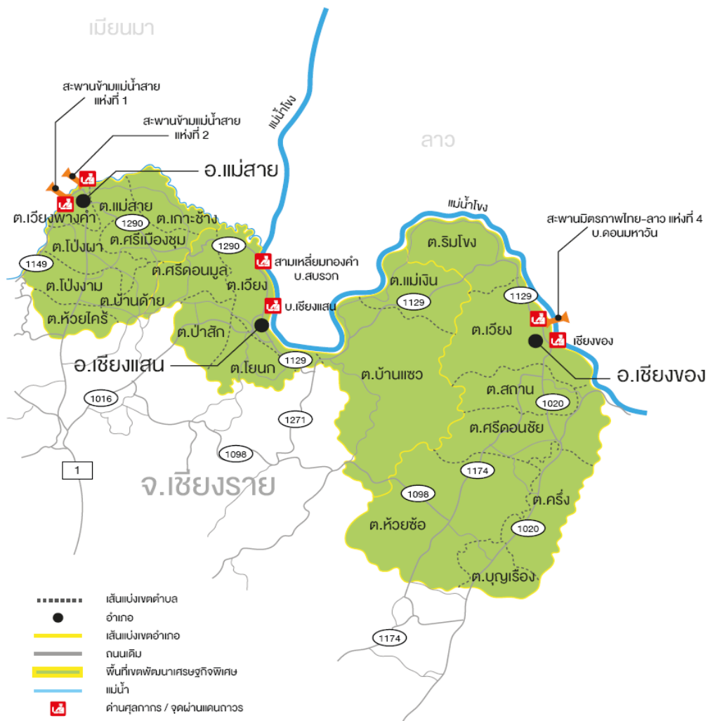
รูปที่ 2 แผนที่แสดงพื้นที่ที่วิทยานิพนธ์เล่มนี้ทำการศึกษา

โดยการอพยพของชาวจีนระลอกใหม่มาสู่ไทยรวมถึงผลกระทบที่เกิดจากปฏิสัมพันธ์กับชาวจีนระลอกใหม่นอกเขตแดนไทยจะเป็นประเด็นที่วิทยานิพนธ์เล่มนี้จะให้ความสนใจ โดยพื้นที่ที่ศึกษา คือ อำเภอแม่สาย อำเภอเชียงแสน และอำเภอเชียงทอง (ดังปรากฏในรูปที่ 2) ซึ่งเป็นพื้นที่หน้าด่านชายแดนที่ติดกับพื้นที่ของประเทศลาวที่มีชาวจีนอพยพระลอกใหม่เคลื่อนย้ายเข้ามาทำการค้าจำนวนมาก พื้นที่ของลาวดังกล่าวคือ เมืองต้นผึ้งที่อยู่ฝั่งตรงข้ามแม่น้ำโขงกับอำเภอเชียงแสน และเมืองห้วยทรายที่อยู่ฝั่งตรงข้ามแม่น้ำโขงกับอำเภอเชียงทอง จากพื้นที่เมืองต้นผึ้งและเมืองห้วยทรายในประเทศลาว มีชาวจีนอพยพระลอกใหม่บางส่วนได้เดินทางข้ามแดนมาสู่ไทย และบางส่วนถึงแม้ไม่ได้อพยพมา แต่ก็ได้มีการค้าขายที่ส่งผลกระทบต่อพื้นที่ของไทย เช่น การค้าขาย และการทะลักเข้ามาของสินค้าจีน