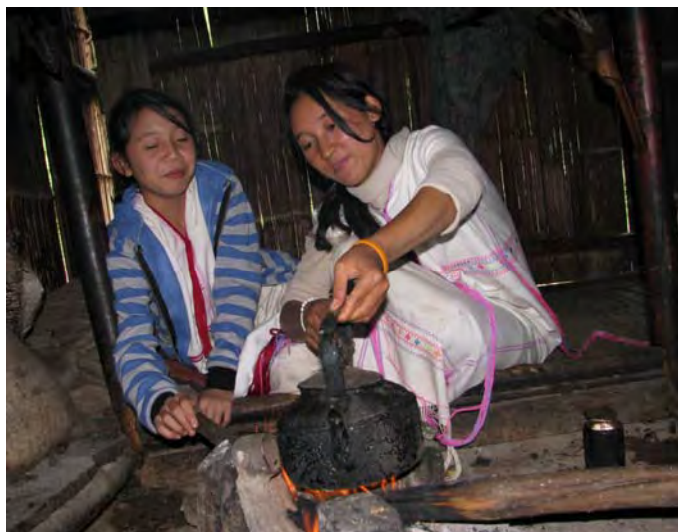
ภาพประกอบที่ 5 ห้องนอนของบ้านปกากะญอ