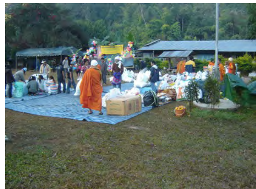
กิจกรรมพระบัณฑิตอาสาพัฒนาชาวเขาทำงานร่วมกับเยาวชนชาติพันธุ์ป่าเกอญอ