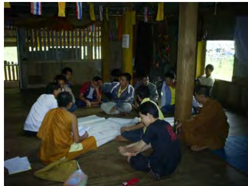
อบรมก่อนลงพื้นที่ปฏิบัติศาสนกิจ