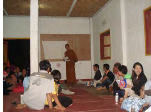
เวทีแลกเปลี่ยน