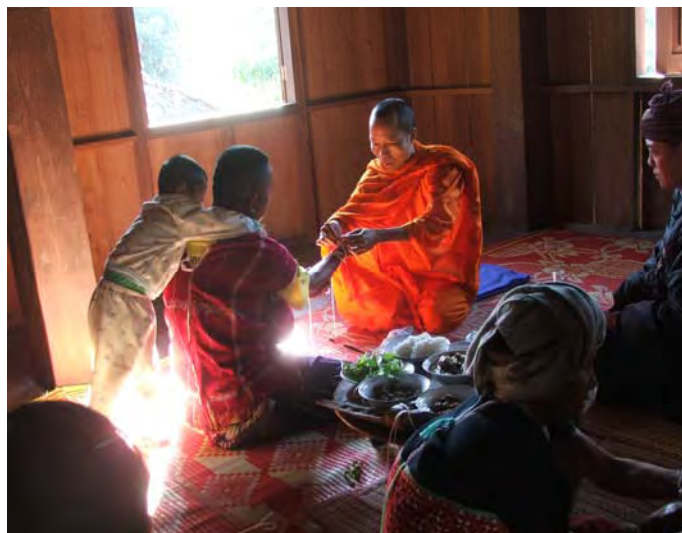
ภาพประกอบที่ 11 พิธีกรรมประเพณีมัดมือ

ถือเป็นประเพณีที่สำคัญที่สุดของชนเผ่า จะมีการต้มเหล้า ซ่าหฺมู เตรียมไว้ให้แขกที่มาบ้านได้รับประทานและพูดคุยกันอย่างสนุกสนาน