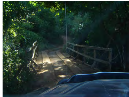
เส้นทางการเดินทาง