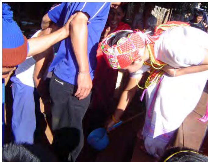
ภาพประกอบที่ 8 เจ้าสาวตักน้ำล้างเท้าเจ้าบ่าวก่อนขึ้นบ้าน

ฝ่ายหญิง โดยฝ่ายหญิงจะเป็นผู้ขอ ฝ่ายชายจะเป็นผู้ให้ การทำพิธีขอขันหมากใช้เวลานานมาก เพราะต้องมีการขับลำเนาผ่านชั้นตอน มีลีลาบ้ายเบียง เพื่อเป็นพิธี