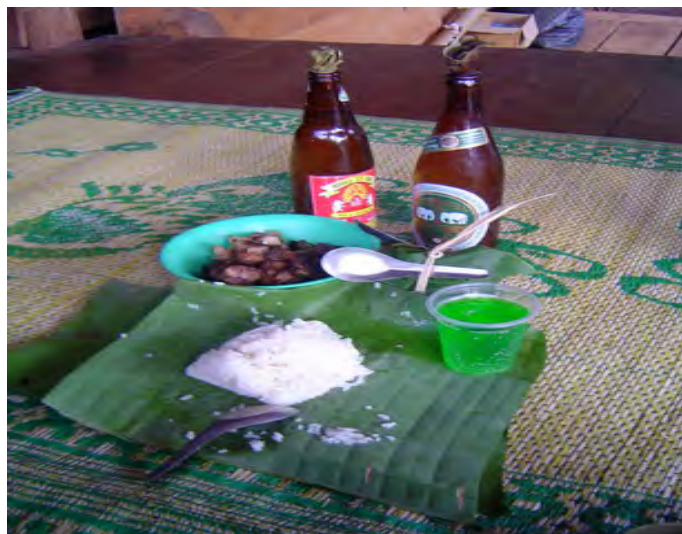
ภาพประกอบที่ 10 อาหารและเหล้าสำหรับแขกที่มาร่วมงาน