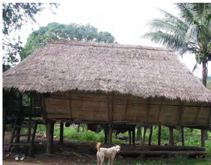
ภาพประกอบที่ 4 บ้านปกากะญอ (กะเหรี่ยง) (Pgazkoenyau)