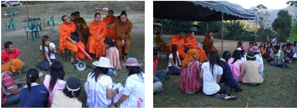
เวทียោวชน