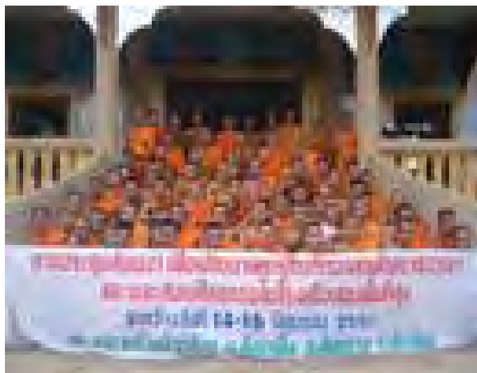
ภาพประกอบที่ 2 พระบัณฑิตอาสาพัฒนาชาวเขาผู้บริหารงาน และพระบัณฑิตอาสาพัฒนาชาวเขาระหว่างปี 2551-2552