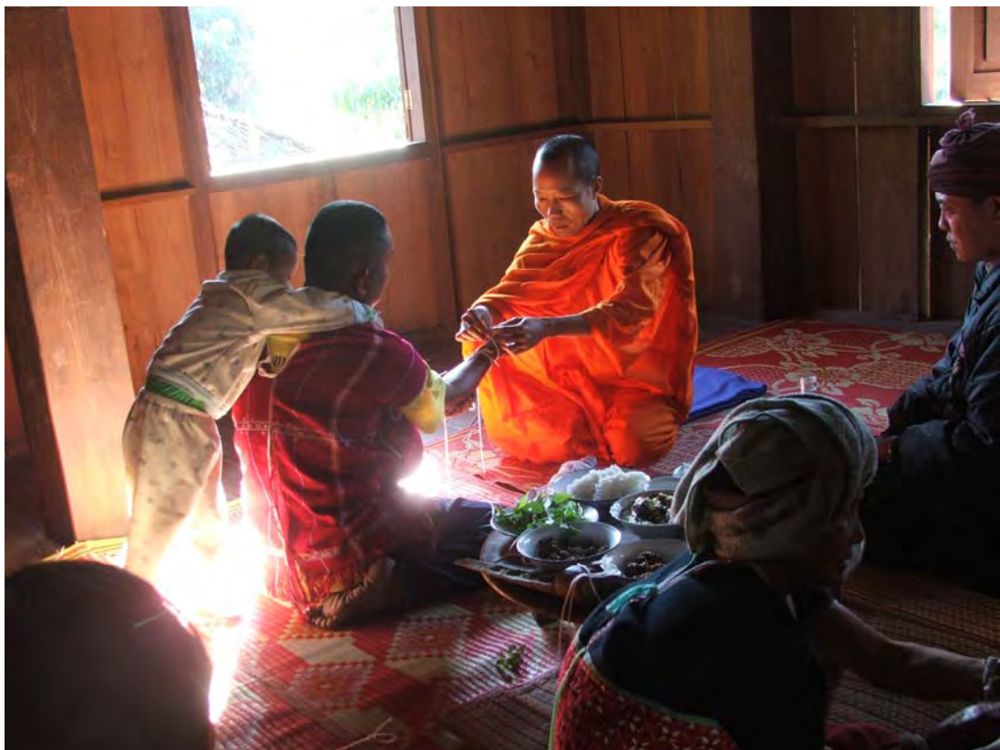
ประเพณีผูกข้อมือ-ผูกกรรม