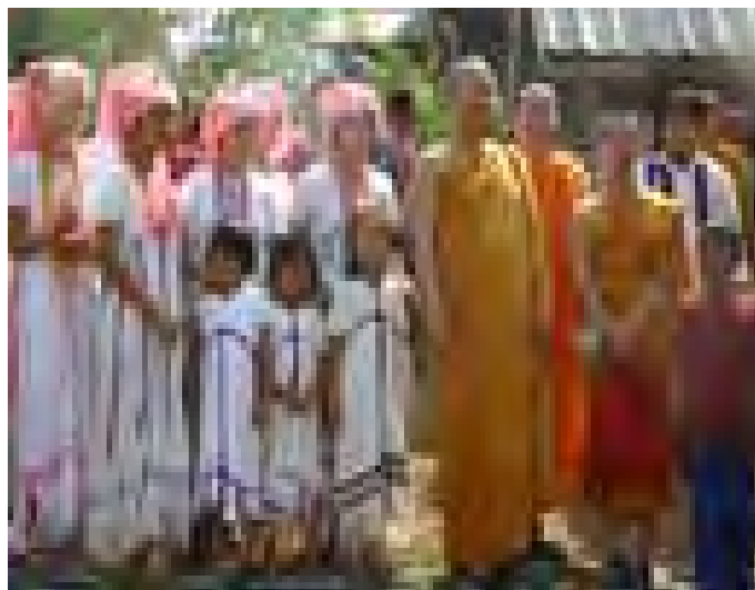
ภาพประกอบที่ 12 พระบัณฑิตอาสาพัฒนาชาวบรมเยวชนชาติพันธุ์ปกากะญอ (กะเหรี่ยง)

ปรับระบบความคิดและความต้องการของบุคคล เพื่อให้ตระหนักรู้คุณค่าของธรรมชาติ ของตนเอง และชุมชน ให้มองเห็นภัยแห่งการยึดมั่นถือมั่นในตนเอง หันมามองเห็นคุณค่าของการเอื้อเพื่อเอื้อแผ่ช่วยเหลือกัน มุ่งเน้นการพัฒนาด้านจิตใจมากกว่าวัตถุ (ขจัดภัย บุรุษพัฒนา, 2538: 81-82)