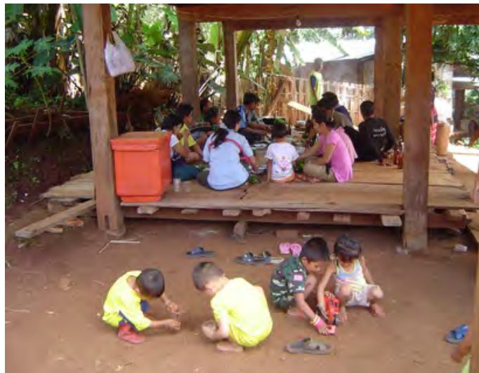
ภาพประกอบที่ เปรรยากาศเตรียมงานบ้านเจ้าสาว