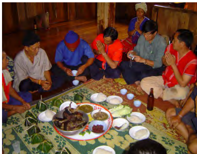
ภาพประกอบที่ 7ผู้อาวุโสกำลังสวดมนต์เพื่อเป็นสิริมงคลให้เจ้าสาว

ช่วงหนึ่งของพิธีแต่งงานจะมีการฆ่าไก่ 2 ตัว ต้มให้สุกโดยไม่ต้องปรุง ผู้เฒ่าผู้แก่ จะเลือกเด็กหญิงและเด็กชายฝ่ายละคน โดยที่เด็กสองคนต้องเป็นเด็กที่มีครอบครัวครบสมบูรณ์ ทั้งพ่อแม่และต้องมีชีวิตอยู่ เด็กสองคนจะมีหน้าที่จัดข้าวและเนื้อไก่มาให้เจ้าบ่าวและเจ้าสาว รับประทาน โดยที่เด็กหญิงจะจัดให้ฝ่ายเจ้าบ่าวและเด็กชายจะจัดให้ฝ่ายเจ้าสาว และเด็กจะได้รับ สร้อยลูกบิดและเงินหนึ่งบาทเป็นการตอบแทนน้ำใจที่มาช่วยเหลือ