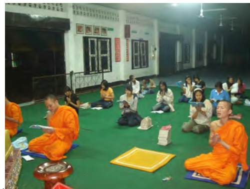
ทำวัตรสวดมนต์