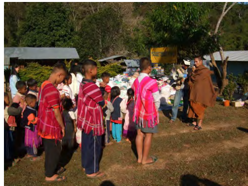
เผยแผ่พระพุทธศาสนา