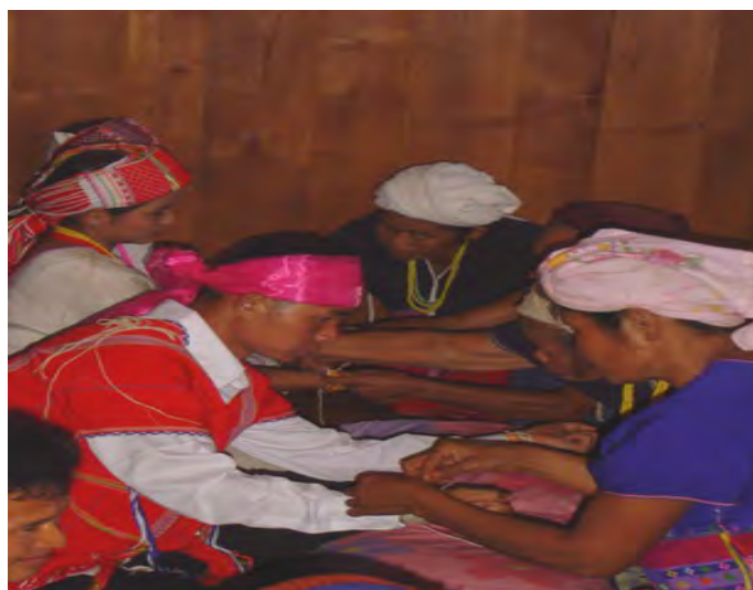
ภาพประกอบที่ 9 ผู้มาร่วมงานกำลังผูกข้อมือให้คู่บ่าวสาว

การเดินทางกลับของเจ้าแ้วและเพื่อนเจ้าบ่าว ฝ่ายหญิงจะฆ่าไก่ 2 ตัว (ซอ โจ้ ลอ) และนำไปต้มให้สุกและห่อให้เพื่อนเจ้าบ่าวนำกลับไป เพื่อเป็นอาหารระหว่างการเดินทาง เมื่อถึงเวลาอาหารก่อนรับประทานอาหารเจ้าแ้วจะทำพิธีถวายอาหารแต่เทพยดาเพื่ออวยพรให้กับผู้ร่วมเดินทางปลอดภัยกลับถึงบ้านโดยสวัสดิภาพ พอกลับถึงบ้านเจ้าแ้วก็จะให้ต้มเห็ดที่เพิ่งพักอีกครั้งหนึ่งเป็นครั้งสุดท้าย วันรุ่งขึ้นเพื่อนบ้านทุกคนจะต้องหยุดงาน ซึ่งถือเป็นข้อห้าม เรียกว่า “ดี เทาะ ไค้ เบล” แปลว่า “ข้อห้ามหัวหมู”