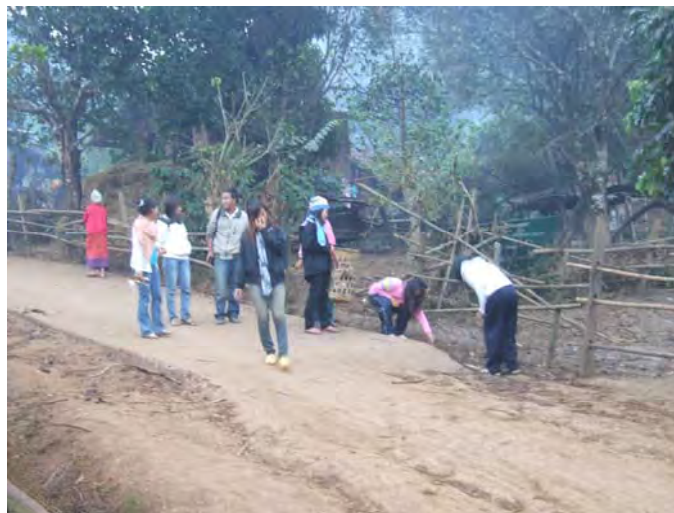
ทำความสะอาด เก็บขยะในชุมชน