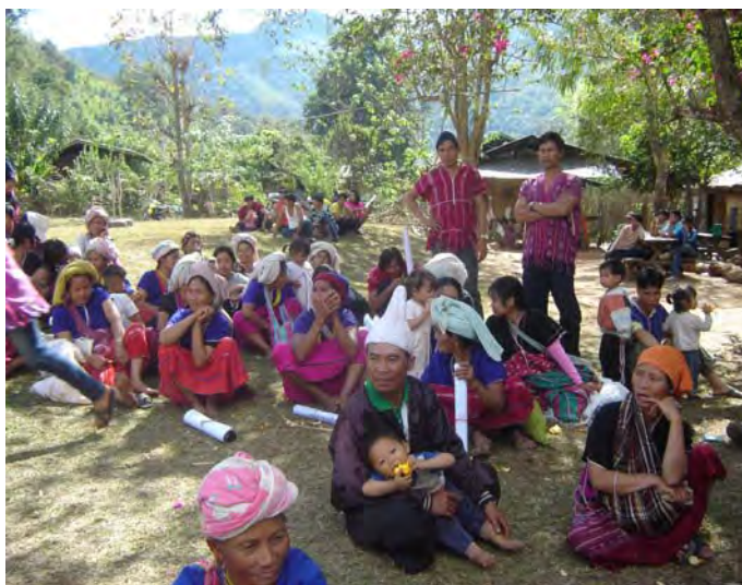
ภาพประกอบที่ 3 กลุ่มชาติพันธุ์ปกาเกอญอ (Pgazkoenyau) หรือ กะเหรี่ยง

กลุ่มชาติพันธุ์ปกาเกอญอ (Pgazkoenyau) หรือ กะเหรี่ยง เป็นชาติพันธุ์ที่มีประชากรมากที่สุดในประเทศไทย โดยมีประชากรทั้งหมด 437,131 คน คิดเป็นร้อยละ 47.54 ของประชากรชาวเขา หรือคิดเป็นร้อยละ 36.41 ของบุคคลบนพื้นที่สูงทั้งหมด จำแนกเป็นชายจำนวน 151,186 คน เป็นหญิง 146,168 คน เด็กชาย 70,193 คน เด็กหญิง 69,584 คน โดยอาศัยอยู่ในพื้นที่ 1,912 หมู่บ้าน 87,628 หลังคาเรือน และ 95,088 ครอบครัวในพื้นที่ 15 จังหวัดของจังหวัดที่มีชาติพันธุ์ปกาเกอญอ หรือ กะเหรี่ยง ตั้งถิ่นฐานบ้านเรือนอยู่ตามชายเขา ซึ่งพบมากที่สุดที่จังหวัดเชียงราย เชียงใหม่ และจังหวัดแม่ฮ่องสอน