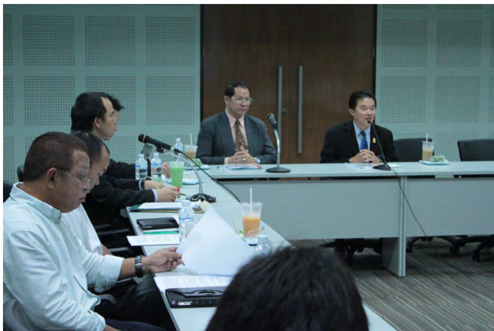
ผู้อำนวยการฝ่ายกีฬาอาชีพและกีฬามวย การกีฬาแห่งประเทศไทย เปิดการประชุม