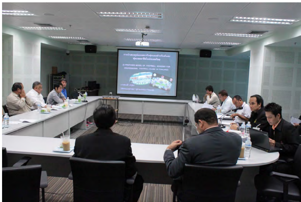
บรรยากาศการประชุมกลุ่ม(Focus Group) ณ ห้องประชุม ชั้น 5 การกีฬาแห่งประเทศไทย