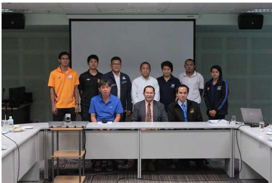
ตัวแทนจากสโมสรฟุตบอลอาชีพ สมาคมฟุตบอลแห่งประเทศไทยฯ ถ่ายรูปร่วมกันหลังจบการประชุมกลุ่ม