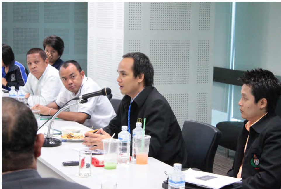
ผู้วิจัยนำเสนอรูปแบบสถาบันฟุตบอลสำหรับสโมสรฟุตบอลอาชีพในประเทศไทย