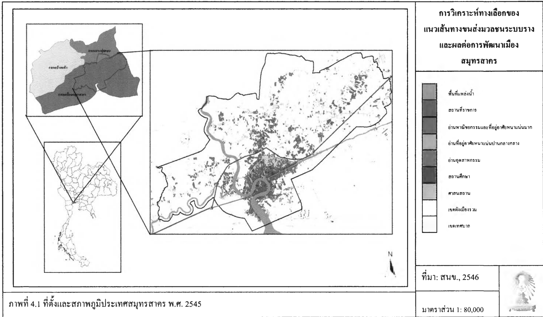
ภาพที่ 4.1 ที่ตั้งและสภาพภูมิประเทศสมุทรสาคร พ.ศ. 2545