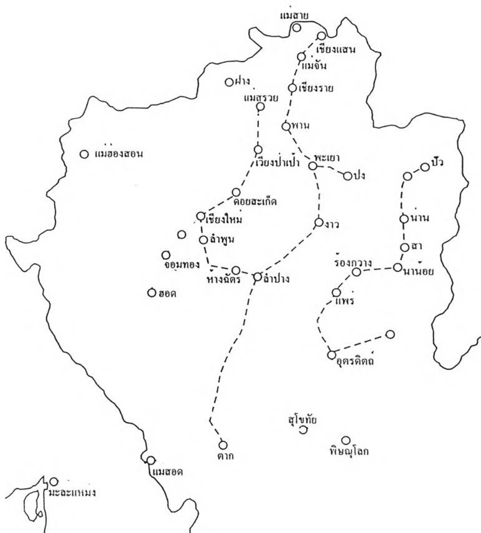
แผนที่ 2.2 เส้นทางการค้าข้ามพรมแดนจากเมะละแหม่งถึงยูนนานที่ ผ่านเมืองลำปาง แพร่ น่าน

ที่มา : ดัดแปลงจาก ชูสิทธิ์ ชูชาติ, "พ่อค้าวัวต่าง," เศรษฐศาสตร์ปริทัศน์ : 52