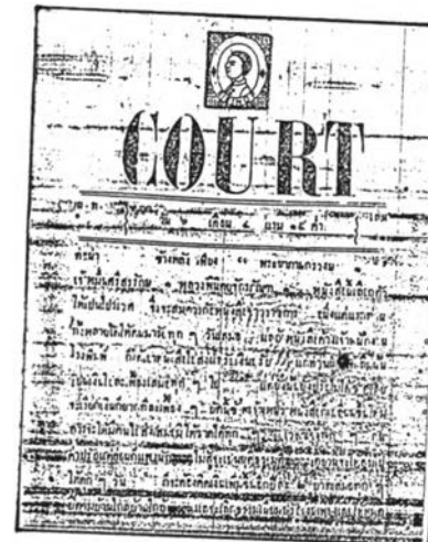
ตัวอย่างหนังสือพิมพ์ยุคโบประกาศข่าว