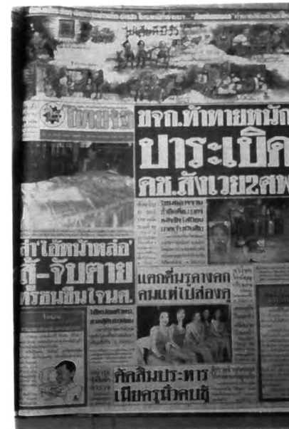
ตัวอย่างหนังสือพิมพ์ยุคแห่งความหลากหลายของเอกลักษณ์เฉพาะตน