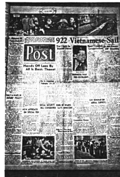
ตัวอย่างหนังสือพิมพ์ยุคแห่งความคล้ายคลึงของการจัดหน้าแบบมาตรฐานสากล