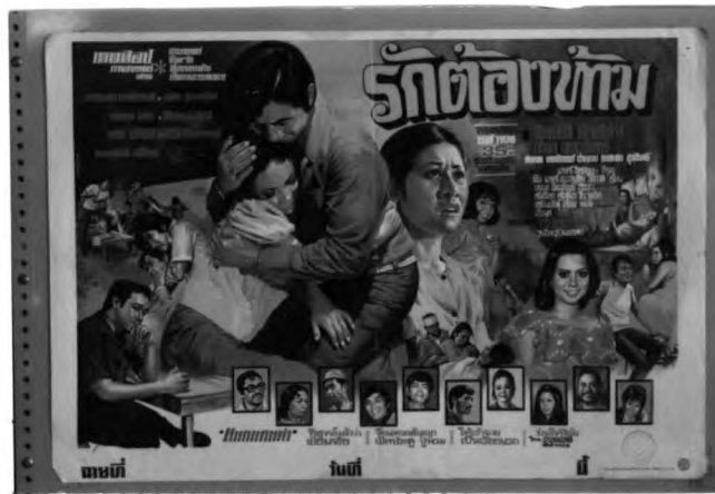
action ที่แสดงถึงความรัก

1.1.4 action ที่แสดงถึงพฤติกรรมที่ไม่เหมาะสมต่อภาพพจน์ที่ดีของกุล สตรีไทย ได้แก่ ทานเหล้า, สูบบุหรี่, เข้ายวนเพศตรงข้าม action ประเภทนี้มีประมาณ 2.5% พบมากในช่วงปีพ.ศ.2517-2521