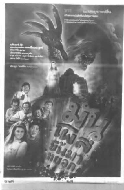
ภาพที่ 6.17 ตัวอย่างโทจน์สีในโปสเตอร์ภาพยนตร์ไทยแนวผี

โทจน์สีที่พบบ่อยในโปสเตอร์ภาพยนตร์ไทยแนวผี มักเน้นหนักโทจน์สีเย็นผสมกับสีเข้ม อาทิ สีดำ เป็นต้น ทั้งนี้เพื่อให้ได้สีที่มีลักษณะเหมือนกับบรรยากาศในตอนกลางคืน สีที่นิยมคือ สีด้าอมม่วง สีด้าอมเขียว เป็นต้น สีของโปสเตอร์ภาพยนตร์ไทยแนวผีมุ่งกระตุ้นให้เกิดความหวาดกลัวเป็นหลัก