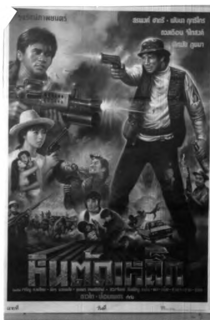
ภาพที่ 6.4 ตัวอย่างภาพเหตุการณ์ในโปสเตอร์ภาพยนตร์ไทยแนวบู๊

เหตุการณ์หลักในโปสเตอร์ภาพยนตร์ไทยแนวบู๊ คือ การต่อสู้ในทุกรูปแบบ ซึ่งมักจะมีมากกว่า 1 เหตุการณ์ ภาพที่ปรากฏส่วนมากเป็นการต่อสู้ของดาราชาย ทำให้ภาพเหตุการณ์ในโปสเตอร์ภาพยนตร์ไทยแนวนี้พบแต่ภาพของดาราชายมากกว่าดารานาง ดารานางที่ปรากฏในภาพเหตุการณ์ถ้าไม่ใช่ภาพนางเอกก็มักจะเป็นภาพของดาราประกอบหญิงที่รูปร่างดีมีลักษณะที่เข้ายวนทางเพศ ใส่เสื้อผ้าบางๆ หรือชุดที่เปิดไม่มีมิติจนเกือบโป๊หรือโป๊ ในบางครั้งอาจมีเพียงภาพactionที่เข้ายวน หรืออาจเป็นภาพเหตุการณ์กำลังเอนกอดรัดหรือยั่วยุเอนกอดกับดาราชาย ภาพที่แสดงการเข้ายวนทางเพศนี้พบประมาณ 80% ของโปสเตอร์ภาพยนตร์แนวนี้ นอกจากเหตุการณ์แสดงการต่อสู้แล้ว ในโปสเตอร์บางแผ่นอาจมีภาพการแสดงความรักระหว่างพระเอกกับนางเอก หรือพระเอกกับดารานางคนอื่นๆ ปรากฏอยู่ด้วย