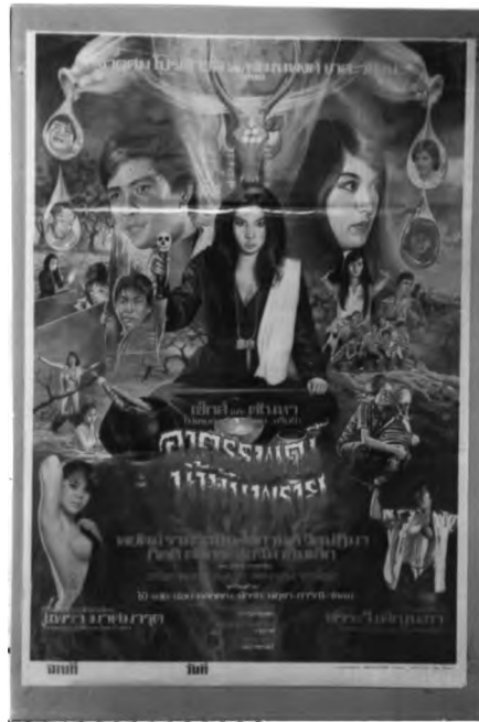
ภาพที่ 6.18 ตัวอย่างตัวอักษรในโปสเตอร์ภาพยนตร์ไทยแนวผี

ตัวอักษรของโปสเตอร์ภาพยนตร์ไทยแนวผี ประมาณ 90% เป็นตัวอักษรประดิษฐ์ มีลักษณะ เป็นคลื่นๆ ลื่นๆ เหมือนอาการของการกลัวจนตัวสั่น ในบางแผ่นมีลักษณะคล้ายกับ หยอดของน้ำเหลือง