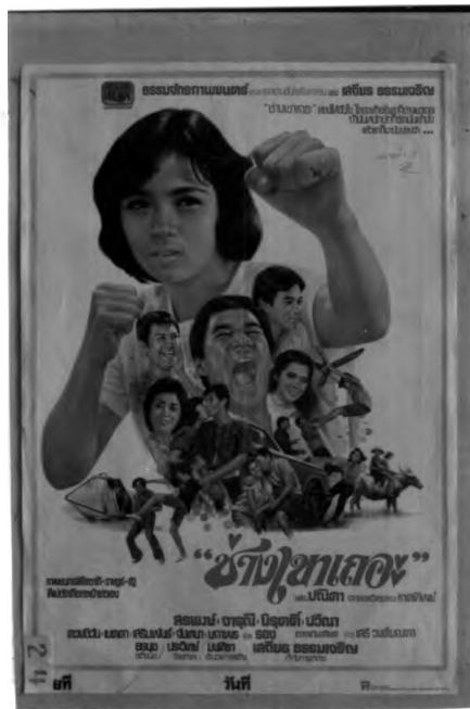
ภาพที่ 6.10 ตัวอย่างโทณสีในโปสเตอร์ภาพยนตร์ไทยแนวชีวิต

ประมาณ 90% ของโปสเตอร์ภาพยนตร์ไทยแนวชีวิต นั้นโทณสีเย็น ที่หล่อ เป็นสีร้อนที่ค่อนข้างสดใส ได้แก่ สีฟ้า, สีเทา, สีชมพู ฯลฯ โทณสีเย็นจะให้ความรู้สึก อ่อนนุ่ม เศร้า สดใส สบาย ฯลฯ ทั้งนี้ขึ้นอยู่กับว่าโปสเตอร์นี้ๆ จะให้เข้าหากับสีใดมากกว่า เพื่อให้เหมาะสมกับโทนของเรื่อง