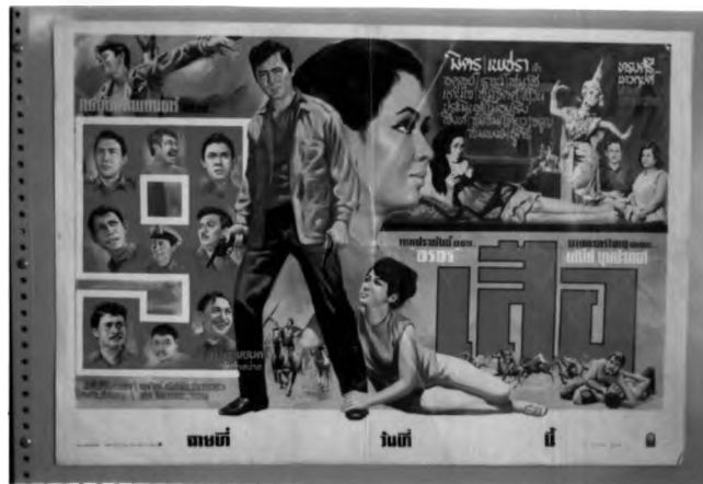
ภาพที่ 6.3 ตัวอย่างการจัดตำแหน่งดาราของโรงสตร์ภาพยนตร์ไทยแนวบู๊

(1.2) การจัดตำแหน่งของดารา ในโรงสตร์ภาพยนตร์ไทยแนวบู๊ โดยมากให้ความสำคัญกับตัวเอกที่เป็นผู้ชายมากกว่าตัวเอกที่เป็นผู้หญิง ภาพพระเอกมักจะมีขนาดใหญ่ เต็มตัว แสดงactionอย่างเด่นชัด ในขณะที่นางเอกมีเพียงใบหน้าหรือครึ่งตัว ขนาดเล็กกว่าแสดงactionที่แสดงความอ่อนแอ ต้องพึ่งพาและอยู่ในความดูแลของพระเอก ยกเว้นนางเอกในเรื่องที่ตัวเอกเป็นหญิงก็จะจัดตำแหน่งให้ดูเด่นกว่าพระเอก และมีactionที่ตรงกันข้ามกับนางเอกส่วนใหญ่ ส่วนดาราประกอบอื่นๆ มักจะจัดให้อยู่ในภาพเหตุการณ์หรือแยกให้เห็นอย่างเด่นชัดด้วยกรอบเล็กๆ ที่เน้นเพียงใบหน้า