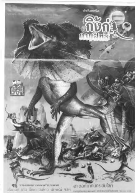
ฉายที่ ..... วันที่ .....

โทนสีและตัวอักษรของโปสเตอร์ภาพยนตร์ไทยแนวนี้มีความหลากหลาย ขึ้นอยู่กับว่าเนื้อเรื่องหลักเป็นอย่างไร หากเน้นการต่อสู้แบบจีนโบราณก็มักจะใช้ตัวอักษรลักษณะเดียวกับแนวบู๊ หากเน้นความสนุกสนานผสมจินตนาการสีลันจะสดใส ตัวอักษรจะถูกทำให้แปลกตา แต่ถ้าหากเป็นเนื้อเรื่องที่เกี่ยวข้องกับนิทานพื้นบ้าน วรรณคดี โทนสีมักเน้นสีเขียว