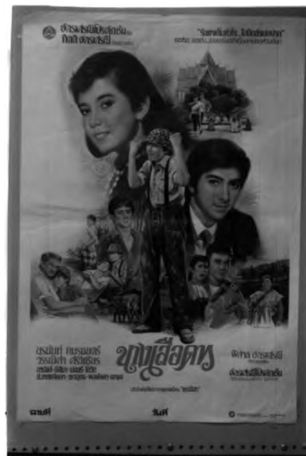
actionที่แสดงความกำกวม