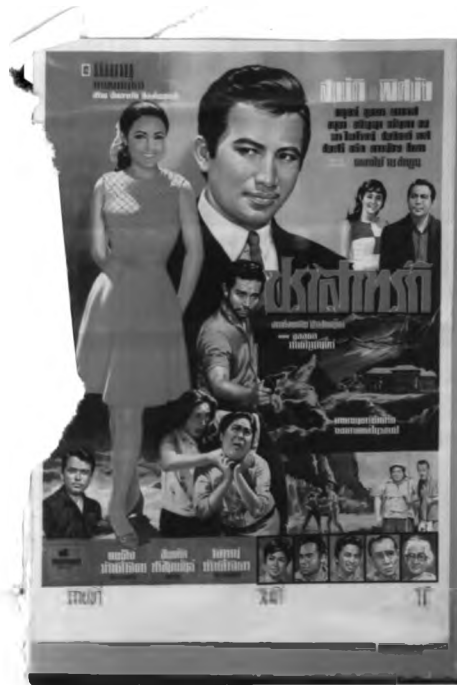
actionที่แสดงถึงความสุข