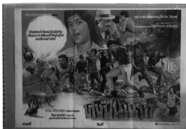
ภาพที่ 6.5 ตัวอย่างโปสเตอร์ภาพยนตร์ไทยที่เน้นหนักโทนีสีร้อน

โทนีสีที่พบในโปสเตอร์ภาพยนตร์แนวบู๊แอ็กชันมักจะเป็นโทนีสีร้อน (67.4%) โดยเฉพาะ สีแดงและสีเหลือง ในช่วงปีพ.ศ.2520 เป็นต้นมา โทนีสีร้อนในโปสเตอร์ภาพยนตร์ไทยแนวนี้ จะมีการใช้ที่เด่นชัดมากขึ้นเรื่อยๆ ส่วนโทนีสีเย็นผสมโทนีสีร้อนมีประมาณ 32.6% มีคละเคล้ากับโทนีสีร้อน โทนีสีลักษณะดังกล่าวคือช่วงก่อนหน้าปีพ.ศ.2520 สาเหตุที่โปสเตอร์ภาพยนตร์แนวนี้นิยมโทนีสีร้อนโดยเฉพาะสีแดงเพราะเป็นสีที่แสดงถึงความรุนแรง ความดุเดือด และความร้อนแรงของอารมณ์ รวมไปถึงแสดงถึงสภาพการต่อสู้ด้วย