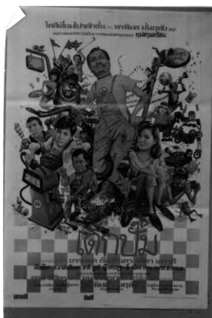
ภาพที่ 6.13 ตัวอย่างเหตุการณ์ในโปสเตอร์ภาพยนตร์ไทยแนวตลก

ในระยะหลังๆ ตั้งแต่ปีพ.ศ.2530 เป็นต้นมา จะพบว่าเหตุการณ์ในโปสเตอร์ภาพยนตร์ตลกจะไม่มีหน้าแน่นเหมือนในอดีต ส่วนมากมักเน้นที่actionของดารา