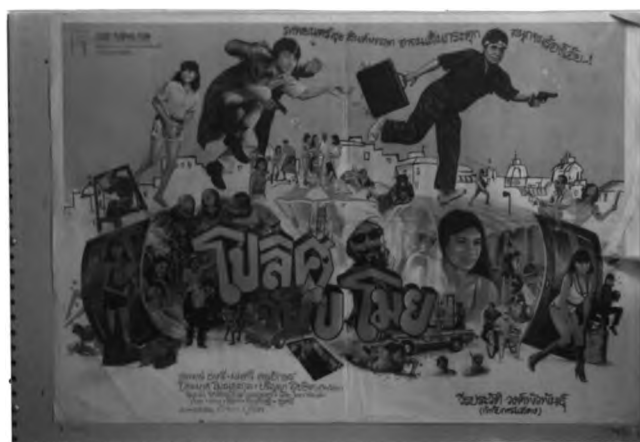
ภาพที่ 6.14 ตัวอย่างการใช้โทนสีและตัวอักษรในโปสเตอร์ภาพยนตร์ไทยแนวตลก

ตัวอักษรของโปสเตอร์ภาพยนตร์ไทยแนวตลกนิยมประดิษฐ์เป็นรูปลักษณะที่แปลกตาประมาณ 90% ประดิษฐ์ตัวอักษรและใช้ตัวอักษรแบบเขียนด้วยลายมือ ที่เหลือ 10% ใช้ตัวอักษรแบบตัวพิมพ์ โดยอาจมีการพลิกแพลงรูปแบบบ้าง เช่น จัดวางให้กลับหัว ใช้ภาพวาดอื่นๆ มาผสมคั่นอยู่ หรือสลับสีในแต่ละตัวอักษร