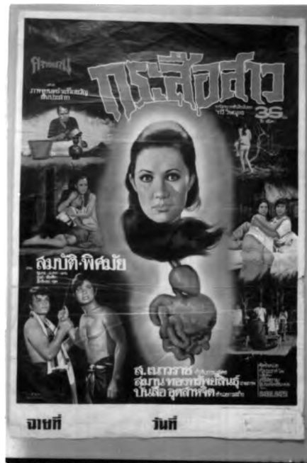
ภาพที่ 6.16 ตัวอย่างภาพเหตุการณ์ในโปสเตอร์ภาพยนตร์ไทยแนวผี

เหตุการณ์ในโปสเตอร์ภาพยนตร์ไทยแนวผี ประกอบด้วยเหตุการณ์ดังนี้คือ การบริการมดคาถาของผู้ที่มากำจัดสิ่งที่ไม่ดีให้เกิดความไม่สงบซึ่งก็คือภูติผีปีศาจนั่นเอง ภาพแสดงการวิ่งหนีของดาราประกอบ ภาพแสดงการจับกลุ่มเพื่อหลบหนีสิ่งน่ากลัว ภาพของป่าช้า หรือสถานที่ที่ภูติผีปีศาจอาศัยอยู่หรืออุบัติขึ้น เป็นต้น