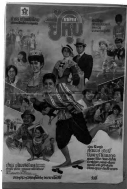
ภาพที่ 6.12 ตัวอย่างการแสดงactionและเครื่องแต่งกายในโบสเตอร์ภาพยนตร์ไทยแนวตลก

(1.2) เครื่องแต่งกายของดารา คือ เสื้อผ้าที่ดารานำแสดงสวมใส่ โดยมากมักพยายามนำเสนอภาพที่ดาราสวมเครื่องแต่งกายที่แปลกตา หรือสวมเครื่องแต่งกายกับสิ่งประกอบให้ดูขัดกันเพื่อความขบขัน