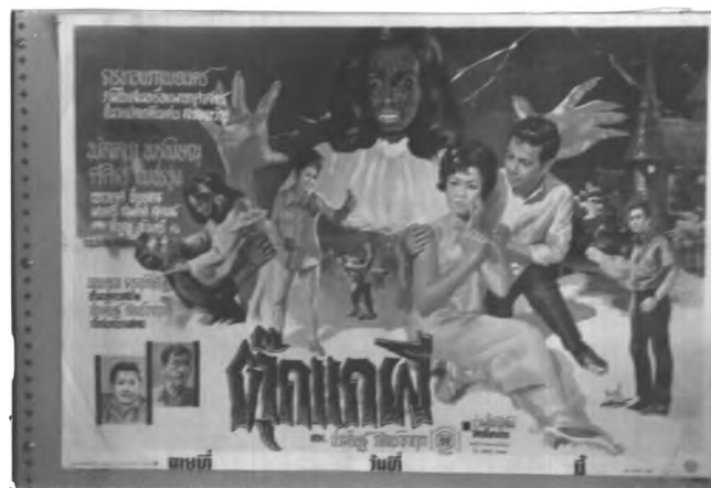
ภาพที่ 6.15 ตัวอย่างactionของดารานในโบสเตอร์ภาพยนตร์ไทยแนวผี

1.1.2 action ของดารา ในกรณีที่เป็นผู้ถูกกระทำ action จะมีลักษณะดังนี้ มีท่าทางหวาดกลัวทั้งใบหน้าและการกระทำ ซึ่งมีทั้งหวาดกลัวเพียงคนเดียวหรือท่าทางหวาดกลัวเป็นคู่ระหว่างพระเอกกับนางเอก บางครั้งอาจเป็นเพียงใบหน้าที่ยิ้มเฉยทั้งนี้ขึ้นอยู่กับความน่ากลัวและเหตุการณ์อื่นๆ ที่นำมาประกอบ