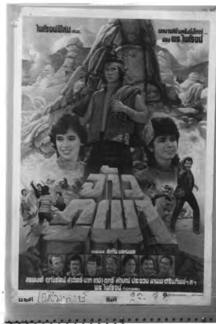
ภาพที่ 6.6 ตัวอย่างโปสเตอร์ภาพยนตร์ไทยแนวบู๊ที่แสดงลักษณะตัวอักษร

ตัวอักษรของโปสเตอร์ภาพยนตร์แนวบู๊ ประมาณ 85% มีลักษณะเหลี่ยมหนา เหมือนตัวพิมพ์ ที่เหลือ 15% เป็นตัวอักษรที่มีลักษณะเหมือนกับตัวอักษรประดิษฐ์ ซึ่งอาจประดิษฐ์ให้เหมาะสมกับชื่อเรื่องก็ได้ แต่ไม่ว่าจะเป็นตัวอักษรลักษณะใดเมื่อมองโดยภาพรวม จะเห็นว่าตัวอักษรของโปสเตอร์ภาพยนตร์แนวบู๊จะให้ความรู้สึกถึงความหนักแน่น ความมั่นคงและความเข้มแข็ง