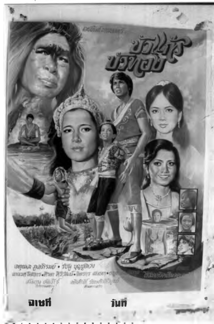
..... ภาพที่ 6.22 ตัวอย่างภาพเหตุการณ์ในโปสเตอร์ภาพยนตร์ไทยแนวอื่นๆ

เหตุการณ์ในโปสเตอร์ภาพยนตร์แนวนี้มีหลายเหตุการณ์ขึ้นอยู่กับเนื้อเรื่อง อาทิ หากเป็นเรื่องที่เกี่ยวกับนิทานพื้นบ้าน ก็มักเป็นภาพเหตุการณ์ที่เกี่ยวกับความรัก หรือเหตุการณ์เด่นๆ ที่เป็นที่รู้จักกันทั่วไป หากเป็นเรื่องที่นำเอาเนื้อเรื่องจากต่างประเทศเข้ามาผสมผสาน ก็จะเน้นเหตุการณ์ที่เกี่ยวกับเนื้อเรื่องจากต่างประเทศมากกว่าของไทย