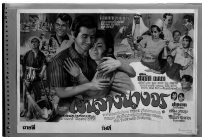
ภาพที่ 6.9 ตัวอย่างเหตุการณ์ในโปสเตอร์ภาพยนตร์ไทยแนวชีวิต

เหตุการณ์ในโปสเตอร์ภาพยนตร์ไทยแนวชีวิต ประกอบด้วยเหตุการณ์หลากหลายรูปแบบที่นิยมเรียกกันโดยทั่วไปว่า "ครบรส" กล่าวคือ ไม่เน้นหนักไปทางด้านใดด้านหนึ่งมากเกินไป ทั้งเหตุการณ์ที่แสดงถึงความสนุกสนานร่าเริง การแสดงความรัก เหตุการณ์วาทกรรม อารมณ์ การต่อสู้ที่ไม่รุนแรง ความโรครักเสรั้า การหยอกเย้า เป็นต้น เหตุการณ์ในโปสเตอร์ภาพยนตร์ไทยแนวชีวิตมักไม่มุ่งเน้นความรุนแรง แต่จะกระตุ้นให้เกิดความรู้สึกสะเทือนอารมณ์มากกว่า