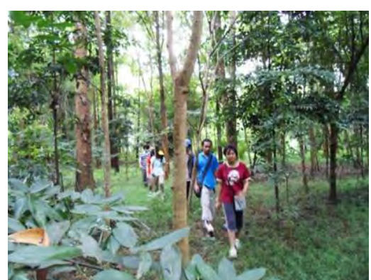
พากันเดินลัดเลาะภายในสวนป่า