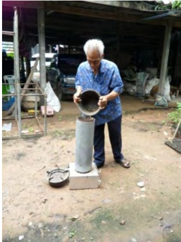
พ่อวิจิตสาธิตเตาพลังงานทดแทนที่ประดิษฐ์ขึ้น