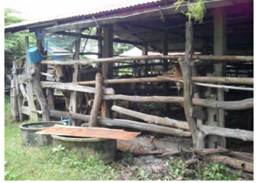
คอกเลี้ยงวัวของแม่สอั้ง