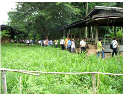
คณะครูเดินลัดเลาะเพื่อเยี่ยมชมกิจกรรมของ ศูนย์การเรียนรู้มหาชีวาลัยอีสาน