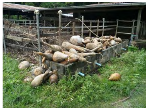
ลูกน้ำเต้าถูกนำมาวางก่อนการทำความสะอาด