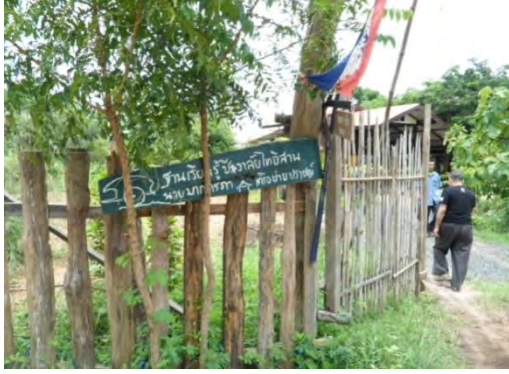
ฐานการเรียนรู้มหาชีวาลัยอีสาน ต.หายโศก อ.พุทไธสง จ.บุรีรัมย์