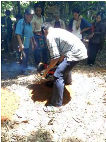
ชาวบ้านชมการสาธิตวิธีการเจาะ