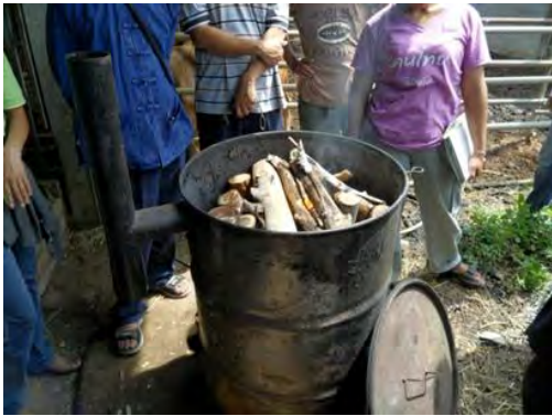
การนำไม้มาเผาเพื่อสกัดออกมาเป็นน้ำส้มควันไม้สำหรับ เป็นสารบำรุงดินและสารกำจัดศัตรูพืชและแมลง