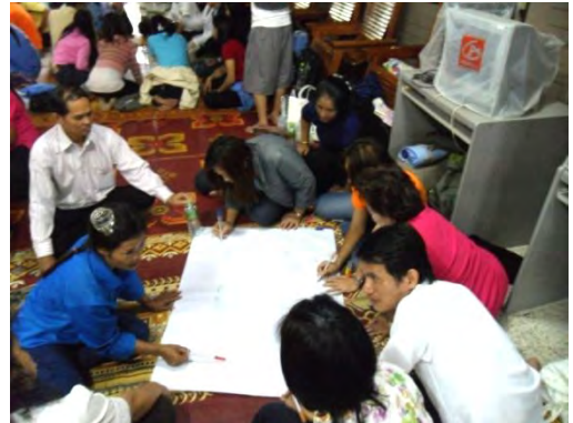
คณะครูกำลังปรึกษาหารือกันก่อนลงมือเขียน แผนผังความคิด