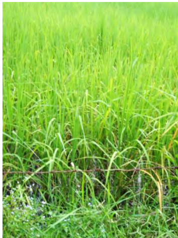
แปลงปลูกข้าวที่ใช้ปุ๋ยเคมี