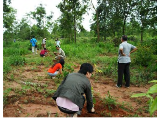
ขมุกเขมนร่วมมือร่วมใจกันปลูกต้นหยีน้ำ ที่ครูบาสุทธินันท์ได้มา