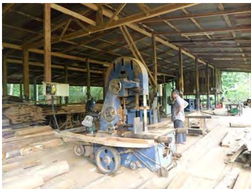
โรงเลื่อยไม้ภายในศูนย์มหาวิทยาลัยอีสาน