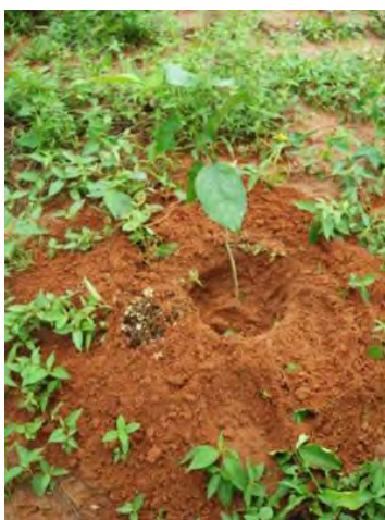
การปลูกต้นหยีน้าโดยใช้อุปกรณ์เครื่องเจาะชุดดิน