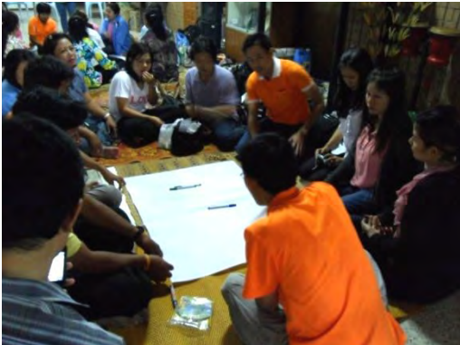
การแบ่งกลุ่มย่อยเพื่อแลกเปลี่ยนความคิด