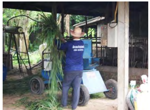
สาธิตการบดใบไม้เพื่อนำมาเลี้ยงวัว