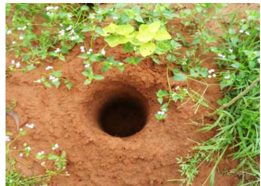
หลุมที่ขุดโดยเครื่องเจาะ