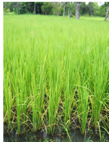
แปลงปลูกข้าวที่ใช้ปุ๋ยอินทรีย์ของสมาชิกเครือข่าย มหาชีวาลัยอีสานลำต้นข้าวจะแข็งแรง