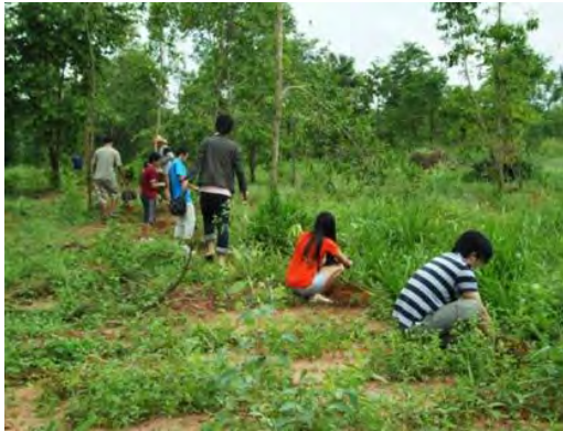
ร่วมด้วยช่วยกันปลูกต้นไม้ที่ครูบาสุทธินันท์เตรียมไว้ให้