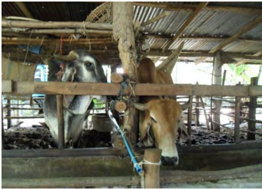
วัวพันธุ์บราห์มัน