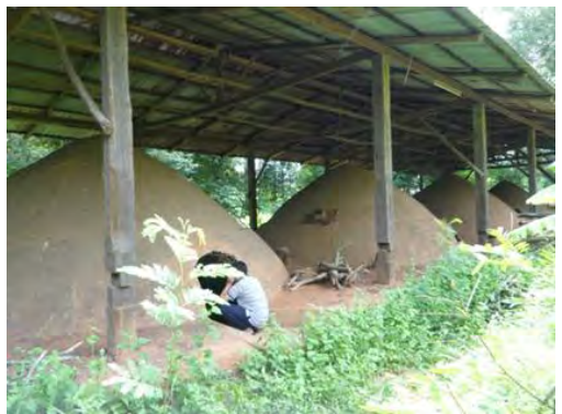
เตาเผาถ่านทำจากอิฐมวลและดินเหนียว