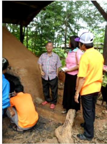
อธิบายเตาเผาถ่านภายในศูนย์การเรียนรู้ มหาชีวาลัยอีสานกับคณะครู