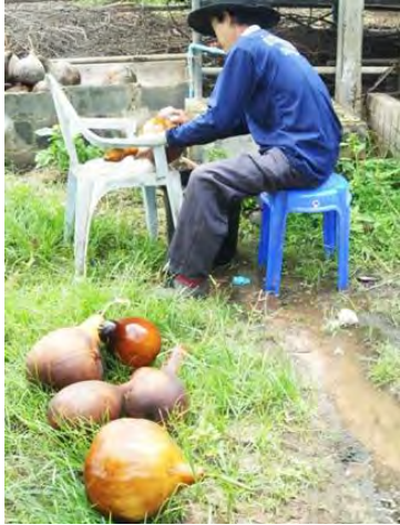
ระหว่างทำความสะอาดลูกน้ำเต้า