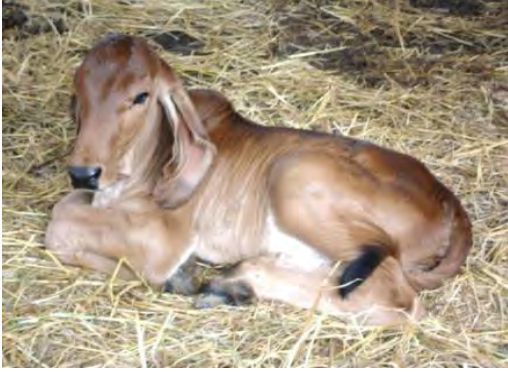
ลูกวัวพันธุ์ผสมชาโดเลสส์กับบารห์มันที่ฟักคลอดได้ 2 วัน