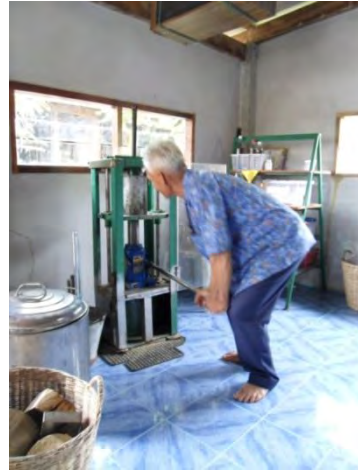
พ่อวิจิตสาธิตเครื่องสกัดน้ำมันที่ประดิษฐ์ขึ้น