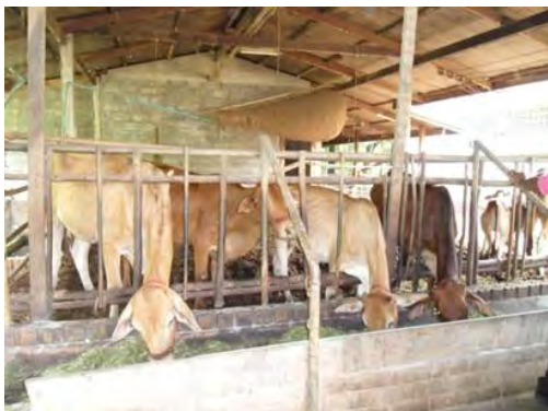
การเลี้ยงวัวพันธุ์ชาโลเลส์และพันธุ์ชาฮิวาล