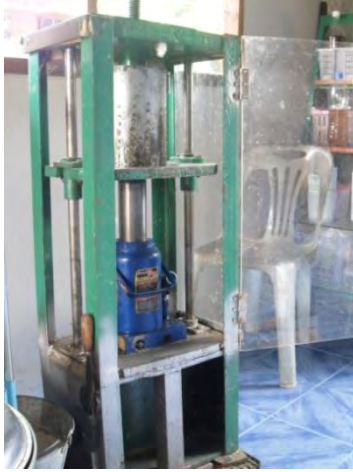
การประดิษฐ์เครื่องสกัดน้ำมันโดยพ่อวิจิต แกนนำเครือข่ายมหาชีวลัยอีสาน