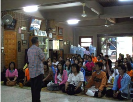
คณะครูจากโรงเรียนเทศบาลบูรพาพิทยาคม จ.มหาสารคาม