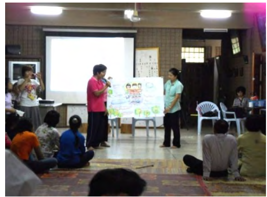
นำเสนอแผนผังความคิดในหัวข้อ “โรงเรียนแห่งความสุข”