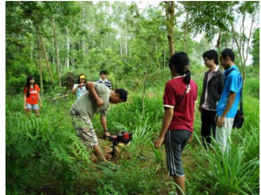
พี่ SCG กำลังทดลองใช้เครื่องชุด