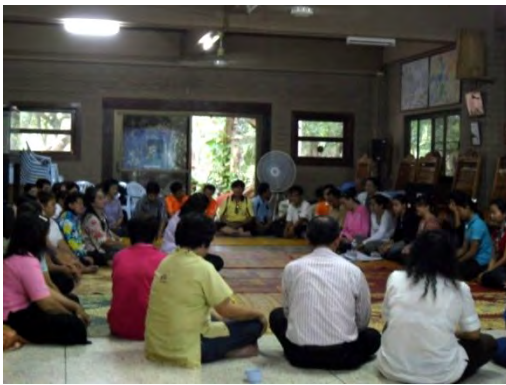
คณะครูร่วมแลกเปลี่ยนประสบการณ์หลังการเยี่ยมชม กิจกรรมของศูนย์การเรียนรู้มหาชีวาลัยอีสาน