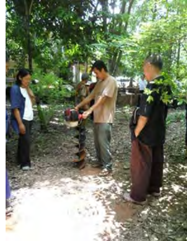
การสาธิตเครื่องเจาะชุดดินซึ่งเป็นเทคโนโลยีสมัยใหม่มาใช้ให้เหมาะกับการทำเกษตร