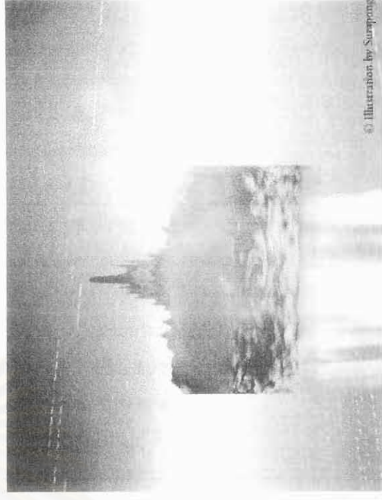
Illustration by Surapong