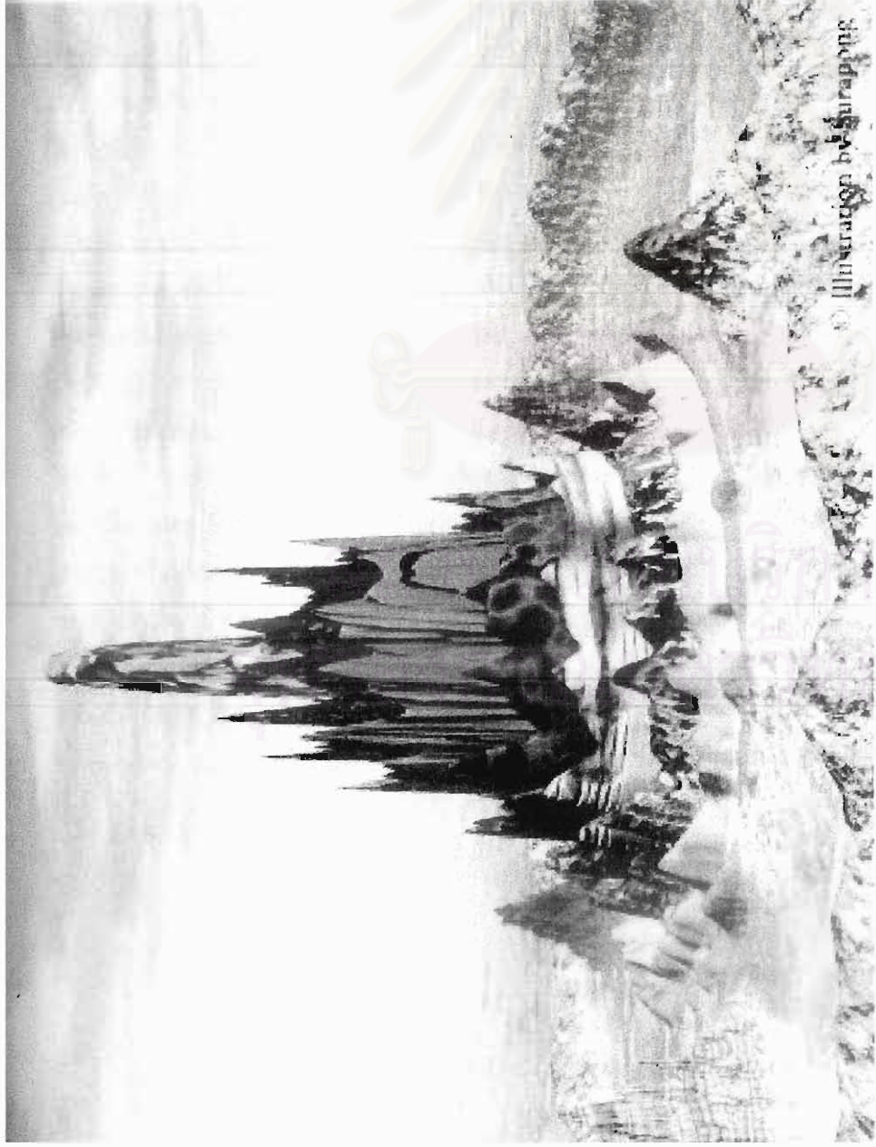
Illustration by Surapong Jankasamepong in KPT Bryce2 & Photoshop 4.0