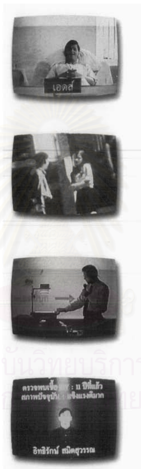
ภาพยนตร์โฆษณาเรื่องที่ 1 "หวัง"