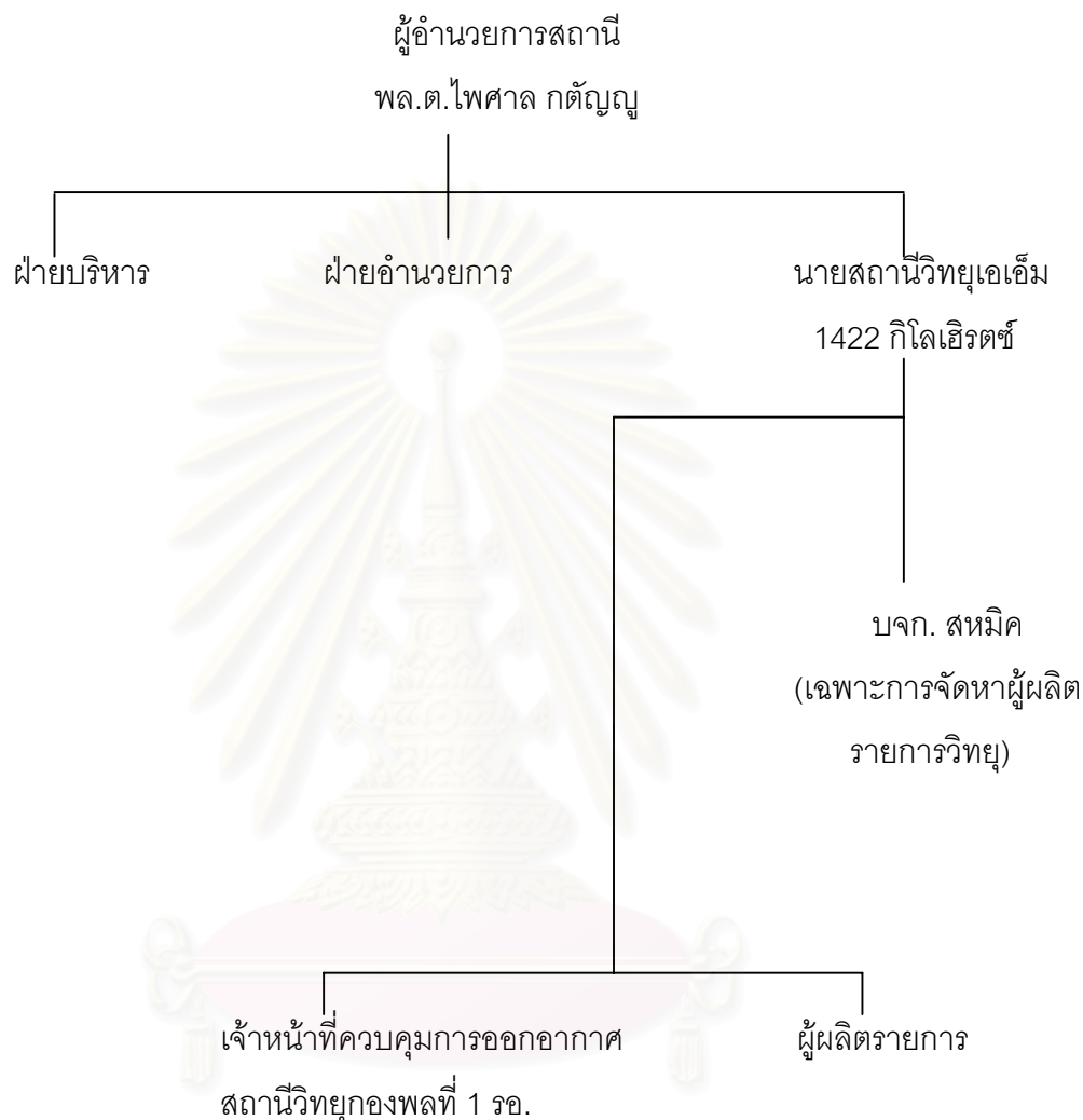
ภาพที่ 2 โครงสร้างของสถานีวิทยุเพื่อพระพุทธศาสนาธรรมะพล 1

จากแผนภาพแสดงให้เห็นว่าสถานีวิทยุเพื่อพระพุทธศาสนาธรรมะพล 1 อยู่ภายใต้โครงสร้างของสถานีวิทยุของพลที่ 1 รักษาพระองค์ โดยในการบริหารงานจัดการรายการบริษัท สหมีค มีเดีย จำกัด มีหน้าที่จัดหาผู้ผลิตรายการ จัดหา ติดต่อผู้ซื้อเวลาลงโฆษณาแก่สถานีวิทยุเท่านั้น หากได้เข้ามาเกี่ยวข้องการบริหารงานส่วนอื่นแต่อย่างใด ส่วนผู้ผลิตรายการอยู่ในการดูแลของสถานีวิทยุเพื่อพระพุทธศาสนาธรรมะพล 1 และกรมประชาสัมพันธ์ในด้านเนื้อหาให้ถูกต้องตามหลักพระไตรปิฎกแต่เพียงอย่างเดียว วงเวียนการเรียกรายการวิทยุ แต่สถานีวิทยุจะไม่เข้าไปเกี่ยว