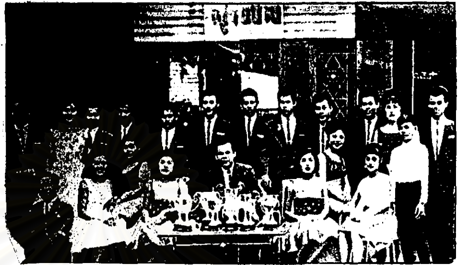
ที่มา : เจนภพ จภกระบวนวรรณ, "ผลพวงจากงานนิทรรศการ 19 ปีสุรพล สมบัติเจริญ." ถนนคนตรี 1,12(ตุลาคม 2530)