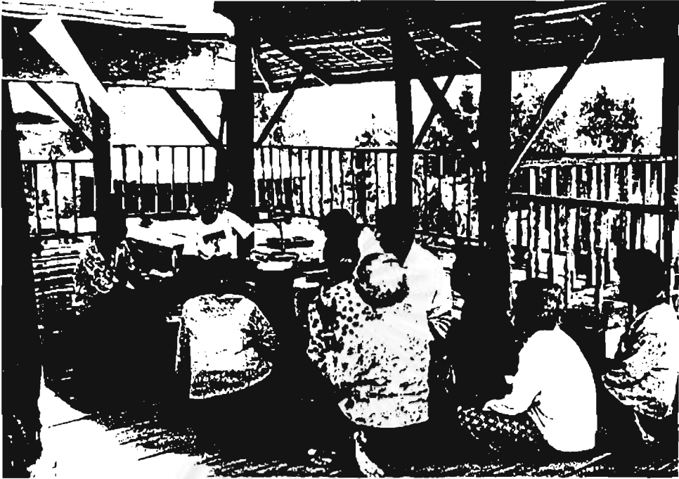
ศึกษาอูงาน