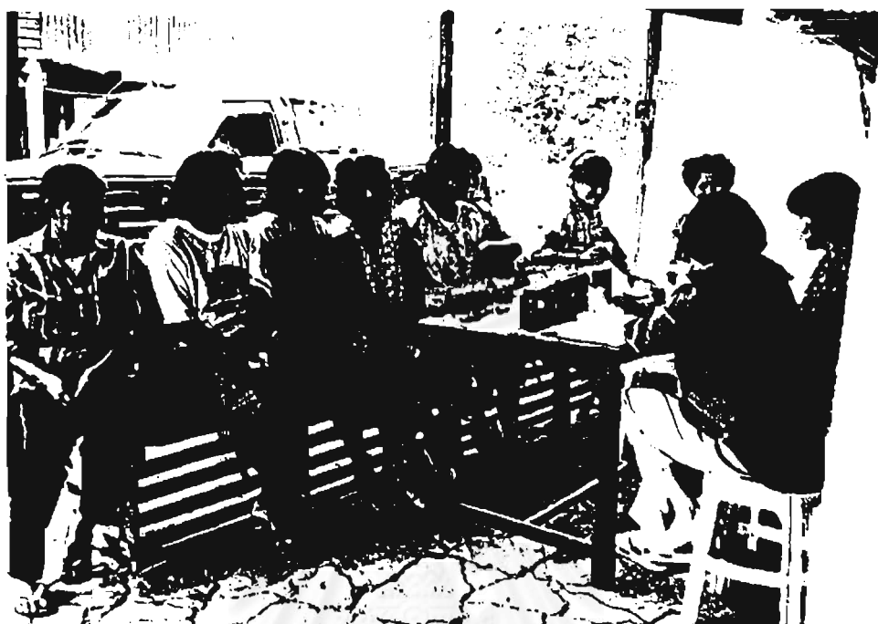
สมทนากตุ้ม