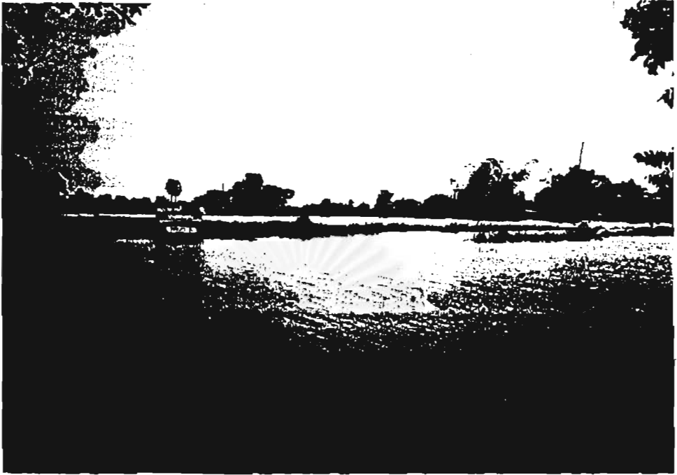
สภาพโครงสร้างพื้นฐาน