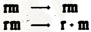
รูปที่ 1.6 แสดงรูปที่ได้จากการตัดแยกตัวอักษรแบบ Dissection