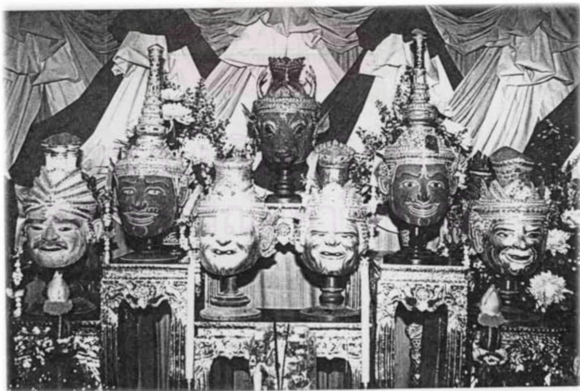
พระปรกณธรรท พระดาบิ