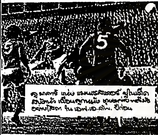
ลูกศรชี้ ผู้เล่นหมายเลข ๕ ในทีม สโมสรฟุตบอลโอลิมปิก ซึ่งกำลัง ยิงประตูในเอฟ.ไอ.เอฟ. โอลิมปิก

เหลือเวลาอีกเพียง ๑ วัน ก็จะถึงวาระการฟาดแข้ง เอฟ.ไอ.เอฟ. รอบที่ หกคนรอบคอบ...๒๕ มกราคม ๒๒ ทีม ถูกแบ่งตั้งแต่ว่าวัน ๑ ไปจนถึง วันวัน ๕ ตลอดจนทีม ทีมแรก จะลงสนามหกคนให้กระชวยไปข้างหนึ่ง และหก จากนั้น ๑๖ ทีมที่เหลือจะทยอย เป็นบันไดโถง ๑๖ ทีมซึ่งจะ เข้าเข้าสู่อีก เอฟ.ไอ.เอฟ. รอบที่ ห้าต่อไป