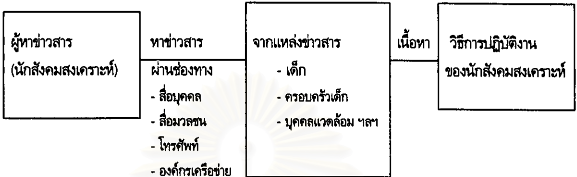
ภาพที่ 3 แสดงถึงความสัมพันธ์ขององค์ประกอบในกระบวนการแสวงหาข้อมูลข่าวสารของนักสังคมสงเคราะห์ในการช่วยเหลือเด็กที่ถูกทารุณกรรม

สำหรับรายละเอียดการแสวงหาข้อมูลข่าวสารของนักสังคมสงเคราะห์นั้น กลุ่มตัวอย่างได้แสดงความคิดเห็นที่สอดคล้องกับที่กล่าวไว้ในส่วนที่ 2.2 ว่าการรับแจ้งข้อมูลข่าวสารในเบื้องต้นจะรับทราบจากสื่อมวลชนและสื่อบุคคล ซึ่งจากการศึกษาสามารถสรุปขั้นตอนและกระบวนการแสวงหาข่าวสารของนักสังคมสงเคราะห์ เป็น 2 ขั้นตอน คือ