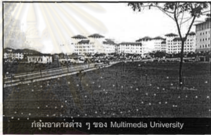
กลุ่มอาคารต่าง ๆ ของ Multimedia University

Multimedia University (เดิมเป็นที่รู้จักกันในชื่อ Universiti Telekom) ตั้งอยู่ภายใน Cyberjaya บทบาทที่สำคัญของมหาวิทยาลัยคือ การสนับสนุนการเจริญเติบโตและความสำเร็จของ The Multimedia Super Corridor Project โดยเน้นการผลิตนักศึกษาที่มีความรู้ ความเชี่ยวชาญในสาขามัลติมีเดียและเทคโนโลยีขั้นสูง เปิดรับนักศึกษาในระดับปริญญาตรีและปริญญาโท ตั้งแต่ปี 1999 เป็นต้นมา ประกอบด้วย 4 คณะ คือ Faculty of Creative Multimedia, Faculty of Engineers, Faculty of Information Technology และ Faculty of