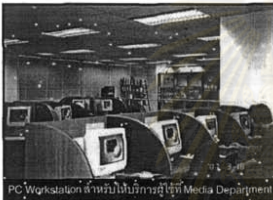
PC Workstation สำหรับให้บริการผู้ใช้ Media Department

1. ให้บริการสืบค้นข้อมูลข้อมูล โดยมีคอมพิวเตอร์จำนวน 30 เครื่อง เป็นเครือข่ายที่ควบคุมจากคอมพิวเตอร์ที่ทำหน้าที่เป็นเซิร์ฟเวอร์ที่เคาน์เตอร์เจ้าหน้าที่ห้องสมุด ทำให้เจ้าหน้าที่สามารถทราบว่ามีเครื่องใด กำลังใช้งานอะไรอยู่ เจ้าหน้าที่สามารถส่งข้อความไปเตือนผู้ใช้ได้ทันที หากพบว่ามีการใช้งานที่ไม่