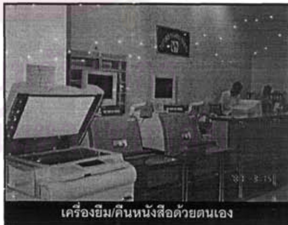
เครื่องยืม/คืนหนังสือด้วยตนเอง