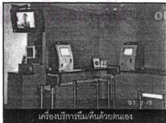
เครื่องบริการยืม/คืนด้วยตนเอง