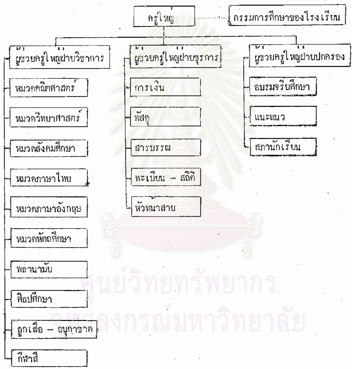
ภาพประกอบที่ 1 แสดงแผนภูมิการบริหารงานภายในโรงเรียนประถมศึกษา ที่จัดระบบสายงานบังคับบัญชาเป็นเกณฑ์*