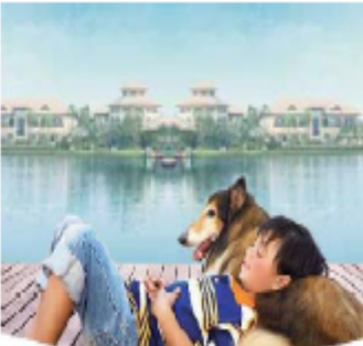
โทร. 1375 กดปุ่ม 1