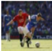
ลาธานท์เหมือนปลัดึงบอลถั่ว