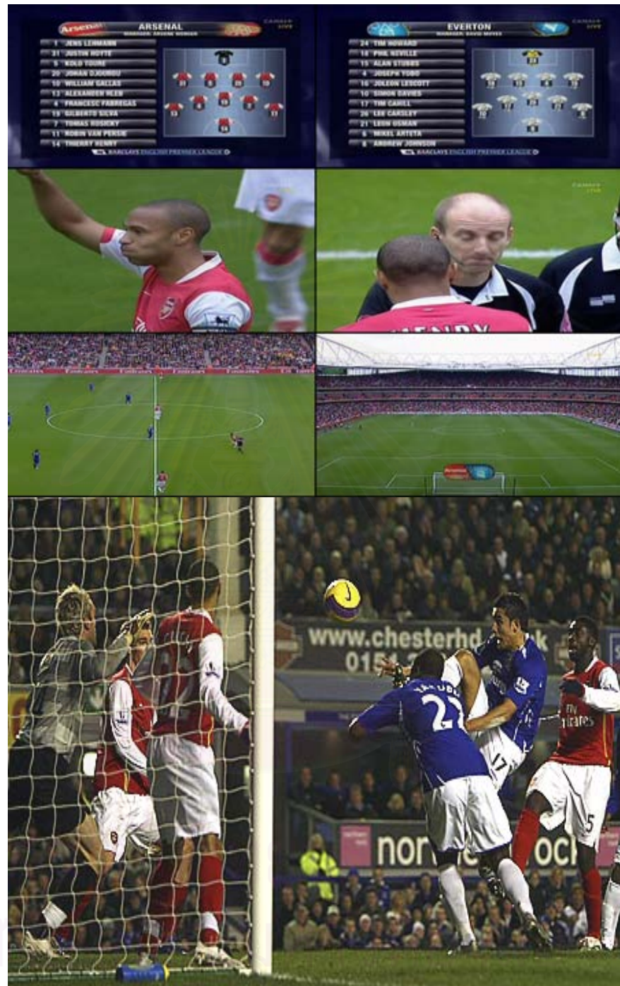
ตัวอย่าง ภาพเหตุการณ์การแข่งขันที่ผู้ประกาศข่าวรายงาน ประจำวันจันทร์ที่ 5 พฤษภาคม 2551