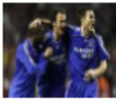
เชลซี ต้องหนักกำลัง