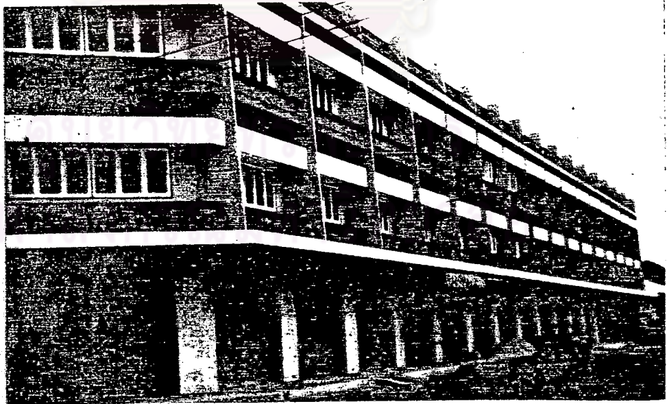
ลักษณะของอาคารพักอาศัยแบบใหม่ ใช้ประกอบธุรกิจและการค้าด้วย ถนนรามวิถี