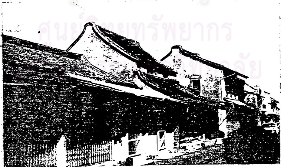
สภาพอาคารพักอาศัยบริเวณถนนนครนอก นครใน ของเมืองสงขลา