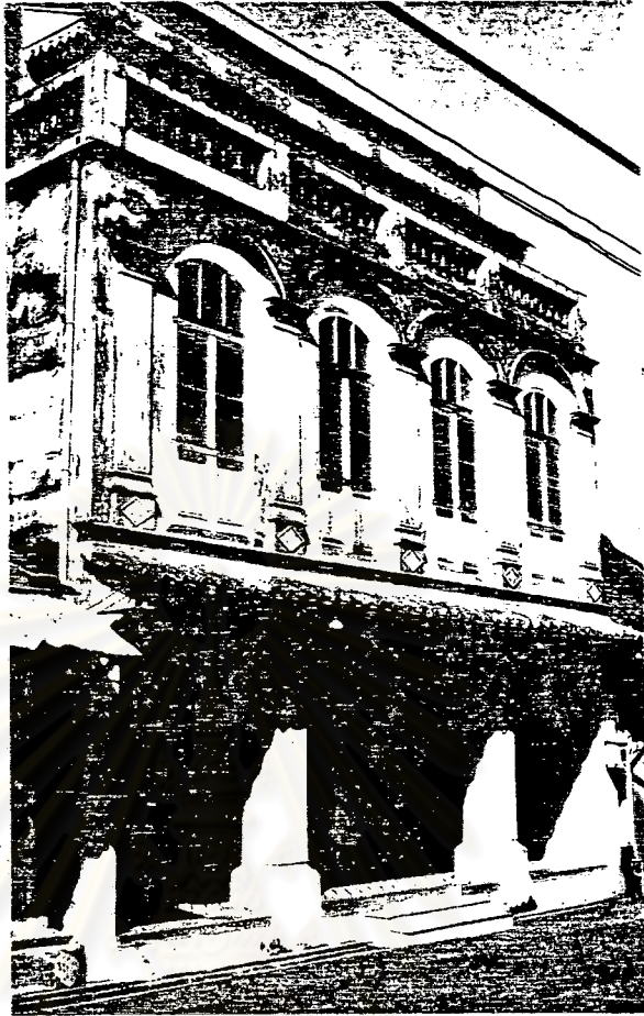
ลักษณะของอาคารพักอาศัยแบบเก่า บริเวณถนนนครนอก นครใน