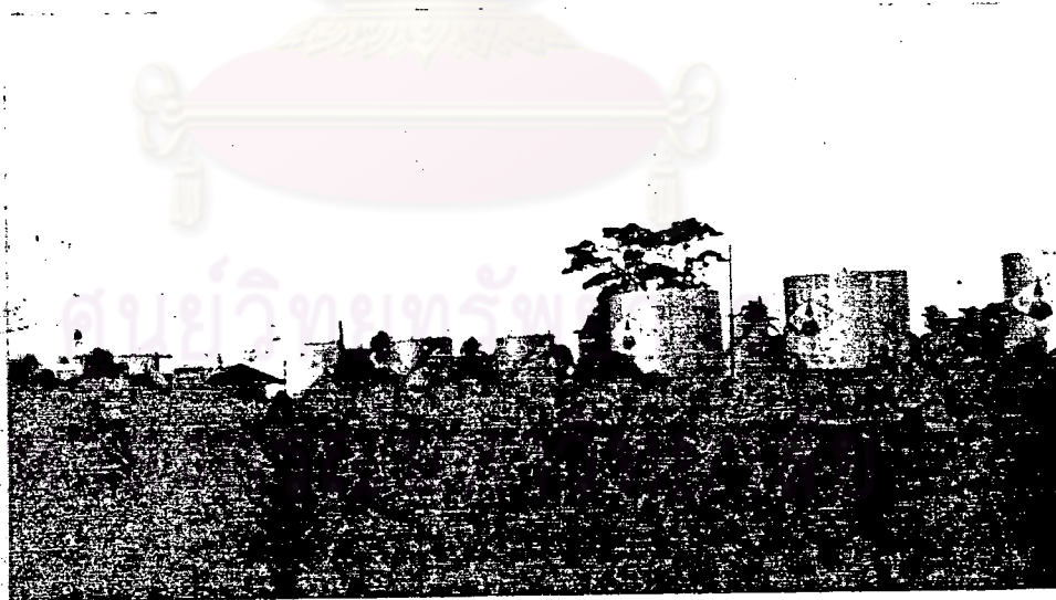
คลังน้ำมันในใจกลางเมือง ใกล้สถานีรถไฟซึ่งปัจจุบันเลิกดำเนินการแล้ว