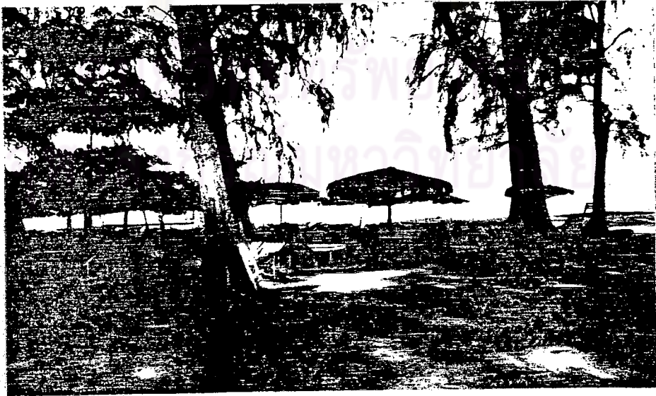
สถานที่พักผ่อนหย่อนใจ "แหลมสมิหลา" ชั้นลือชื่อของเมืองสงขลา