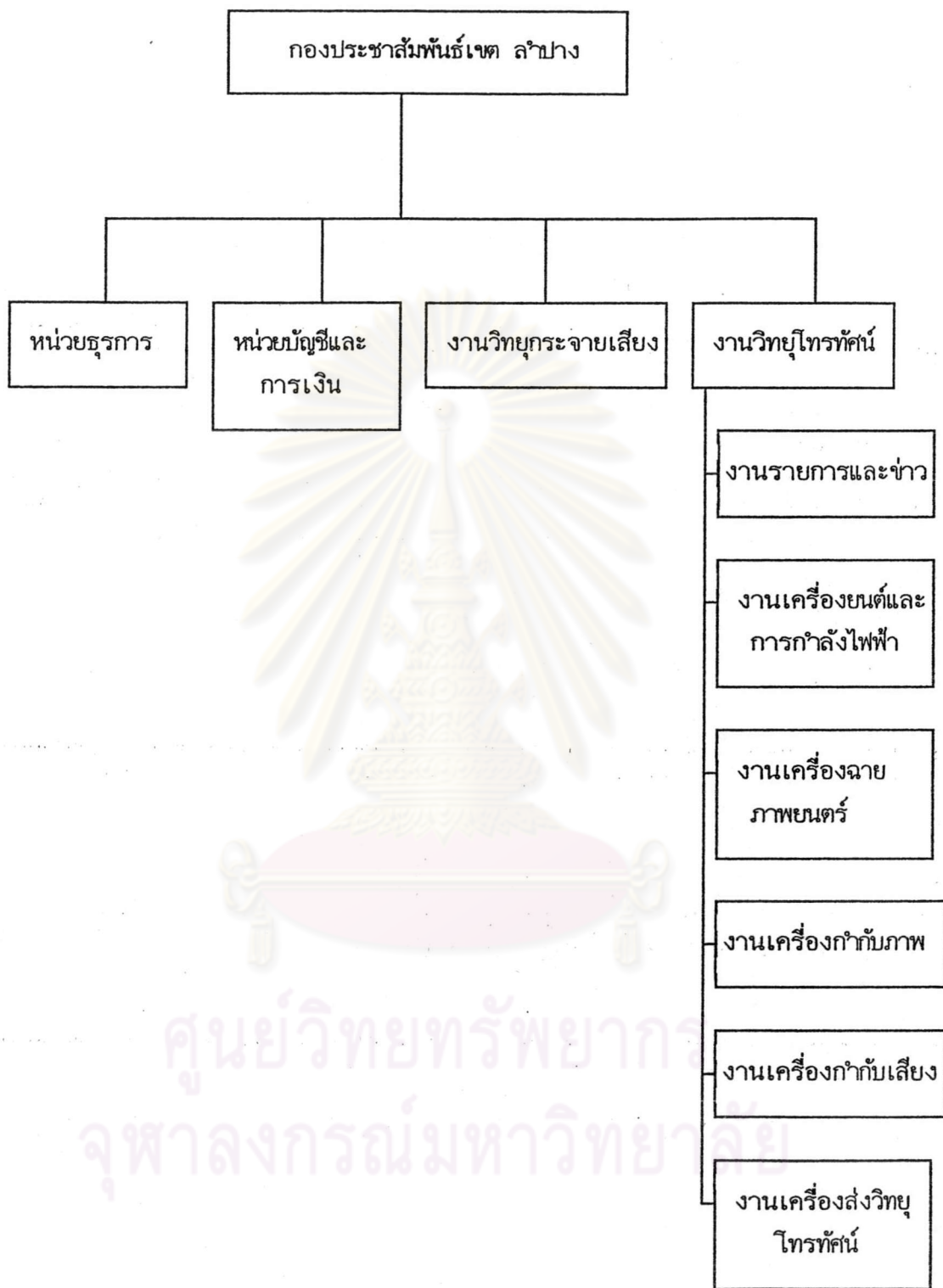
แผนภูมิที่ 4 แสดงการแบ่งส่วนงานของกองประชาสัมพันธ์เขต ลำปาง (พ.ศ.2512 - พ.ศ. 2518)