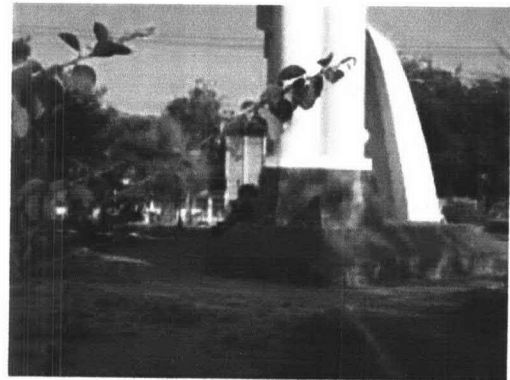
ภาพที่ 6-1 พื้นที่ที่มีร่มเงาภายในสวนบึงแก่นนคร ภาพที่ 6-2 พื้นที่ที่มีร่มเงาภายในสวนรัชดานุสรณ์