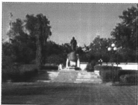
ภาพที่ 6-8 อนุสาวรีย์จอมพลสฤษดิ์ ภายในสวนรัชดานุสรณ์