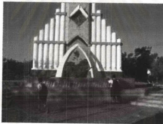
ภาพที่ 6-3 การใช้พื้นที่ภายในสวนรัชดานุสรณ์