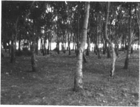
ภาพที่ 6-4 พื้นที่ต้นไม้ที่บภายใน สวนบึงแก่นนคร