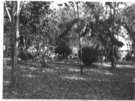
ภาพที่ 6-5 พื้นที่ที่ถูกทิ้งร้างภายใน สวนรัชดานุสรณ์