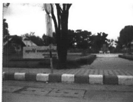
ภาพที่ 6-9 อนุสาวรีย์พระนครศรีบริรักษ์ ภายในสวนบึงแก่นนคร