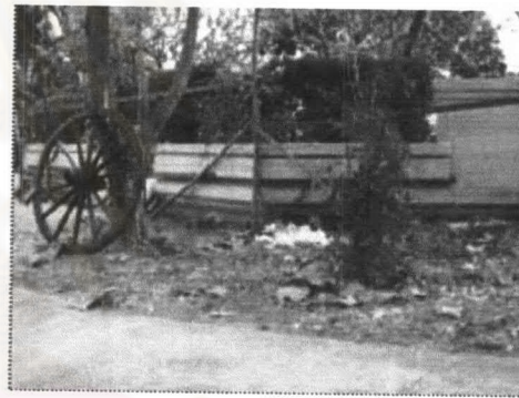
ภาพที่ 6-7 พื้นที่ทิ้งขยะและสกปรกภายใน สวนรัชดานุสรณ์