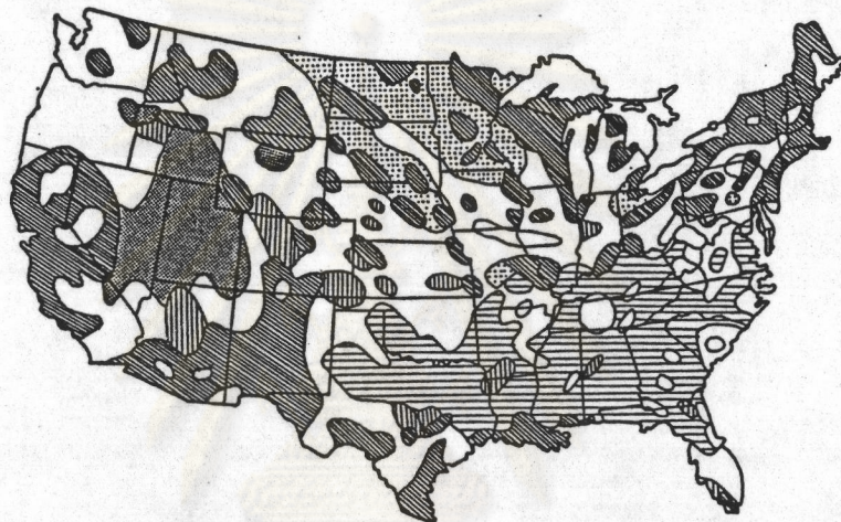
แผนที่ 2.1 แสดงการกระจายของกลุ่มนิกายศาสนาคริสต์ ในสหรัฐอเมริกา