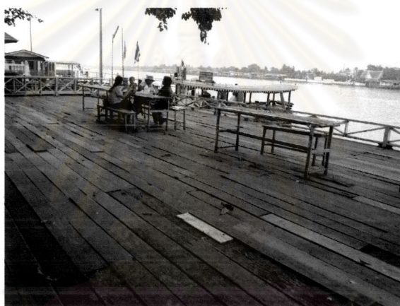
ภาพที่ 5.9 บริเวณพื้นที่ว่างริมน้ำสำหรับพักผ่อนหย่อนใจในชุมชนเกาะเกร็ด

8) ปรับปรุงบริเวณพื้นที่เปิดโล่งบริเวณริมน้ำเพื่อเปิดทัศนวิสัยบริเวณที่มีคุณค่าและความสำคัญทางสภาพแวดล้อม รวมถึงการจัดหาพื้นที่ลานโล่งเพื่อทำกิจกรรมร่วมกันในชุมชน