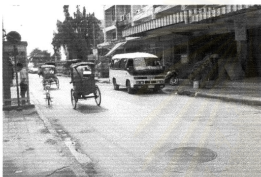
ภาพที่ 5.1 บริเวณทางเข้าชุมชนเมืองพื้งบก

1) การปรับปรุงสภาพถนนทางเข้าชุมชน ที่เชื่อมโยงกับถนนสายหลักแจ้งวัฒนะ ที่จุดรถบริเวณชุมชนเมืองในเขตเทศบาลนครปากเกร็ด และสภาพถนนทางเดินเท้าในชุมชนเกาะเกร็ด เพื่อสะดวกในการเดินทางภายในชุมชน