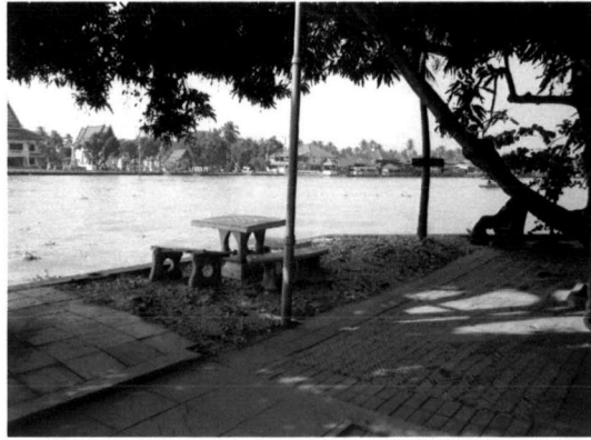
ภาพที่ 5.4 ที่ว่างบริเวณริมแม่น้ำภายในชุมชนเมือง

4) การปรับปรุงทางเข้าออกบริเวณร้านค้าปลีก ร้านค้าส่งให้กว้างขวางและสะดวกในการขนส่งสินค้า เช่น บริเวณท่าหน้าโรงงานเครื่องปั้นดินเผาทางฝั่งเมืองในเขตเทศบาลนครปากเกร็ด ควรปรับปรุงให้มีสภาพแข็งแรง และสามารถขนส่งสินค้าเครื่องปั้นดินเผาทางเรือได้อย่างสะดวก ซึ่งมีการขนส่งสินค้าจากฝั่งเกาะเกร็ดมาขายยังฝั่งเมือง