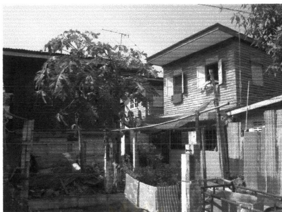
ภาพที่ 5.12 สภาพบ้านเรือนริมน้ำในชุมชนเกาะเกร็ดที่ขาดการดูแลรักษา