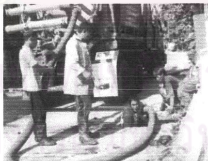
ภาพที่ 5.3 ขุดลอกท่อระบายน้ำในชุมชนเมือง

2) การปรับปรุงระบบระบายน้ำในชุมชน ไม่ให้มีขยะอุดตันในทางระบายน้ำในเขตเมืองเทศบาลนครปากเกร็ด โดยการขุดลอกท่อระบายน้ำเดือนละครั้ง เพื่อป้องกันปัญหาน้ำท่วมขัง