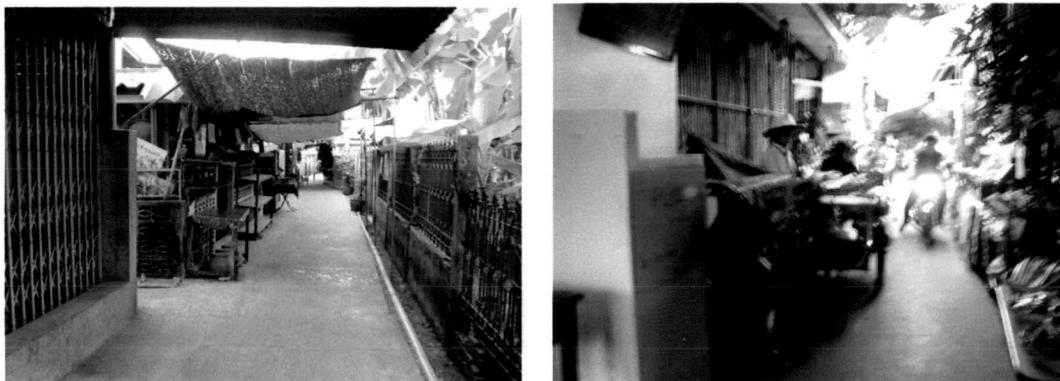
ภาพที่ 5.10 สภาพถนนทางเดินในชุมชนเกาะเกร็ดมีลักษณะแคบ

10) การปรับปรุงสภาพแวดล้อมทางกายภาพบริเวณริมน้ำรอบเกาะ และการจัดระเบียบการใช้ประโยชน์ที่ดินตั้งที่อยู่ริมน้ำและพื้นที่ต่อเนื่องด้านในเกาะ เช่น การจัดระเบียบบริเวณที่มีการค้าขาย ให้มีความเป็นระเบียบเรียบร้อยไม่กีดขวางทางเดิน เนื่องจากทางเดินในชุมชนเกาะเกร็ดเป็นทางเดินแคบ เป็นต้น