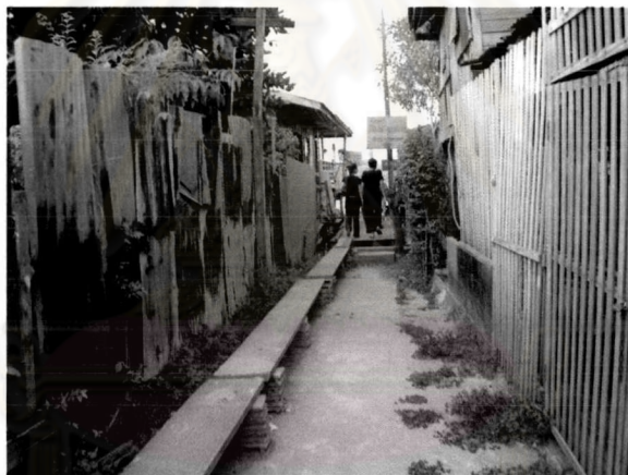
ภาพที่ 5.11 สภาพแวดล้อมบริเวณริมน้ำรอบเกาะและพื้นที่ต่อเนื่องด้านใน

10) การปรับปรุงสภาพแวดล้อมทางกายภาพบริเวณริมน้ำรอบเกาะ และการจัดระเบียบการใช้ประโยชน์ที่ดินตั้งที่อยู่ริมน้ำและพื้นที่ต่อเนื่องด้านในเกาะ เช่น การจัดระเบียบบริเวณที่มีการค้าขาย ให้มีความเป็นระเบียบเรียบร้อยไม่กีดขวางทางเดิน เนื่องจากทางเดินในชุมชนเกาะเกร็ดเป็นทางเดินแคบ เป็นต้น