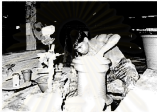
ภาพที่ 5.13 การฝึกอบรมอาชีพให้กับคนในชุมชน

5) ส่งเสริมการฝึกอบรมคนเพื่อไปทำงาน เช่น การฝึกอบรมอาชีพ การพัฒนาฝีมือแรงงาน ทั้งในภาคเกษตรกรรม หัตถกรรม อุตสาหกรรม และกิจกรรมการค้าทั้งในพื้นที่ชุมชนเมืองในเขตเทศบาลนครปากเกร็ดและพื้นที่เกาะเกร็ด โดยเฉพาะบริเวณที่เป็นตลาดน้ำ ย่านการค้าหรือบริเวณศูนย์กลางเมืองที่ตลาดปากเกร็ดและภายในชุมชน