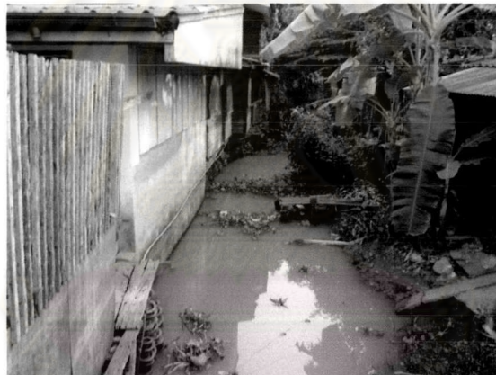
ภาพที่ 5.7 สภาพคูคลองในชุมชนเกาะเกร็ดที่ขาดการดูแลรักษา

6) การปรับปรุงสภาพคูคลองและระบบการระบายน้ำในชุมชนให้มีการไหลเวียนของกระแสน้ำได้สะดวก โดยการขุดลอกคูคลองไม่ให้ตื้นเขิน และระบบเครือข่ายลำน้ำที่สามารถเชื่อมโยงกันจนเป็นเครือข่ายที่สมบูรณ์ให้เข้าถึงพื้นที่ด้านในชุมชน และช่วยกันรักษาความสะอาดในแม่น้ำลำคลอง