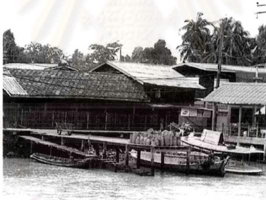
ภาพที่ 5.5 บริเวณท่าหน้าขนส่งสินค้าในชุมชนเมืองที่ไม่แข็งแรง

4) การปรับปรุงทางเข้าออกบริเวณร้านค้าปลีก ร้านค้าส่งให้กว้างขวางและสะดวกในการขนส่งสินค้า เช่น บริเวณท่าหน้าโรงงานเครื่องปั้นดินเผาทางฝั่งเมืองในเขตเทศบาลนครปากเกร็ด ควรปรับปรุงให้มีสภาพแข็งแรง และสามารถขนส่งสินค้าเครื่องปั้นดินเผาทางเรือได้อย่างสะดวก ซึ่งมีการขนส่งสินค้าจากฝั่งเกาะเกร็ดมาขายยังฝั่งเมือง