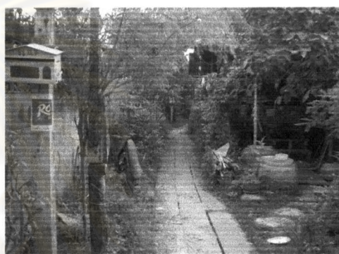
ภาพที่ 5.2 บริเวณทางเข้าชุมชนพื้งน้ำ

2) การปรับปรุงระบบระบายน้ำในชุมชน ไม่ให้มีขยะอุดตันในทางระบายน้ำในเขตเมืองเทศบาลนครปากเกร็ด โดยการขุดลอกท่อระบายน้ำเดือนละครั้ง เพื่อป้องกันปัญหาน้ำท่วมขัง