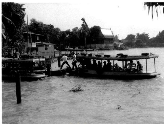
ภาพที่ 5.8 บริเวณท่าเรือวัดกลางเกร็ดที่มีสภาพไม่แข็งแรง

8) ปรับปรุงบริเวณพื้นที่เปิดโล่งบริเวณริมน้ำเพื่อเปิดทัศนวิสัยบริเวณที่มีคุณค่าและความสำคัญทางสภาพแวดล้อม รวมถึงการจัดหาพื้นที่ลานโล่งเพื่อทำกิจกรรมร่วมกันในชุมชน