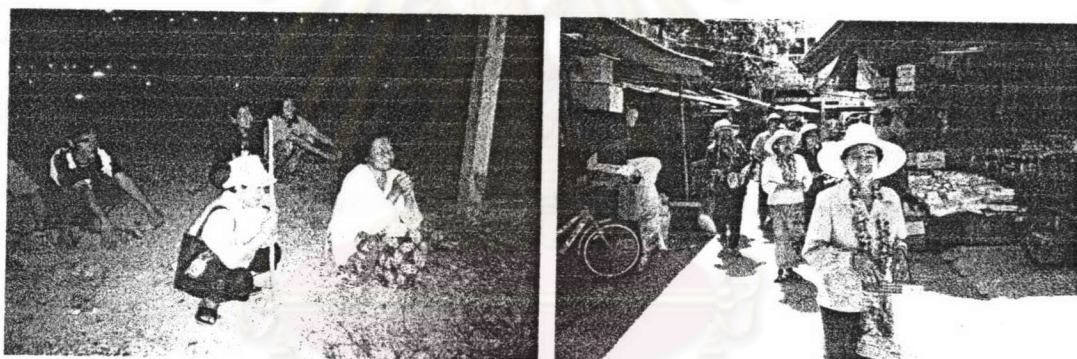
ภาพ ๔ การแต่งกายของคณะเพลงบอกบุญ จังหวัดตราด

โดยส่วนใหญ่แล้วผู้ร้องเพลงบอกบุญมักจะแต่งกายด้วยเสื้อผ้าเก่าๆ และสวมหมวก ทั้งนี้เพื่อสวมบทบาทของผู้ขาดแคลนและให้สอดคล้องกับบทร้อง การแต่งกายในลักษณะนี้จะช่วยโน้มน้าวใจผู้ฟังที่ได้พบเห็นได้ แต่อย่างไรก็ตามกลวิธีโน้มน้าวใจด้วยการแต่งกายนี้พบว่าจะใช้ได้ผลเฉพาะผู้ที่ไม่รู้จักคุ้นเคยกับผู้ร้องเท่านั้น เพราะผู้ที่รู้จักกับผู้ร้องเพลงบอกบุญจะทราบดีว่าผู้ร้องเหล่านี้มีฐานะทางการเงินที่อยู่ในเกณฑ์ดี การแต่งกายแบบนี้เป็นการแต่งกายเพื่อสวมบทบาท "ผู้ขอ" เท่านั้น ดังภาพตัวอย่างการแต่งกายของผู้ร้องเพลงบอกบุญ ดังนี้