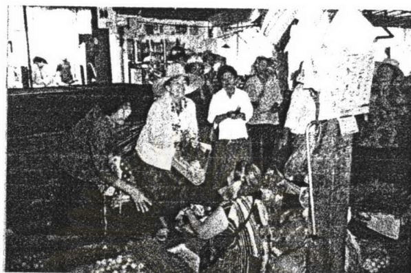
ภาพ ๓ การทักทายระหว่างคณะเพลงบอกบุญกับชาวบ้าน

มาร่วมทำทากับคณะเพลงบอกบุญด้วย ในขณะที่ฝ่ายผู้ร้องเองก็ปฏิบัติต่อผู้ฟังอย่างดีเช่นกัน โดยการไต่ถามสารทุกข์สุกดิบอย่างเอาใจใส่ต่อผู้ฟัง