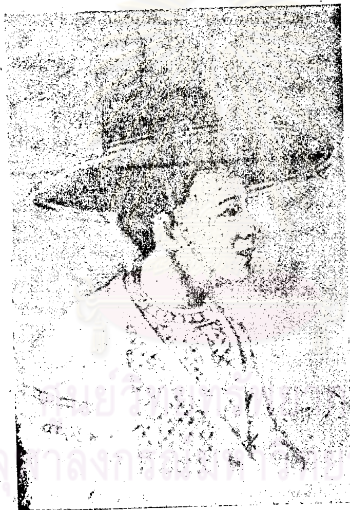
เจ้าพระยามหาโยธา นราธิบดีศรีพิไชยณรงค์ (เจ่ง) (พระยามหาโยธา หรือ พระยาเจ่ง)